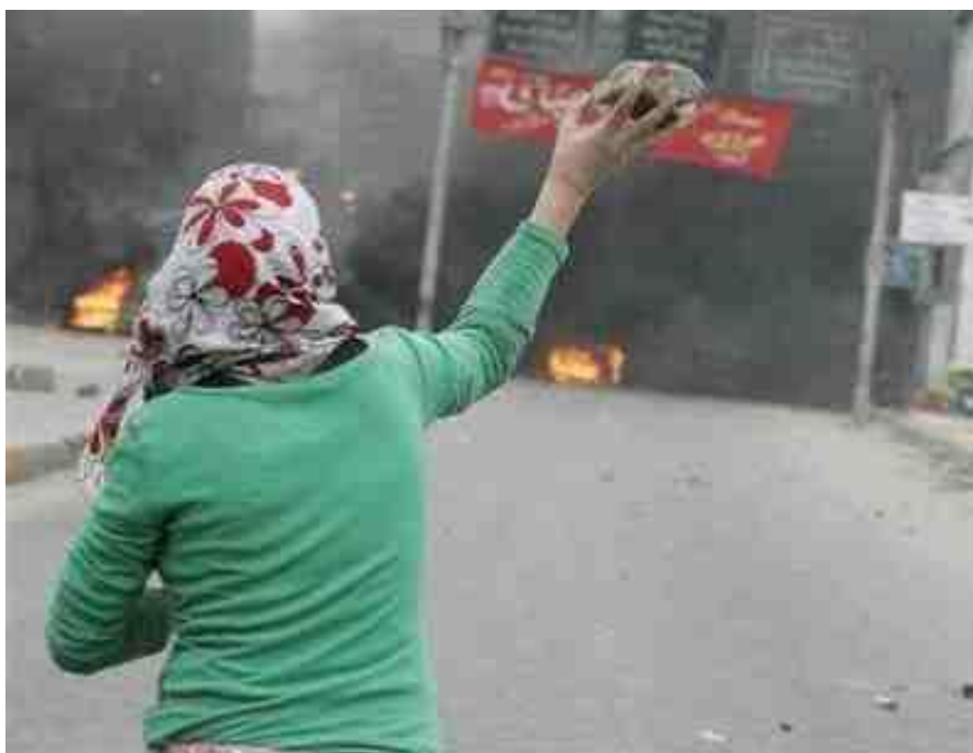
Obr. 12. žena vrhající kámen při první intifádě

I když se Arafat později snažil intifádu prezentovat jako dílo OOP, ve skutečnosti vypukla do značné míry spontánně a palestinské vedení v Tunisku jí bylo v první chvíli dokonce zaskočeno. Pro intifádu se staly charakteristické hlavně palestinské demonstrace a nepokoje, vrhání kamenů, molotovových koktejlů a někdy i používání lehkých zbraní. Těžké zbraně a sebevražedné útoky nebyly pro první intifádu příznačné.