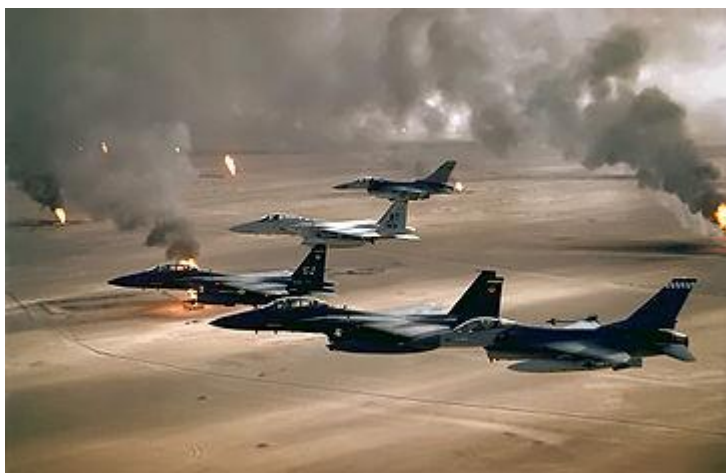
Obr. 15. přelety stíhacích letounů během operace „Pouštní bouře“

Irácký útok na Kuvajt z 2. srpna 1990 se stal vážnou hrozbou pro americké zájmy v oblasti. Zároveň však dal Spojeným státům dobrou záminku k posílení jejich přítomnosti v oblasti s odůvodněním pomoci arabskému státu. Nedlouho po invazi tak začala operace s kódovým označením „Pouštní bouře“ (Desert Storm), v jejímž rámci začaly USA za pomoci mezinárodní koalice a s vědomím OSN vytlačovat iráckou armádu z Kuvajtu.