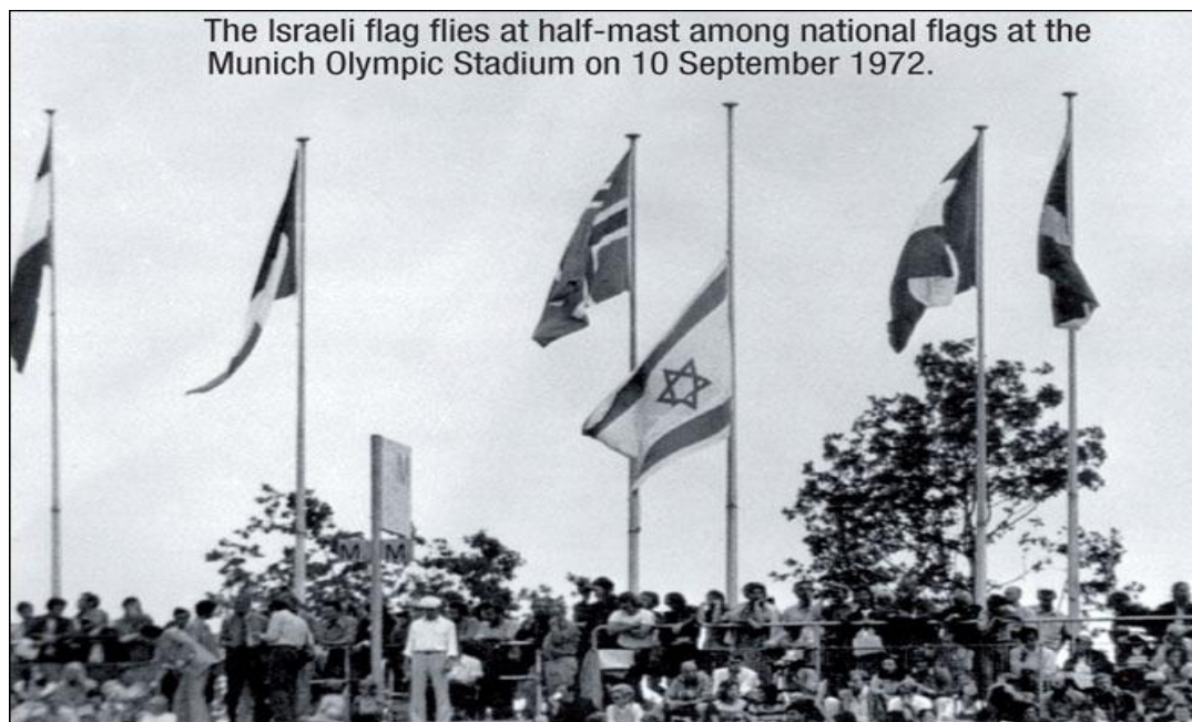
Obr. 7. Izraelská vlajka na půl žerdi na olympijském stadionu v Mnichově 10. září 1972

izraelská vláda odmítla, pokusila se německá policie osvobodit rukojmí násilím. Záchraná akce ale skončila nezdarem - jedenáct izraelských atletů, pět z devíti únosců a jeden německý policista zahynuli. Na smrt olympioniků odpověděl Izrael nekompromisní likvidací palestinských teroristů v zahraničí. [3]