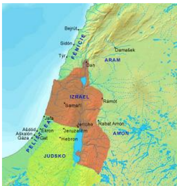
Obr. 1. mapa oblasti Kanaán-území dnešního Izraele

[zdroj obrázku uveden v použité literatuře, zdroj číslo [12]]