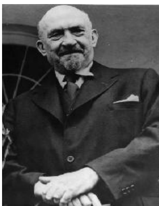
Obr. 4. první prezident Izraele Chajim Weizmann

Vývoj Izraele v prvních letech jeho novodobé existence byl značně bouřlivý. Během roku 1949 došlo sice k uvedenému podepsání příměří s Libanonem, Egyptem, Jordánskem a Sýrií, avšak válečný stav s těmito zeměmi neskončil a také vnitropolitická situace byla značně napjatá. V prvních volbách zvítězili labouristé sdružení ve straně Mapaj (zkratka pro „Dělnickou stranu Izraele“). Prvním premiérem Izraele se stal David Ben Gurion a prvním prezidentem Chajim Weizmann. Nejsilnějším článkem opozice se stala formace Chérut (bývalý Irgun) pod vedením Menachema Begina. Všichni tedy nejvýznamnější představitelé předstátních sionistických hnutí.