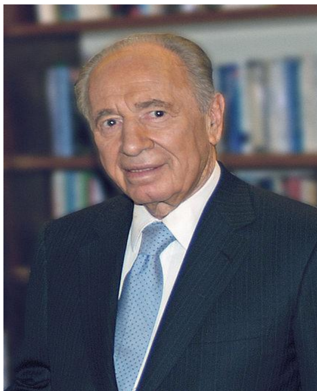
Obr. 18. Šimon Peres

jeho přísné potrestání, či dokonce smrt. Na demonstracích pravice, kde nezřídka vystupovali i Šaron a Netanjahu, se objevovaly Rabinovy portréty v uniformě SS s hákovým křížem na rukávu, figuríny premiéra houpající se na šibenici apod. Rabin proto šéfa opozice obviňoval, že i on svým postojem přispívá k podněcování nenávisti a násilí Židů proti Židům. Netanjahu tato obvinění vždy odmítal. Situace pro izraelského premiéra a jeho spolupracovníky začala být skutečně nebezpečnou.