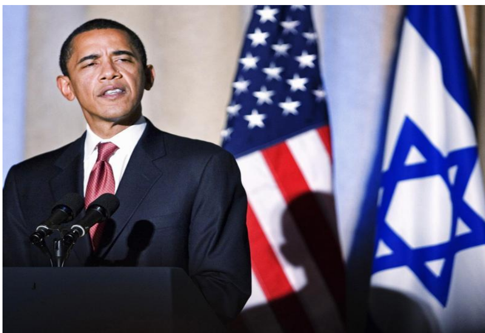
Obr. 27. Barack Obama

Americký prezident Barack Obama, který trvá na tom, že jeho vláda pokládá Izrael, jako svého přítele, to dokazuje docela zvláštním způsobem. Necelého půl roku zpět přiměl spoustu lidí k zamyšlení, když ohlásil, že Spojené státy plánují další kolo prodeje zbraní do Saúdské Arábie. Hodnota této transakce měla koketovat s hranicí 60 miliard dolarů. Saúdští Arabové by měli dostat nejlepší americkou bojovou techniku včetně bombardovacích letounů typu F-15, vrtulníků Blackhawk a Apache, bomb naváděných laserem, vyspělých radarových soustav a raket Harpoon a Sidewinder.