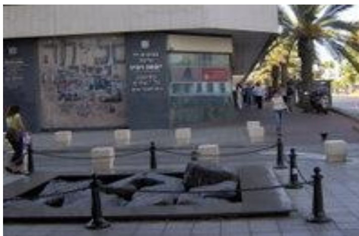
Obr. 19. telavivská radnice-místo, kde byl spáchán atentát na Rabina

o Žida původem z Jemenu, náboženského sionistu, stoupence osadnictví a studenta práv a informatiky na náboženské univerzitě Bar-Ilan nedaleko Tel-Avivu. Amir chtěl Rabina zabít předtím již dvakrát, ale atentát vždy překazily nečekané okolnosti. Před izraelským soudem Amir vypověděl, že údajně jednal v souladu s židovským náboženským právem - Halachou, Rabina považoval za teroristu a svůj čin vykonal ve jménu Tóry a izraelského lidu. Doslova řekl, že: „Každý Žid, který ponechá svůj lid nebo území nepříteli podobně jako Rabin, musí být zabit. Studoval jsem Halachu celý život a dobře vím, o čem mluvím". Proces s Amirem také odhalil Jigal Amir skutečnost, že někteří rabíni z Rady židovských osad (Ješa) nazvali Jicchaka Rabina tituly rodef a moser, což jsou jedny z nejtěžších halachických obvinění Žida. Opravňují zabít „zrádného Žida" bez soudu, aby byly zachráněny další židovské životy. Amir otevřeně přiznal, že se těmito religiózními interpretátory (či spíše dezinterpretátory) židovského práva z řad rabínských autorit náboženských osadníků inspiroval.