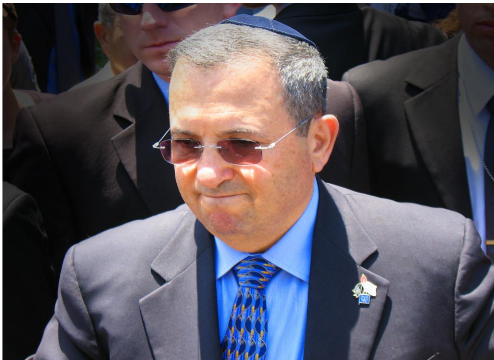
Obr. 21. Ehud Barak

V květnu 1999 se v Izraeli konaly předčasné parlamentní volby, ve kterých zvítězil předseda Strany práce Ehud Barak. Jím vytvořená vláda však byla velmi nesourodá, obsahující politické strany jak levicového spektra (Merec), tak například ultrakonzervativní uskupení Šas. Nový izraelský premiér oproti svému předchůdci Benjaminu Netanjahuovi byl ochoten pro zmírnění napětí a řešení konfliktu s Araby nabídnout dalekosáhlejší ústupky. Mezi jeho hlavní iniciativy patřilo stažení izraelské armády po 22 letech z jižního Libanonu.