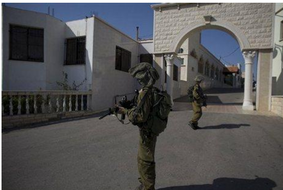
Obr. 10. Izraelská patrola na území farmy Šebá

I po izraelském odchodu z Libanonu přetrvaly spory o malé území o rozloze cca 25 km 2 , zvané „farmy Šebá“. Libanon i Sýrie tvrdí, že farmy jsou součástí Libanonu, a tudíž z něj měli Izraelci odejít. Izrael však trvá na tom, že se z Libanonu stáhl kompletně na základě rezoluce Rady bezpečnosti č. 425. Farmy jsou součástí syrských Golanských výšin, což znamená, že mají rovněž status okupovaného území. Stejný názor na tuto věc sdílí i OSN. [2]