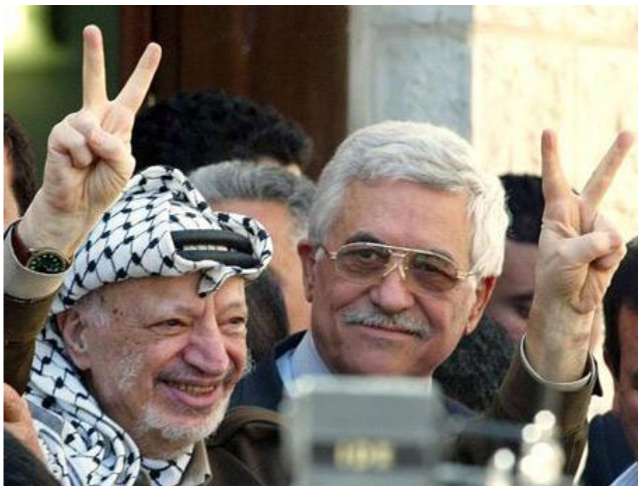
Obr. 24. Jásir Arafat a Mahmúd Abbás přibližně rok před volbami