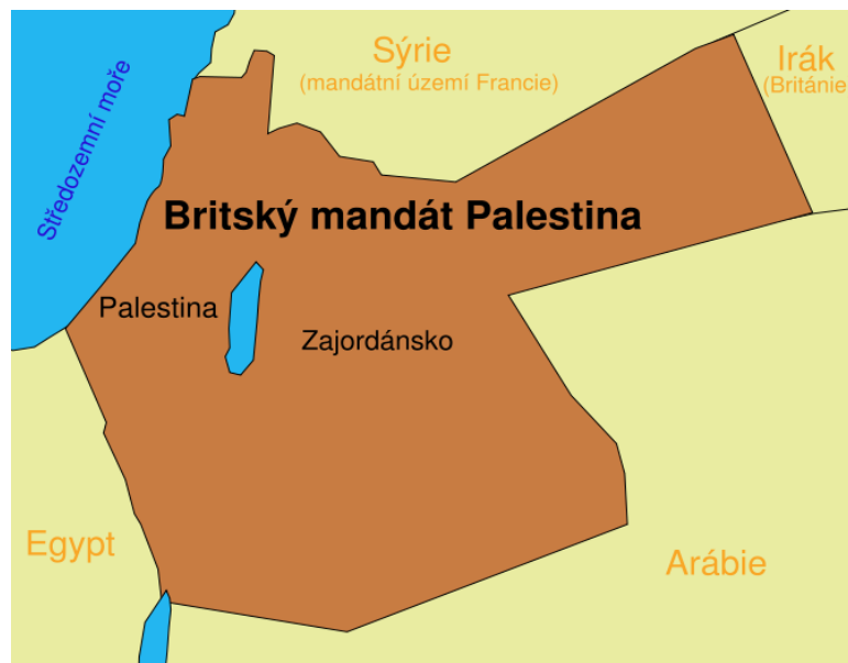
Obr. 2. mapa Britského mandátu Palestina

[zdroj obrázku uveden v použité literatuře, zdroj číslo [13]]