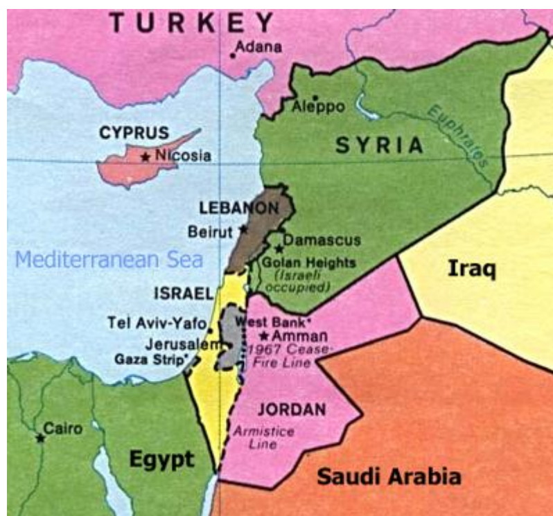
Obr. 28. mapa Izrael a sousední státy

V postavení proti některému ze sousedů, či jiného znepráteného státu se může Izrael ocitnout v podstatě kdykoli. Můžeme jen stěží předpokládat, kdo bude další protějšek, kterému se bude muset židovský stát bránit a ukázat svoji sílu s co možná nejmenšími následky a ujmy na zdraví a životech.