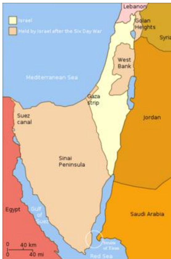
Obr. 6. Území obsazená Izraelem během šestidenní války

[zdroj obrázku uveden v použité literatuře, zdroj číslo [15]]