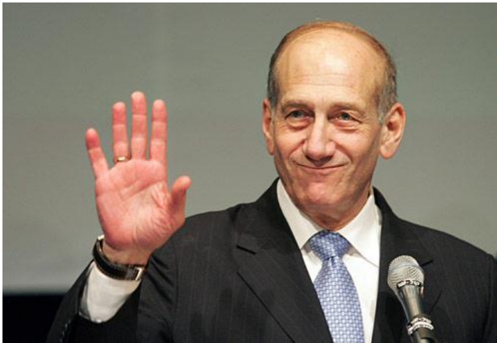
Obr. 26. Ehud Olmert

Téměř dva roky po skončení války byly 16. července 2008 do Izraele vráceny ostatky dvou unesených vojáků. Izrael výměnou odevzdal ostatky zhruba 200 padlých bojovníků z první libanonské války a také propustil 5 zadržovaných vězňů.