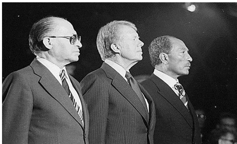
Obr. 8. Menachem Begin, Jimmy Carter a Anwar Sadat při vyjednávání míru v Camp Davidu roku 1978.

Prohlubující se ekonomická krize a neúspěch válečného řešení problému přivedl egyptského prezidenta Sadata k zintenzivnění snah o uzavření míru s Izraelem. Vyjednávání začala roku 1977 a skončila roku 1979 podepsání mírové smlouvy Sadatem a Beginem v Bílém domě. Izrael se zcela stáhl ze Sinaje a předal jej Egyptu, který na oplátku přiznal Izraeli právo průjezdu Suezským průplavem i Tiranskými úžinami a zavázal se redukovat počet vojáků na polovinu