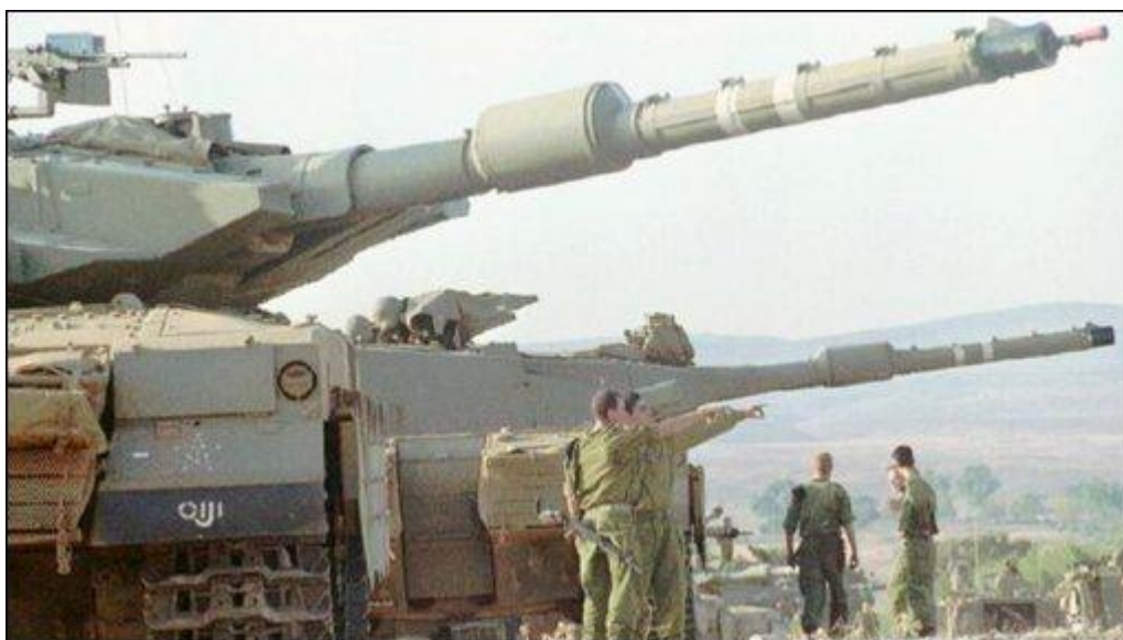
Obr. 9. Izraelské tanky v Libanonu 1982

Izrael k větší zdrženlivosti a dohodl odchod OOP z Tuniska (které navrhli rovněž Američané). V Libanonu byl také rozmístěn mezinárodní vojenský kontingent složený z amerických, francouzských a italských vojáků. Dne 22. srpna 1982 začalo pod mezinárodním dohledem stahování oddílů OOP po moři. Sám Arafat se tehdy dostal na mušku izraelského odstřelovače, ale na výslovný pokyn izraelské vlády zabit nebyl. Válka byla oficiálně ukončena 1. září 1982. Stála životy 17 825 Libanonců, vesměs civilistů, a 675 izraelských vojáků.