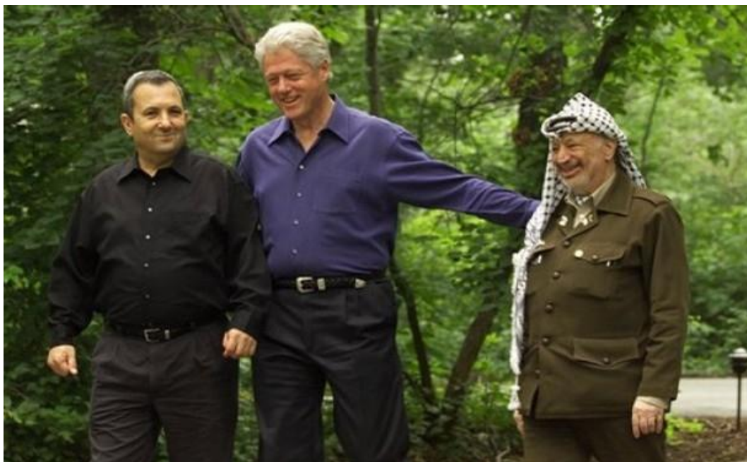
Obr. 22. Ehud Barak, Bill Clinton a Jaásir Arafat na mírovém summitu v Camp David červenec 2000

[zdroj obrázku uveden v použité literatuře, zdroj číslo [21]]