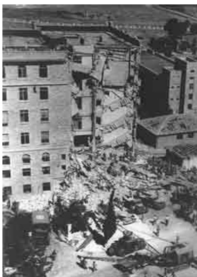
Obr. 3. King David Hotel po explozi

Když 14. května (tedy den před vypršením britského mandátu v Palestině) britští vojáci opustili Jeruzalém, rozhodlo se židovské vedení vyhlásit nezávislost. Slavnostní Prohlášení nezávislosti přečetl v 16 hodin v Tel Avivu David Ben Gurion. Mezinárodního uznání se Státu Izrael vzápětí dostalo od USA i SSSR. [13]