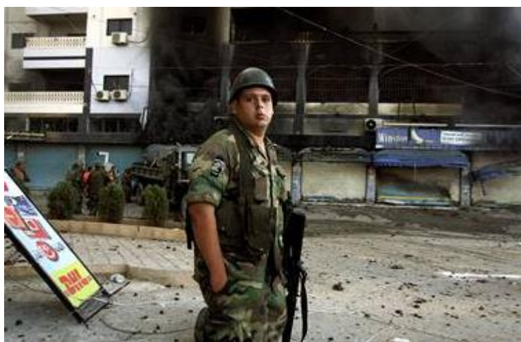
Obr. 25. Libanonský voják před zničeným supermarketem ve městě Tyr

Po dlouhém měsíci bojů bylo nakonec z iniciativy OSN uzavřeno příměří 14. srpna. Za vítěze války se považovaly obě strany. Hlavními podmínkami, které musely obě válčící strany dodržet, bylo zastavení všech útoků a stažení všech jednotek. V případě Izraele za svojí státní hranici, v případě Libanonu do vnitrozemí. Libanonu byla od mezinárodního společenství přislíbena finanční pomoc na obnovu zničené infrastruktury. [24]