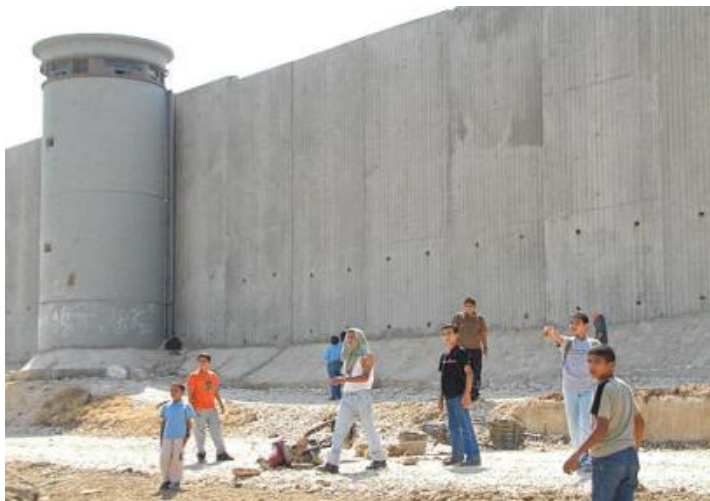
Obr. 23. bezpečnostní bariéra

Vláda Ariela Šarona nepojala výstavbu bariéry ve smyslu hranice Západního břehu po Šestidenní válce ("zelená linie") v roce 1967 a na mnoha místech ji výrazně překročila ve prospěch Izraele. Bariéra dokonce zabrala i řadu palestinských vesnic, jiné zase rozdělila. Její bezpečnostní charakteru ve smyslu ochrany proti pronikání palestinských teroristů je tedy značně v rozporu s jejím provedením. To naopak může do budoucna přinášet řadu dalších komplikací.