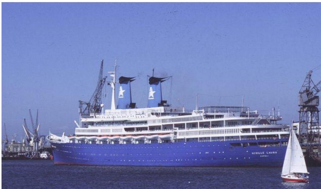
Obr. 11. výletní italská loď Achille Lauro v roce 1985

Šimon Peres se ještě pokusil zahájit mírová jednání s Jordánskem a Marokem. Pro Jicchaka Šamira, který na základě rotačního principu nastoupil na konci října 1986 do izraelského premiéřského křesla, nebyly podobné aktivity rozhodně prioritou. [1]