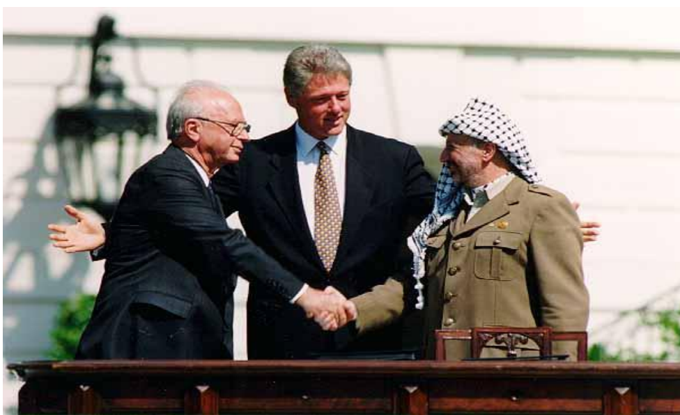
Obr. 16. Jicchak Rabin, Bill Clinton a Jásir Arafat po podepsání Mírových dohod z Osla ve Washingtonu 13. září 1993.

Bill Clinton ve svých pamětech popisuje okamžiky těsně před setkáním Arafata a Rabina: „Věděl jsem, že Arafat se rád předvádí a že by se mohl po stisku ruky pokusit Rabina políbit. Tony Lake (národní bezpečnostní poradce) prohlásil, že zná metodu, jak si s Arafatem potřást rukama a vyhnout se při tom polibku. Popsal nám ten proces a my jsme ho začali nacvičovat. Já jsem dělal Arafata a on dělal mě. Když jsem mu potřásl rukou a chystal jsem se ho políbit, položil mi levou dlaň na pravé předloktí a stiskl. Okamžitě jsem se zarazil. Zkoušeli jsme to ještě párkrát, dokud jsem si nebyl jistý, že Rabinova tvář zůstane netknutá. Všichni jsme se tomu smáli, ale já jsem věděl, že pro Rabina je nesmírně důležité vyhnout se tomu polibku.“