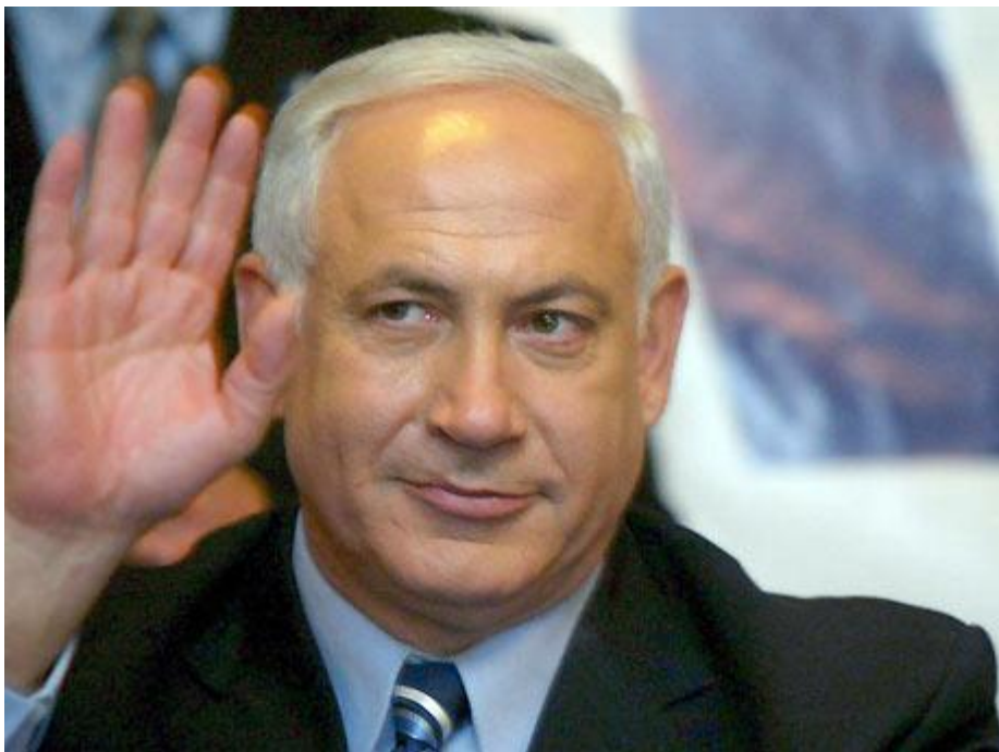
Obr. 20. Izraelský premiér Benjamín Netanjahu

V následujících izraelských volbách si veřejnost unavená věčným bojem zvolila do čela levici a premiérem se stal umírněný politik Ehúd Barak, který vystřídal „kontroverzního“ premiéra Benjamína Netanjahu. Jeho umíněnost šla tak daleko, že připustil i možnost opětovného rozdělení Jeruzaléma. Následkem toho ztratil zcela nejen podporu mezi Izraelci, ale povzbudil tak Palestince k dalším útokům a vzájemné útoky i nadále nebraly konci.