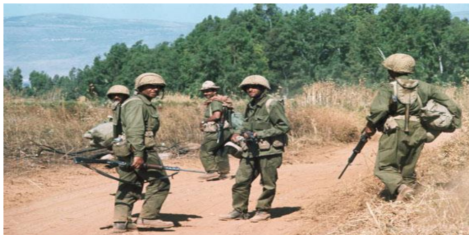
Obr. 5. skupina Izraelských vojáků během šestidenní války