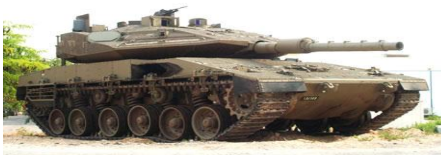
Obr. 29. Merkava MK4

Dosažení úspěchu v případném boji se neodvívá pouze od úderů tankových sil, ale od celkové koncepce armádního útoku. Rychlého vítězství může být docíleno v podstatě jakýmkoliv účinným a bleskovým zákrokem. V regionu, který řešíme je ale tanků velmi mnoho a značná část je jich na vysoké technické úrovni. Za zmínku stojí izraelský tank Merkava MK4, který je ve výzbroji od roku 2004 a jedná se o absolutní špičku na světě. Blesková válka je tedy možná i v případě asymetrických válek či kombinací asymetrických a technologických válek. A Izrael asi bude nucen se na tento způsob války připravit. Z pohledu asymetrické strategie vystupují dva základní principy pro Izrael, pokud by chtěl asymetrickou aplikovat.