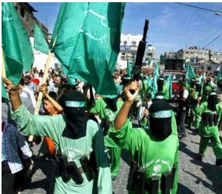
Obr. 14. členové islámistické organizace Hamas

[zdroj obrázku uveden v použité literatuře, zdroj číslo [17]]