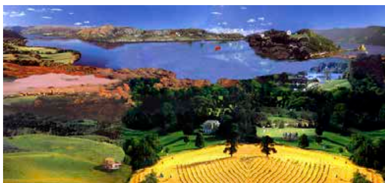
ŠTEPÁNKA ŠIMLOVÁ, Krajiny (1999)