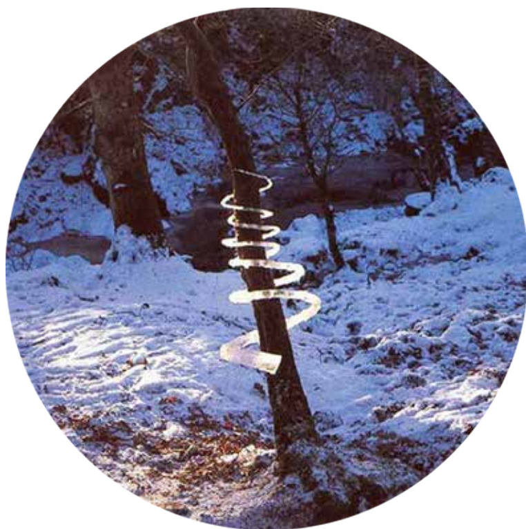
ANDY GOLDSWORTHY, Krápníky zrekonstruované okolo stromu (1995)