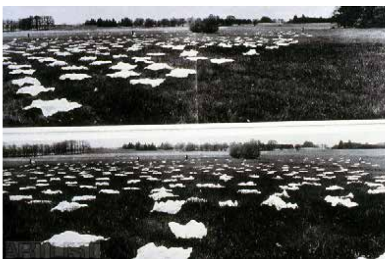
ZORKA SÁGLOVÁ, Kladení plen u Sudoměře (1970)