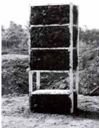
VLADIMÍR MERTA, Přerušovaný proces II (1982)