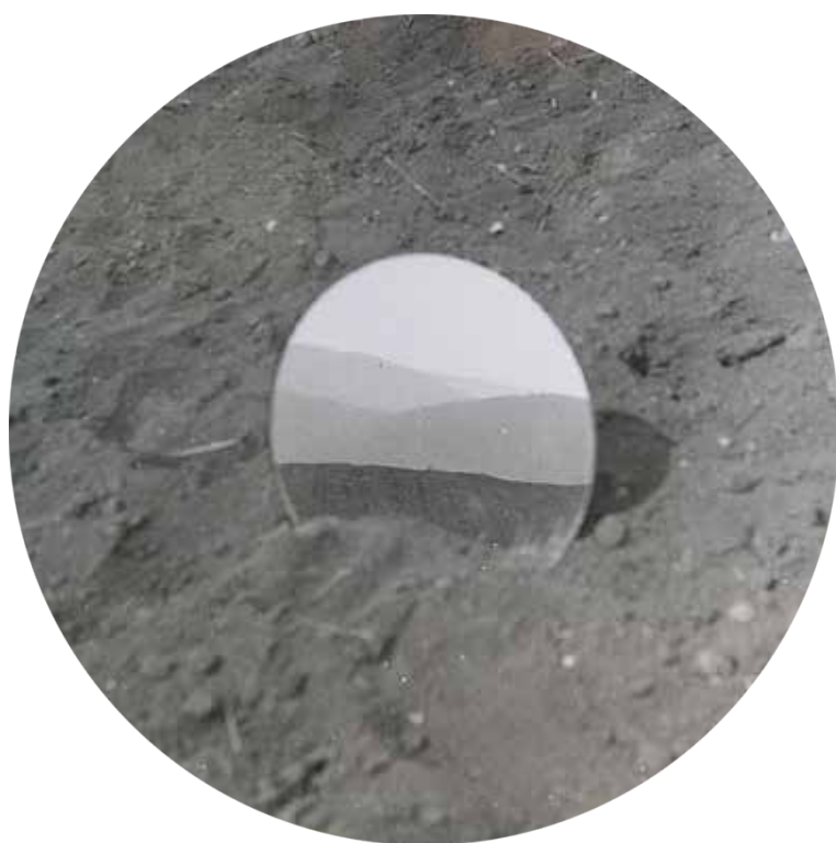
DALIBOR CHATRNÝ, Souvislosti protilehlých horizontů (1973)