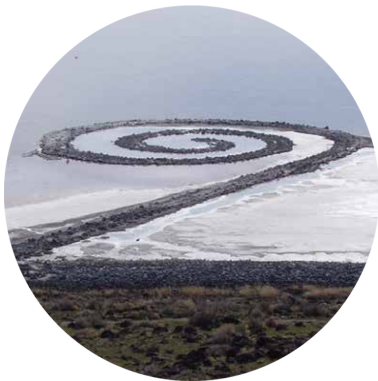
ROBERT SMITHSON, Spirálové molo, 1970