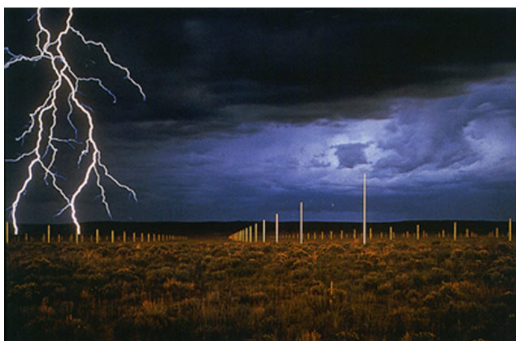
WALTER DE MARIA, The Lightning Field (1977)