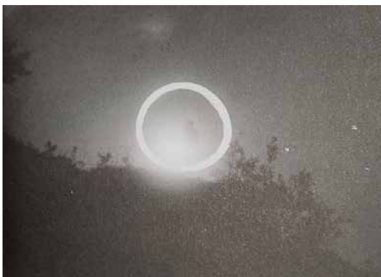
MILOŠ ŠEJN, Padající slunce (1983)