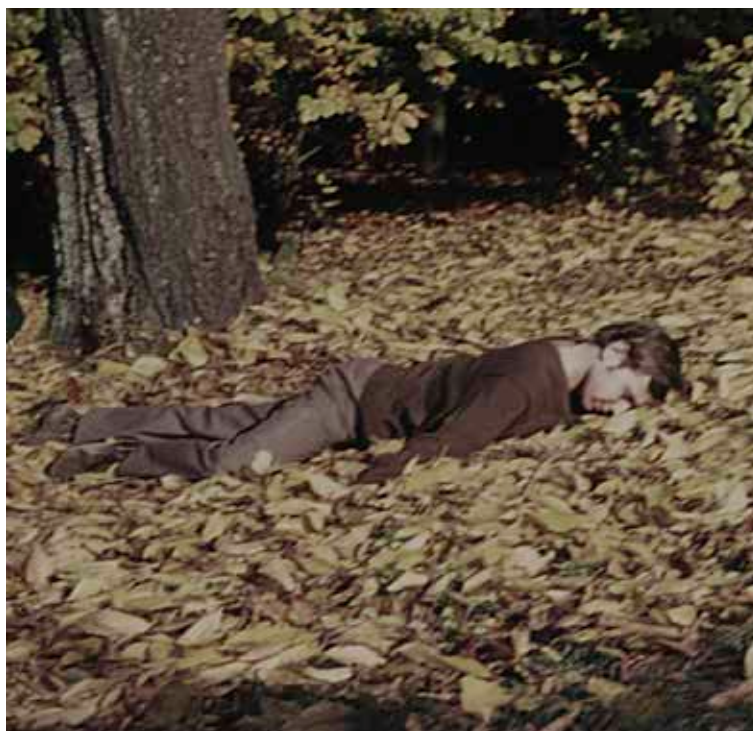
MILOŠ ŠEJN, Bdělé snění (1971)