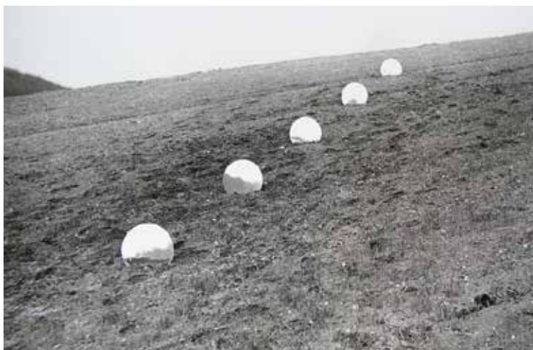
DALIBOR CHATRNÝ, Souvislosti protilehlých horizontů (1970)