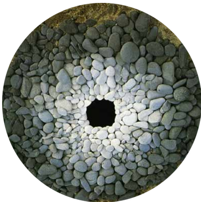
ANDY GOLDSWORTHY, Oblázky okolo díry (nedatováno)