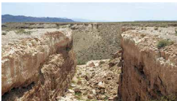
MICHAEL HEIZER, Double Negativ (1969-1970)