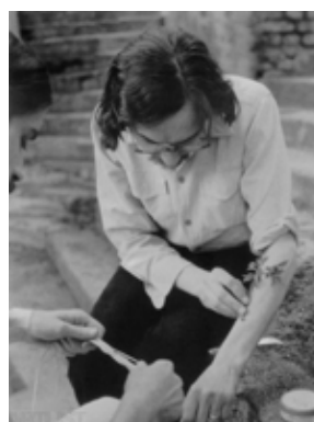
PETR ŠEMBERA, Spánek na stromě (1975) a Štěpování (1975)