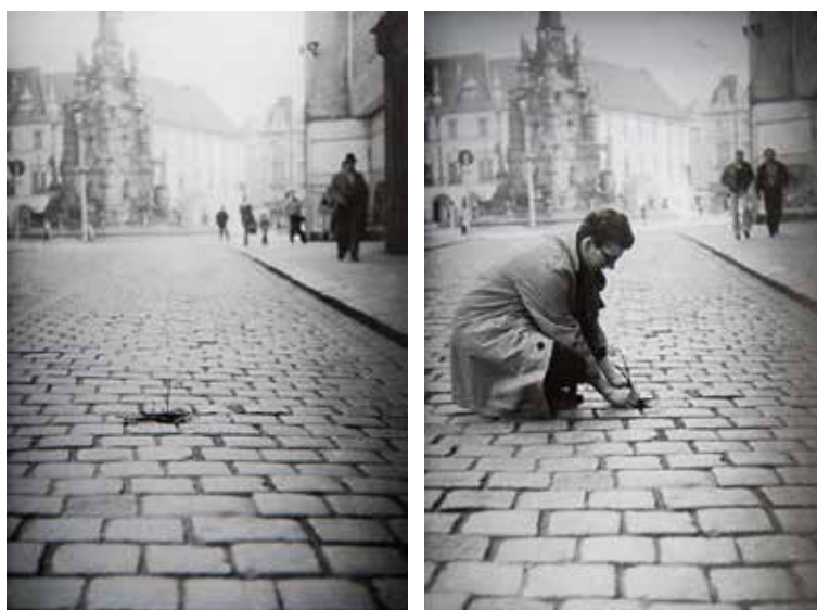
VLADIMÍR HAVLÍK, Pokusná květina (1981)