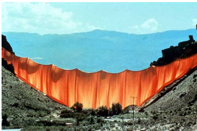
CHRISTO – JEANNE-CLAUDE, (Valley Curtain, 1970-1972)