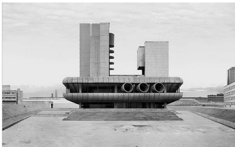
BEATE GÜTSCHOW, S #14 (2006)