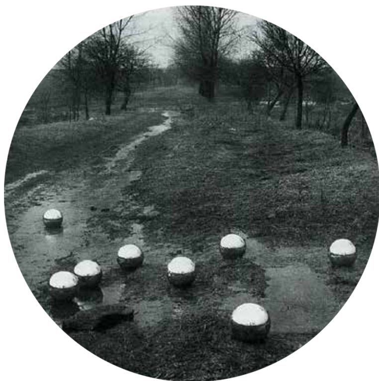
HUGO DEMARTINI, Akce v krajině (1968)