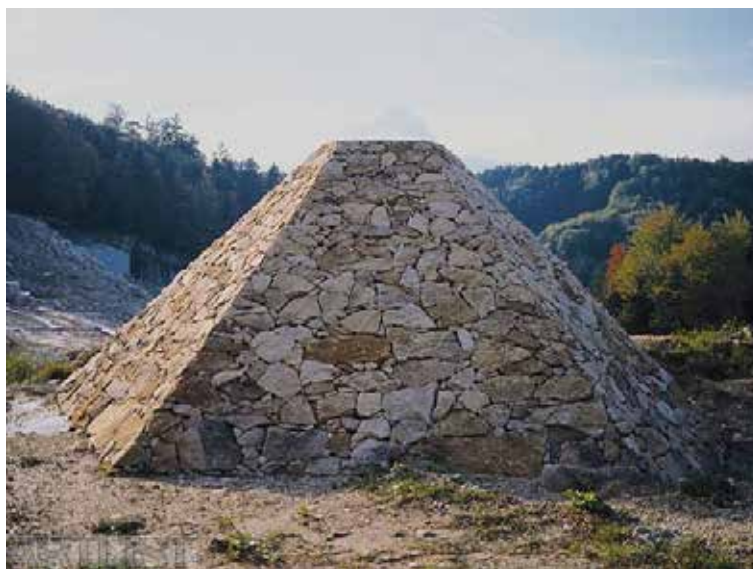
IVAN KAFKA, Skutečnost a sen (1990)