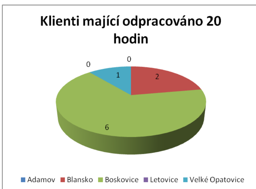
Graf č. 3:

V uvedeném měsíci a obvodu odpracovalo 9 klientů po 20 hodinách. V Blansku to byli 2 klienti, v Boskovicích 6 a ve Velkých Opatovicích 1 klient.