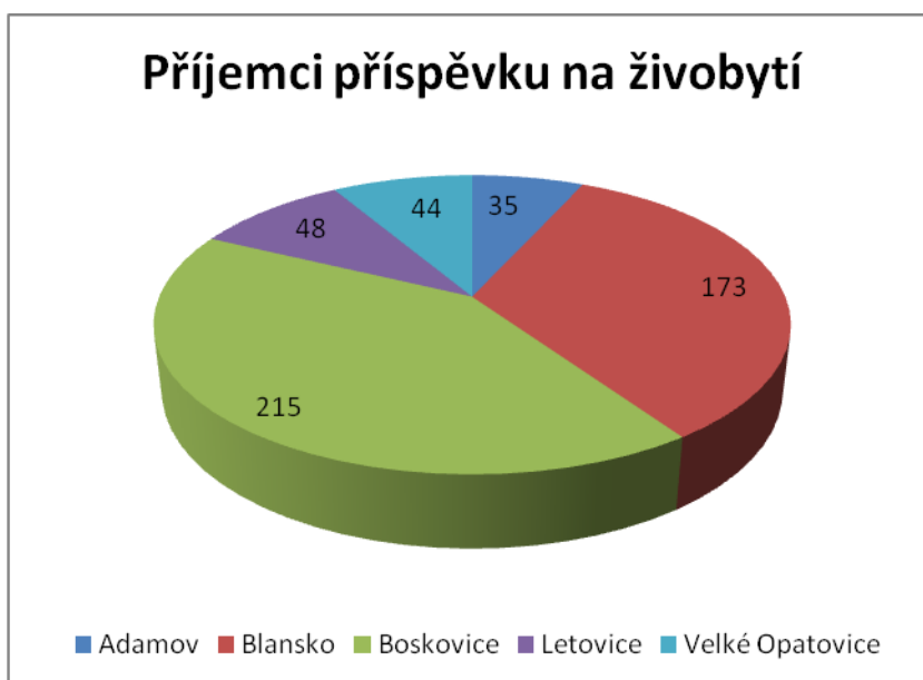
Graf č. 1:

V dotazníkovém šetření jsem zjistila, že v uvedeném obvodu bylo v měsíci listopadu roku 2011 celkem 515 příjemců dávky příspěvek na živobytí. V Adamově to bylo 35 osob, v Blansku 173, v Boskovicích 215, v Letovicích 48 a ve Velkých Opatovicích 44 osoby.