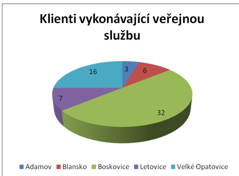
Graf č. 2:

Celkem v měsíci listopadu roku 2011 vykonávalo veřejnou službu 64 klientů, v Adamově 3, v Blansku 6, v Boskovicích 32, v Letovicích 7 a ve Velkých Opatovicích 16 klientů.