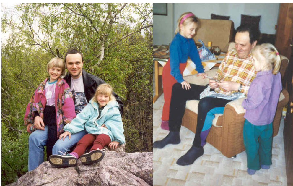
Obr. 6 – Táta s dětmi z období, kdy se jejich matce ještě se nepodařilo dětem pokřivit hodnoty