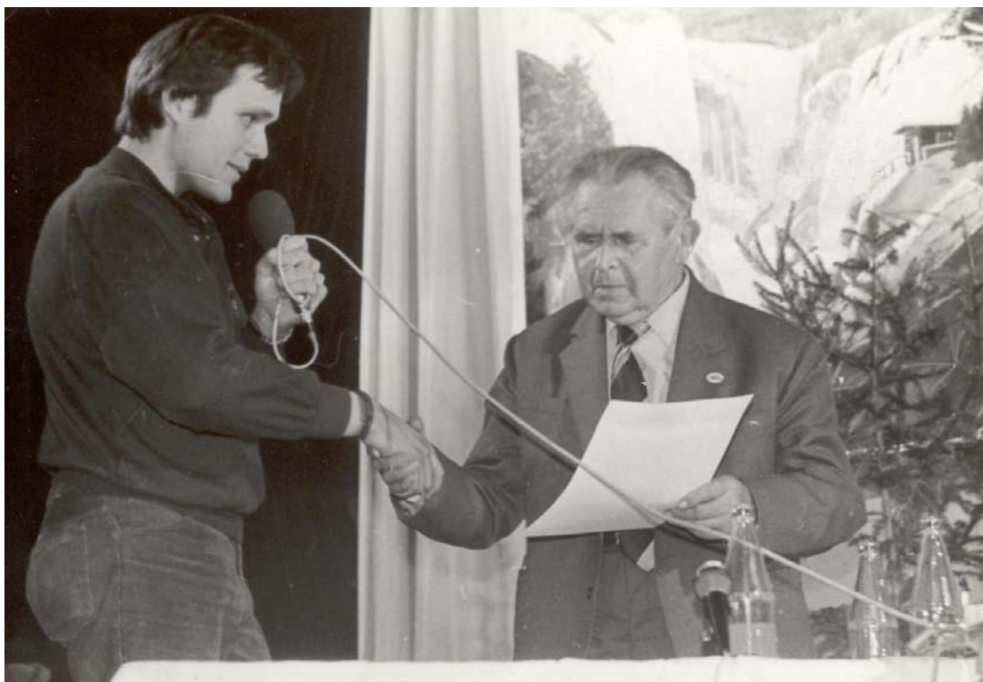
Obr. 4 – Autor bakalářské práce s Jaroslavem Foglarem