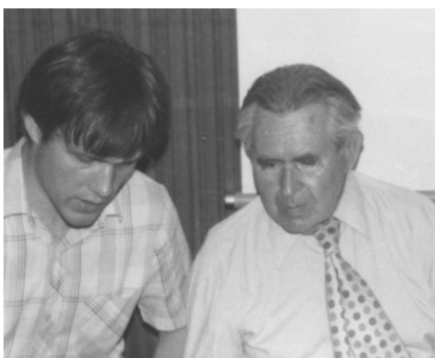
Obr. 1 – Autor bakalářské práce s Jaroslavem Foglarem

Dlouhá léta jsem se znal osobně i se spisovatelem pro děti a mládež Jaroslavem Foglarem. Myslím mohu i říct, že jsme byli přátelé. Někdy jsme i hodiny seděli a povídali si o práci s dětmi, o tom, jak pro ně připravovat program. Dodnes si občas sednu a procházím staré společné fotografie a vzpomínám na naše setkání. Vlastním i originální přednášky Jaroslava Foglara ze čtyřicátých let minulého století, ve kterých se věnuje způsobům výchovy dětí. Největší důraz v nich přitom kladl na důslednost. I toto byla pro mě inspirace při psaní závěru této práce. Pokud by totiž v našem soudnictví existovala důslednost, většina negativních jevů by vymizela sama.