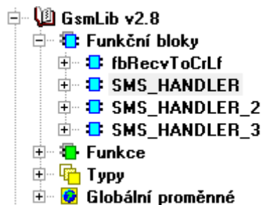
Obrázek 4: Funkční bloky knihovny GsmLib

Ze seznamu vybereme knihovnu. Nyní už máme k dispozici funkční blok SMS_Handler. Můžeme se podívat na jeho stavbu, když v knihovnách otevřeme GsmLib->funkční bloky.