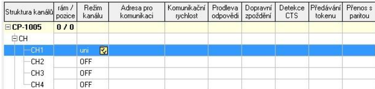
Obrázek 1: Konfigurace HW – nastavení parametrů kanálu

Pro využití GSM modemu musíme nejdříve nastavit sériový komunikační kanál. Otevřeme Manažer projektu->Hw->Konfigurace HW->Nastavení CPU a zde nastavíme kanál na uni .