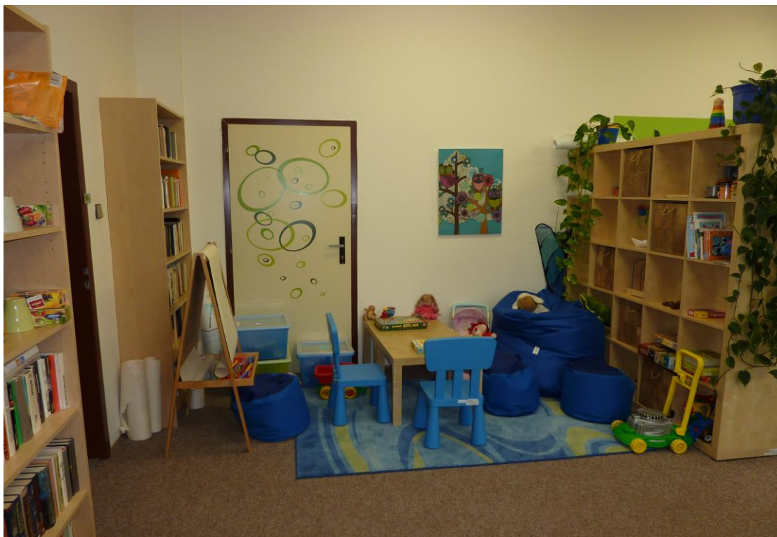
Obr. 3. Kancelář FOD – herna.