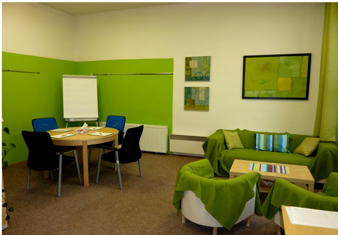
Obr. 2. Kancelář FOD – mediální místnost.

Mediátoři ve FOD Zábřeh se řídí Etickým kodexem mediátorů Asociace mediátorů ČR 190 (Příloha P 3) a Etickým kodexem FOD.