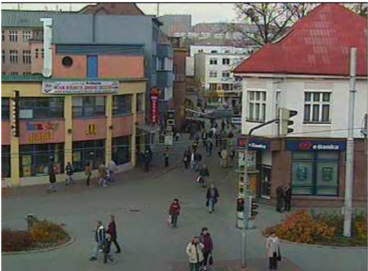
Obr. 1. Křižovatka třída T.Bati – ul. Školní

Křižovatka ul. Dlouhá x Zarámí x Kvítková, obchodní zóna, zastávka MHD, peněžní a pojišťovací body, centrum, návaznost na kamerový bod číslo 1, 2, 10 [8]