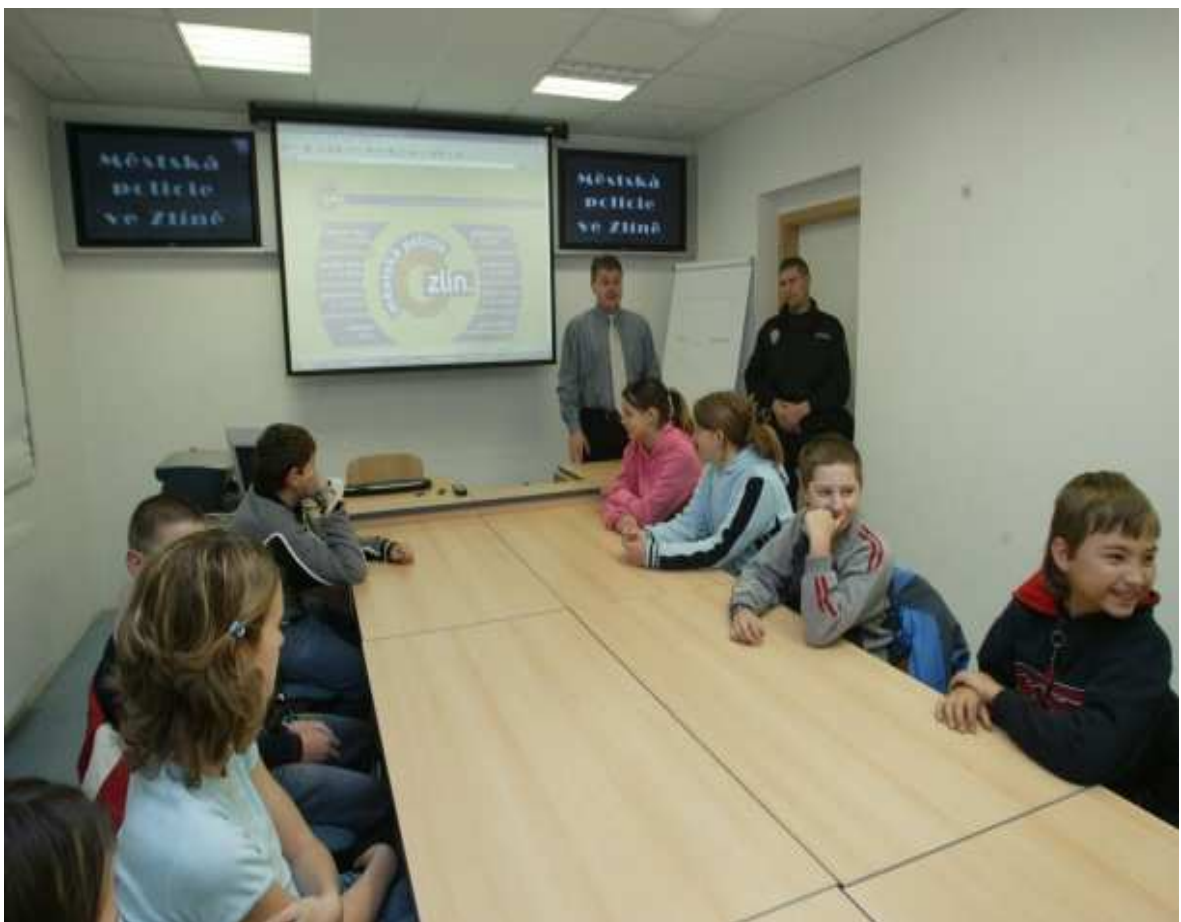
Obr. 2. Přednáška pro děti