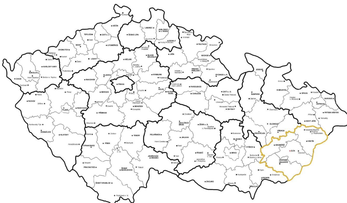
Obr. 1. Česká republika – Zlín a Zlínský kraj [18]

Zlín je statutární město kraje a nachází se v jihovýchodní části Moravy. Jedná se o soubor obydlých údolích s rozlohou 102,8 km 2 , jejichž středem protéká řeka Dřevnice, která se nedaleko napojuje na tok řeky Moravy. Geografická proměnnost oblasti je dána jeho lokací na rozmezí Vizovických a Hostýnských vrchů. Město samotné se skládá ze sedmdesáti základních sídelních jednotek a šestnácti částí o celkovém počtu obyvatel 75 122 k datu 1.1.2015. To ale také znamená že počet nezaměstnaných a tudíž osob se zvýšeným procentem pravděpodobnosti výkonu trestné činnosti je ve městě Zlínu 5 327.