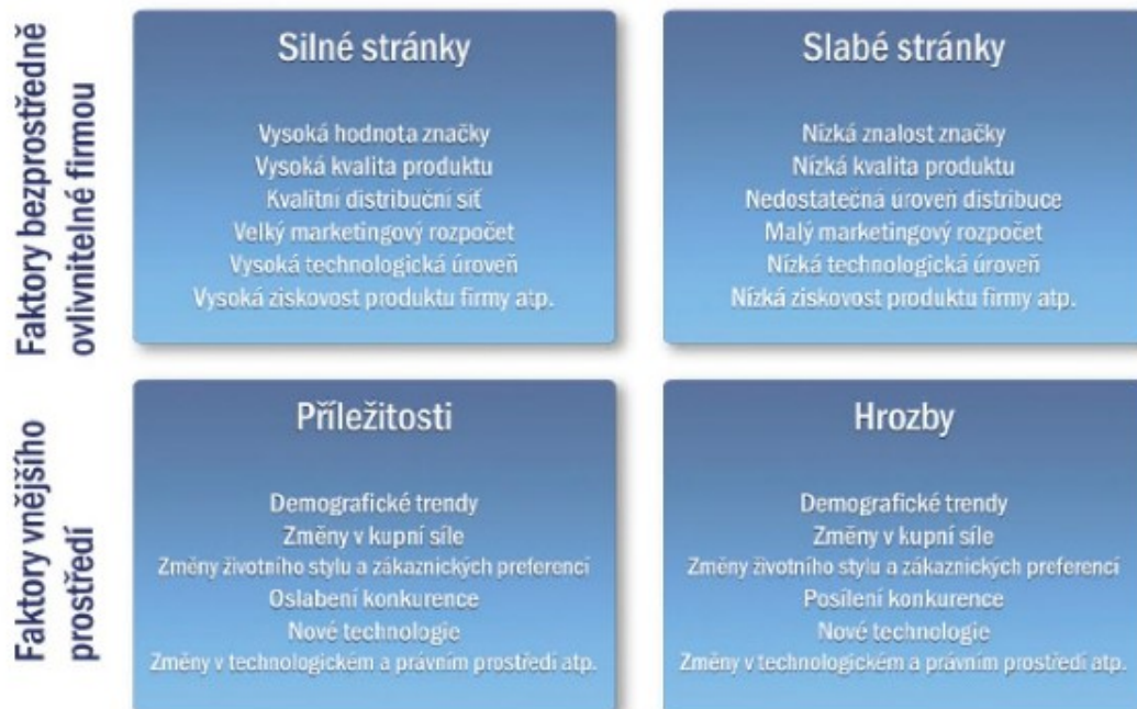
Obrázek 3: SWOT analýza (vybrané faktory)

SWOT analýza má ovšem i řadu problémů. Především dva problémy jsou zde naprosto zásadní. Prvním problémem podle Blažkové (2007, s. 159) je zařazení. Tím je myšleno, že při tvorbě SWOT analýzy je často problém určité faktory správně zařadit. Například silné stránky jsou uvedeny mezi příležitostmi a naopak. Druhým problémem podle Jakubíkové (2013, s. 131), který je možná ještě zásadnější, je subjektivita. Vedle problémů SWOT analýzy existuje ještě jev zvaný Strategická slepota. Jakubíková (2013, s. 130) strategickou slepotu charakterizuje jako neschopnost vidět příležitosti a hrozby na trhu. Podstata tohoto jevu spočívá v tom, že se firmy často uchylují k tradiční volbě marketingu a nestíhají se přizpůsobovat okolnímu vývoji, z čehož vyplývá, že pokud je okolní vývoj rychlejší než změny ve firmě, dostává se firma do ohrožení. Co se týče příležitostí, jedná se zejména o nedostatek zdrojů nebo jejich špatné rozložení.