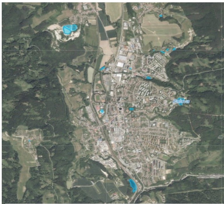
Vodní nádrže na území města Blanska (GIS mapy, 2021)