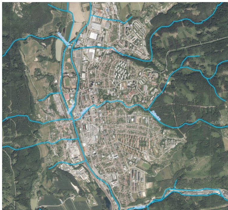
Vodní toky v Blansku