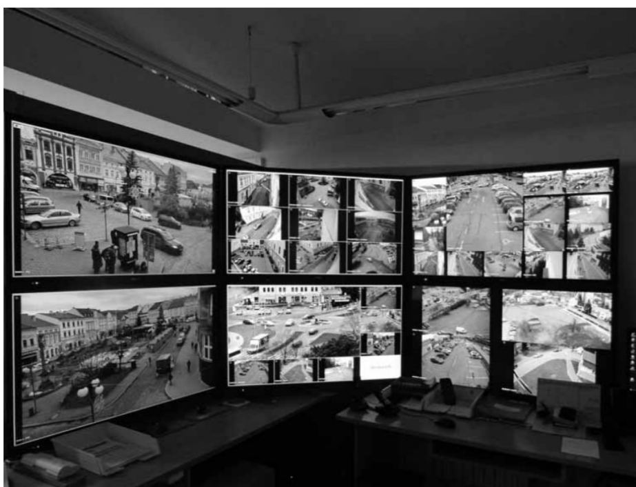
Obrázek 2 Městský kamerový dohlížecí systém ve Valašském Meziříčí

Neustálé sledování snímaných záběrů zabezpečuje stálá služba MP, která má oprávnění k monitoringu záběrů stacionárních kamer v on-line režimu a k prohlížení historie záznamů z těchto kamer MKDS.