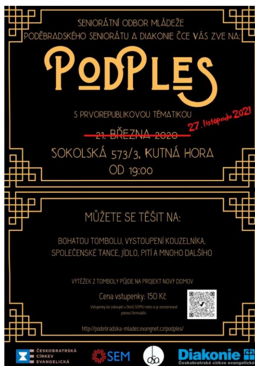
Obrázek 3 Plakát na ples

Důležitými prvky propagace je plakát, který shrne veškeré informace a mediální příspěvky na sociálních sítích. Plakát byl vytvořen již na původní datum plesu, proto byla jeho podoba jen mírně upravena přeškrtnutím původního data a viditelně aktualizováno na datum nové.