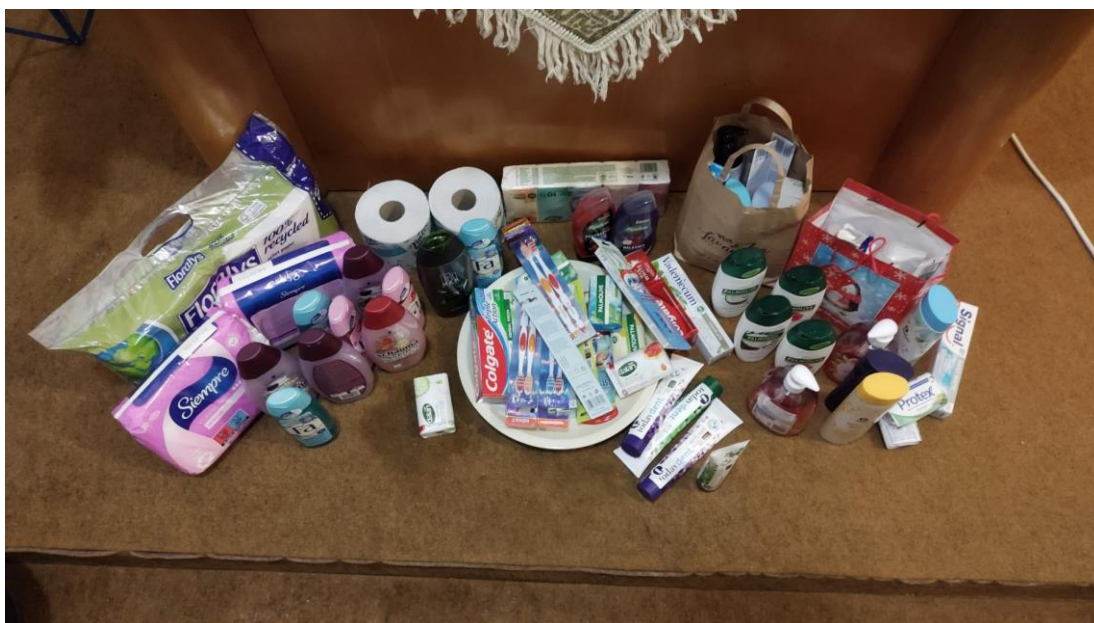
Obrázek 5 Vybrané hygienické potřeby