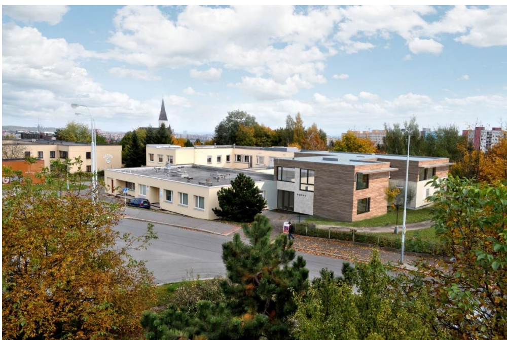
Obrázek 2 Vizualizace prostoru domova

Samotný domov vznikne jako dostavba stávající budovy v pražských Stodůlkách, kde se momentálně nachází Středisko Diakonie Praha. Plánem je, že centrum bude fungovat v nepřetržitém provozu každý den po celý rok 24 hodin denně. Kapacita je plánována pro 9 dospělých klientů s těžkou formou autismu, kteří potřebují neustálou a velmi intenzivní péči. Stavba začala v létě 2021 a její dokončení je plánováno na leden roku 2023.