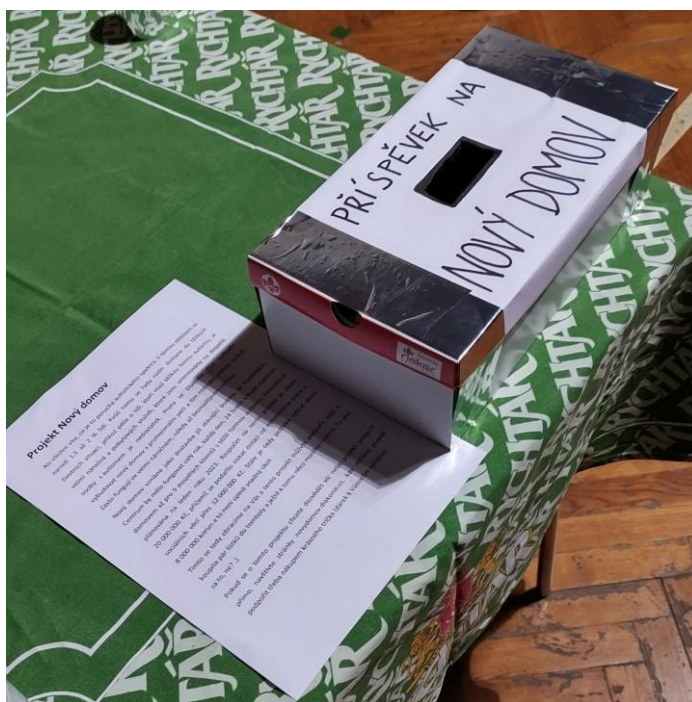
Obrázek 4 Kasička na baru