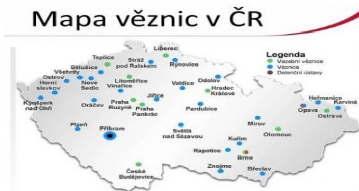
Obrázek 1 Mapa věznic v České republice

V obrázku níže je znázorněna mapa všech věznic v České republice: