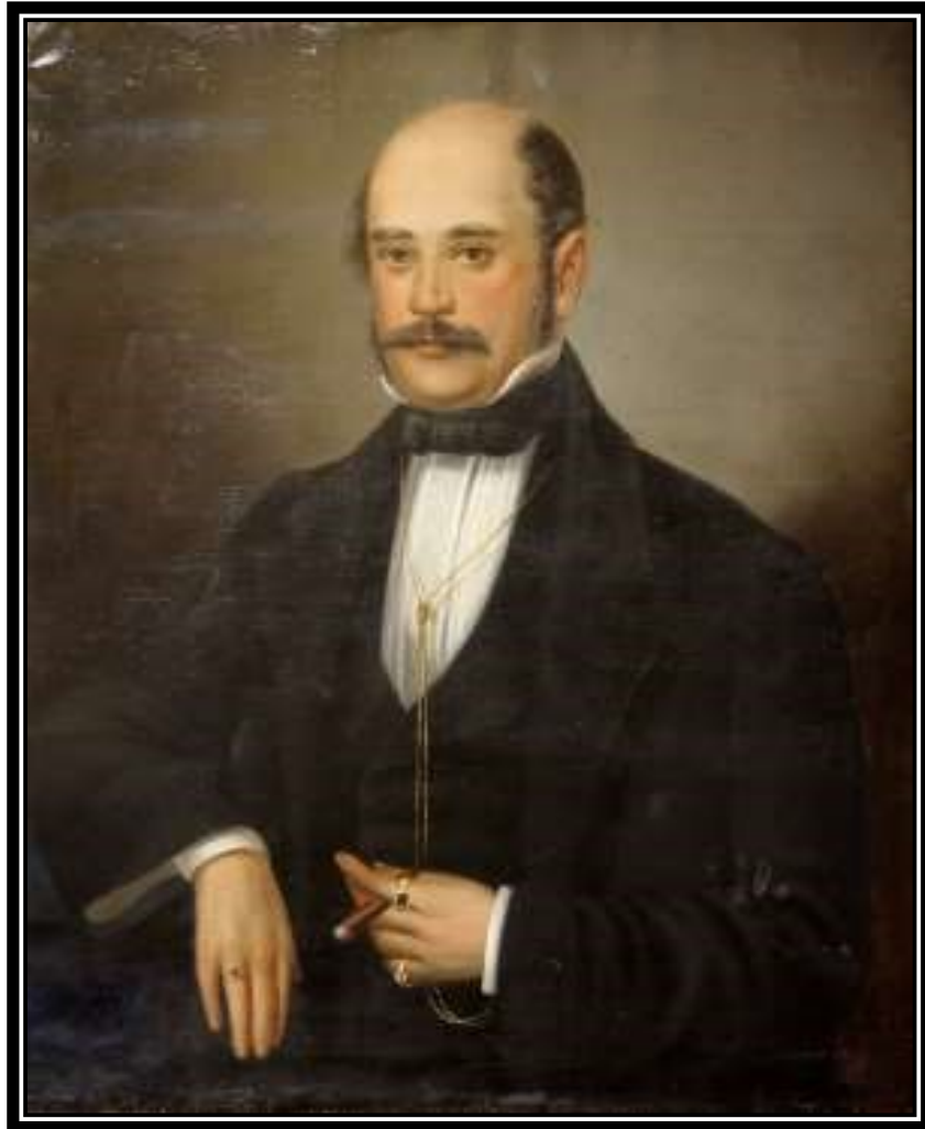
Obrázek 1 Ignác Filip Semmelweis

na prostředníčku pravé ruky, kterou si přivodil při operování novorozence. (Adriaanse, 2000)