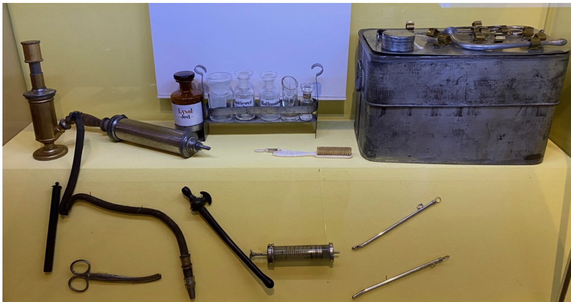
Příloha 1- autorka práce, 2023