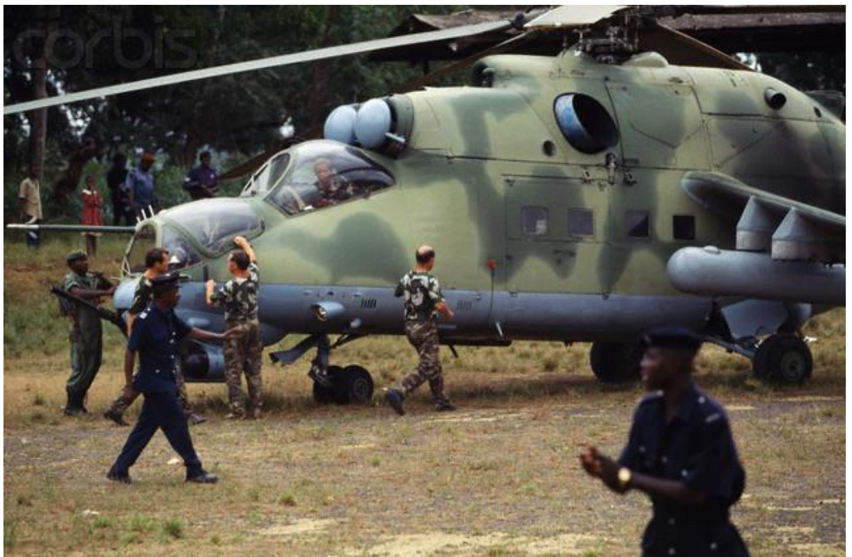
Obr. 3. Zaměstnanci SVS Executive Outcomes v okolí vrtulníku Mil Mi-24 [8]