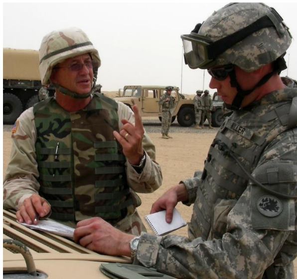
Obr. 7. Expert od MPRI radí americkému vojákovu při výcviku v Kuvajtu [29]

V průběhu tohoto konfliktu zahynuly tisíce lidí a stovky tisíc bylo nuceno opustit své domovy. Firmě MPRI nelze připsat účast na o ukončení tohoto konfliktu, lze ovšem potvrdit jejich pozitivní vliv na morálku a připravenost chorvatských vojsk, což nepřímo, i kdyby v minimálním rozsahu vedlo ke dřívějšímu ukončení tohoto konfliktu. Lze tedy říct, že jejich vliv na bezpečnost byl pozitivní, považujeme-li výsledek konfliktu z perspektivy Chorvatska. [27]