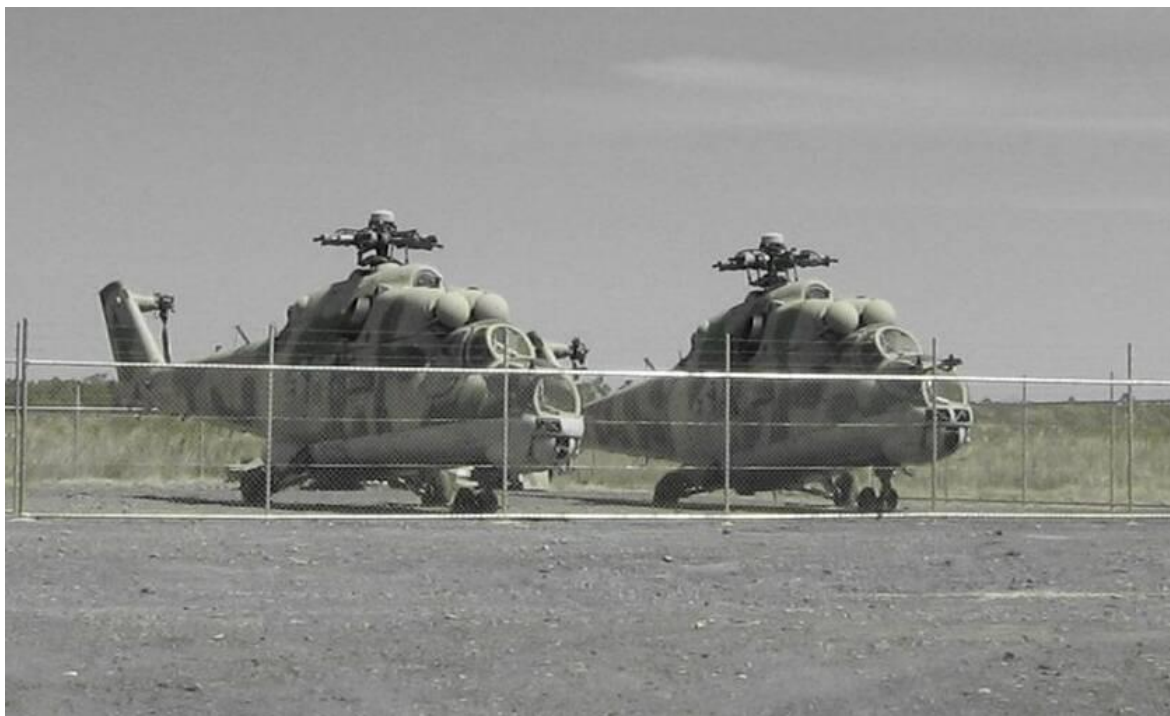
Obr. 9. Zabavené vrtulníky Sandline, skladované na australské základně [38]

Následná náprava novou vládou ovšem vedla k ukončení konfliktu mezi státními silami a BLA, což vedlo k ukončení dlouholeté občanské války a uzavření mírové dohody.