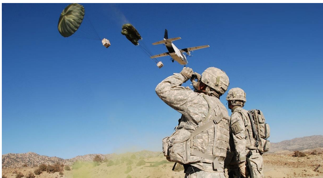
Obr. 8. Blackwater provádí zásobovací operace v Iráku [34]

Tento případ ukazuje efektivitu soukromých vojenských společností (SVS) při plnění konkrétních úkolů ve spolupráci s vojenskými jednotkami, ale zároveň také riziko špatného nastavení standardů a kontroly činnosti, zejména v tak nebezpečném prostředí, jakým byl Irák během okupace. Jsou-li následkem této špatné organizace zranění nebo úmrtí civilistů, tak jako tomu bylo v případě Blackwater, je potřeba velmi rázně zakročit a tyto nedostatky napravit, aby se podobná situace nemohla opakovat.