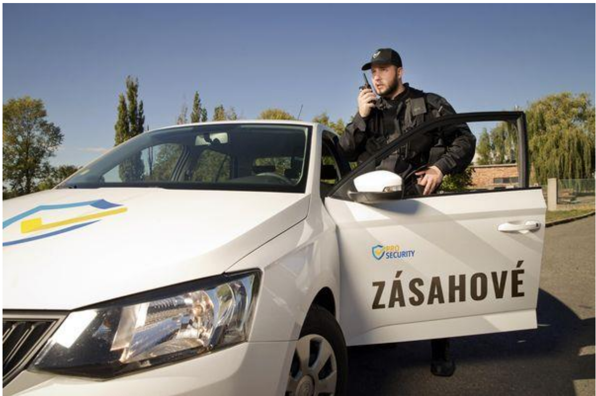
Obr. 2. Zaměstnanec bezpečnostní agentury u zásahového vozidla [7]