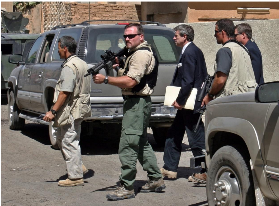
Obr. 1. Ozbrojený doprovod zprostředkovaný zaměstnanci SVS [6]

Soukromé vojenské společnosti se angažují v široké škále činností, které sahají od poskytování bezpečnostních služeb až po přímou účast v bojových operacích. Tyto aktivity odrážejí rostoucí roli, kterou SVS hrají v oblasti obrany a bezpečnosti na národní i mezinárodní úrovni. [2] [3] [5]