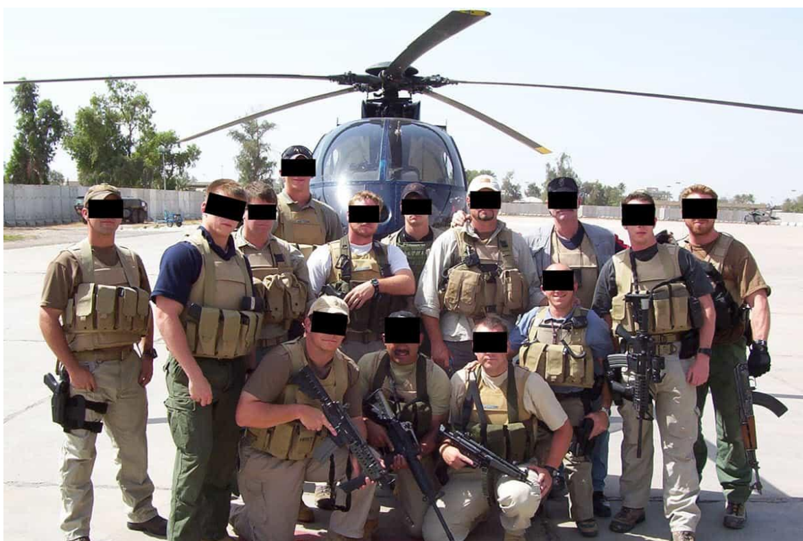
Obr. 5. Zaměstnanci SVS Blackwater [10]