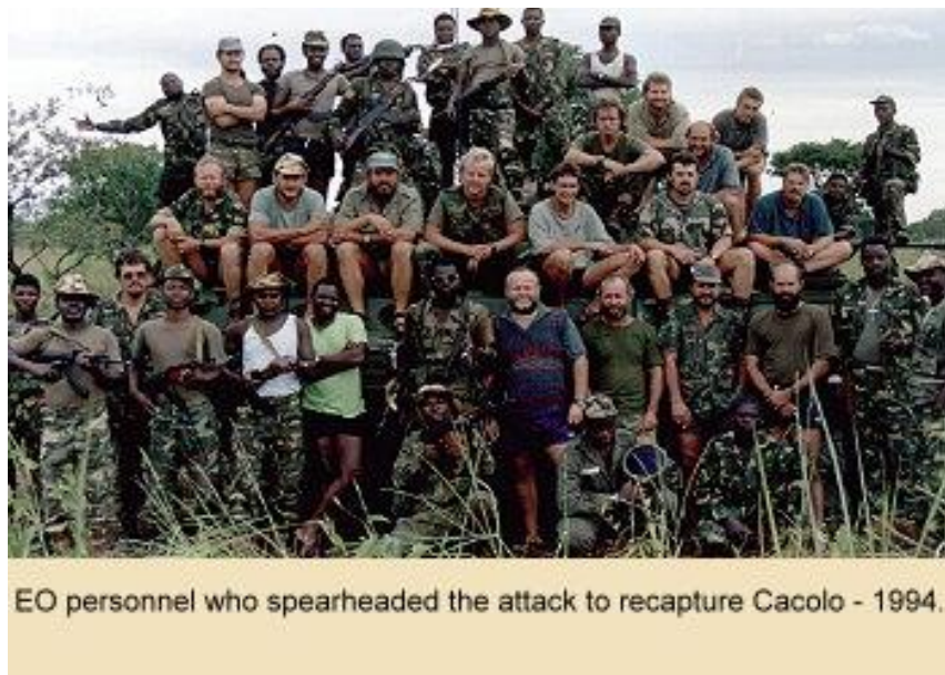
Obr. 6. „EO zaměstnanci, kteří vedli útok na osvobození města Cacolo – 1994.“