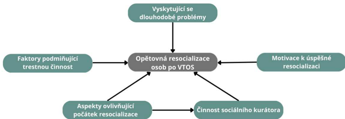
Obrázek 2 Konkrétní paradigmatický model (vlastní výzkum 2023-2024)