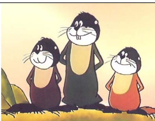
Tri svište - Bohumil Šejda