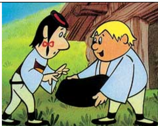
Pásli ovce valasi – Ladislav Čapek