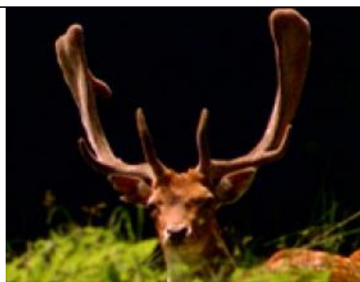
Čo rozprávala teta Srna - Jindro Vlach