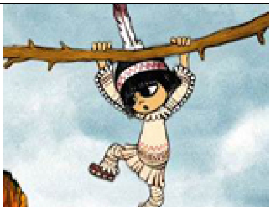
Indiánske rozprávky - Karel Zeman, Eugen Spálený