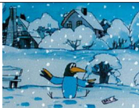
Vták Gabo - Bohumil Šejda