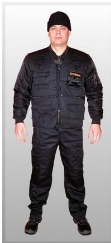
Obrázek 7 – Pánská zimní uniforma