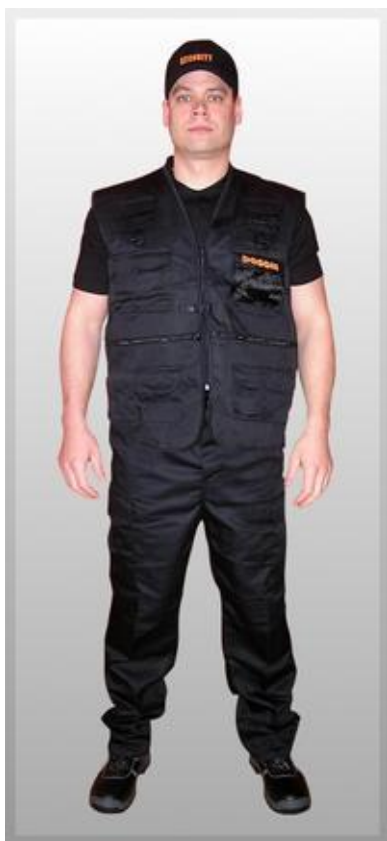
Obrázek 6 – Pánská letní uniforma

Do standardní výstroje patří uniforma letní, která se skládá z čepice, černého trička s límečkem, vesty, na kterém musí být umístěno logo firmy, černé kalhoty a obuv. A zimní uniformy, ke kterým se přidává zimní čepice a zimní bunda, samozřejmě s logem firmy.