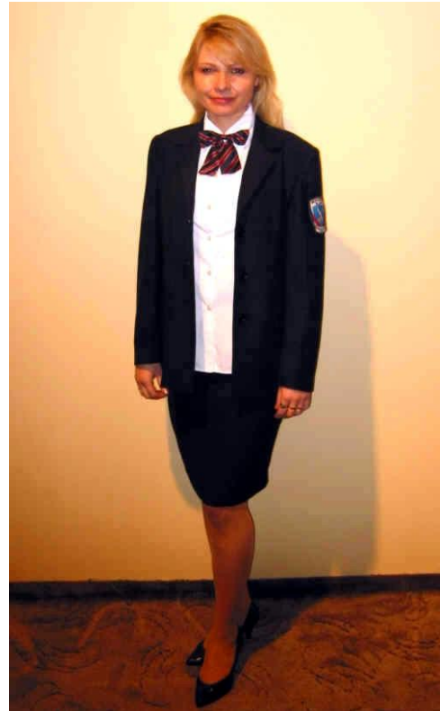
Obrázek 12 - Dámská společenská uniforma 1 Obrázek 13 - Dámská společenská uniforma 2