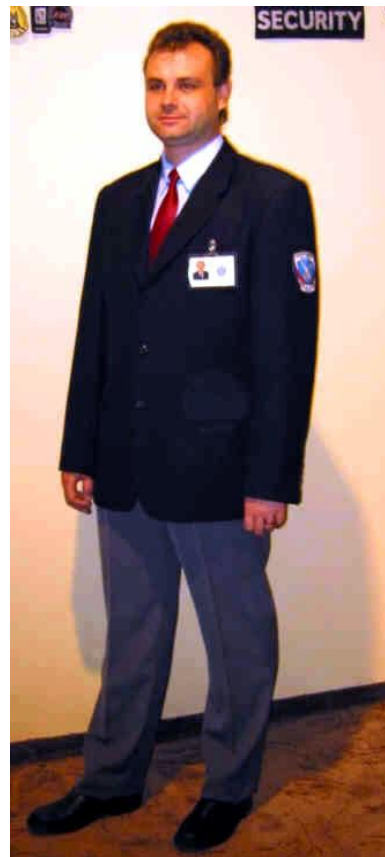
Obrázek 10 - Pánská společenská uniforma 1 Obrázek 11 - Pánská společenská uniforma 2

V dnešní době není žádnou výjimkou, když žena vykonává výhradně mužskou práci, platí to i pro obory bezpečnosti. Ženy často vykonávají funkce fyzické ostrahy. Proto i pro ně se musely navrhnout stejnokroje – standardní, ale také i společenské.