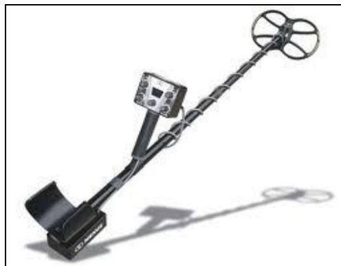
Obrázek 15 - Detektor kovů