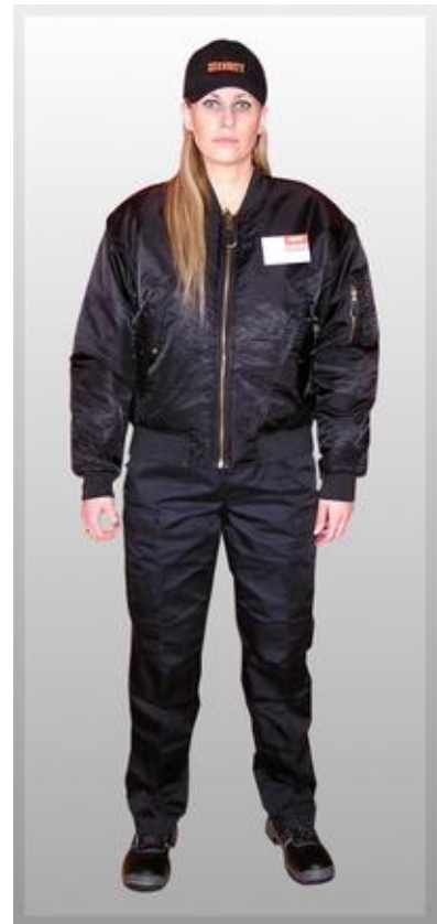
Obrázek 9 - Dámská zimní uniforma

Společenská uniforma se užívá v uzavřených prostorech, jako jsou např. obchodní domy, supermarkety, banky a podobné instituce.