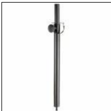
Obrázek 14 – Distanční tyč