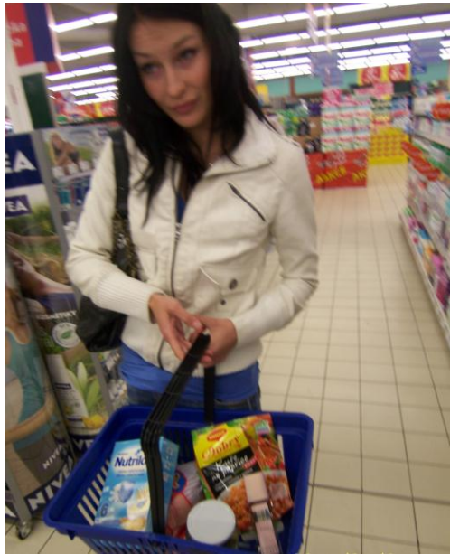
Obrázek 3 – Pachatel nesoucí si druhý parfém v košíku

Druhý parfém vkládá do nákupního košíku k ostatnímu nákupu, v domnění, že krádež, nikdo nezaregistroval.