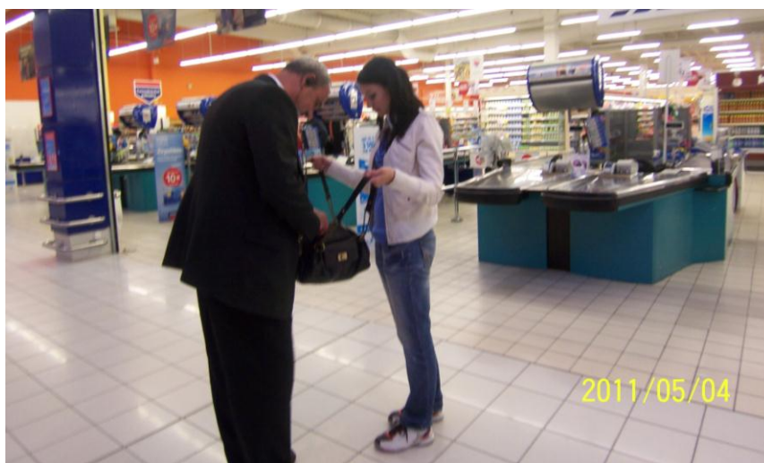
Obrázek 5 - Pachatel zadržen pracovníkem SBS

Při placení proběhlo vše standardním způsobem, pachatel uhradil celkovou požadovanou částku a přes bezpečnostní antény prošel bez jakéhokoli problému. Pracovník SBS byl svým kolegou již předem vysílačkou informován o úmyslu pachatele odejít s kradeným parfémem uloženým v kabelce. Na základě této informace byl pachatel požádán o předložení obsahu kabelky.