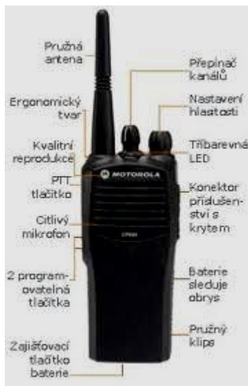
Obrázek 16 – Radiostanice

Při vícečlenné ostraze, příkladem jsou právě obchodní domy, je potřeba užívání radiostanic. Jsou nedílnou součástí každého pracovníka SBS ve větších objektech. Radiostanice je rychlým prostředkem předávání informací mezi pracovníky SBS. Zlepšuje organizaci výkonu služby nebo řešení mimořádných událostí.