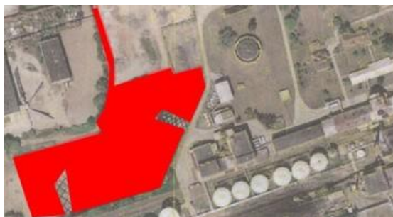
Obrázek č. 1: Komerční pozemek č. 91541, zdroj: RS Zvonek Kroměříž, 2012