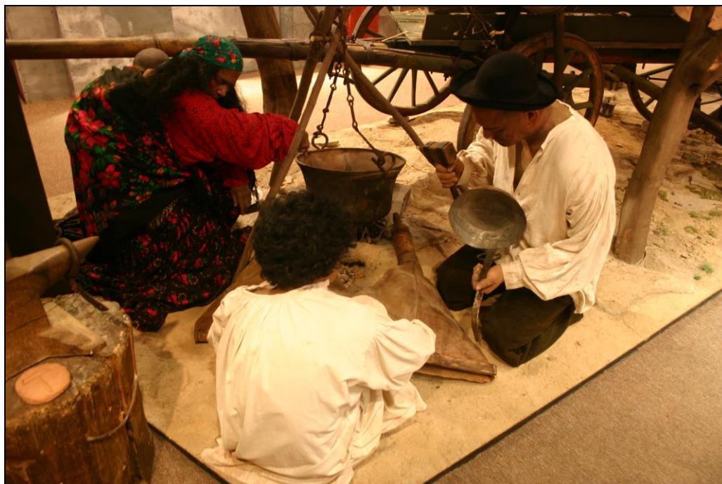
Tradiční romský kočovný život

Muzeum romské kultury v Brně (zdroj: vlastní archiv)