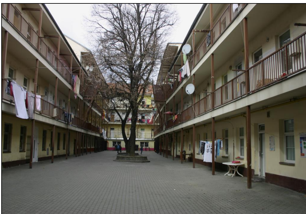
Nádvoří romského střediska DROM