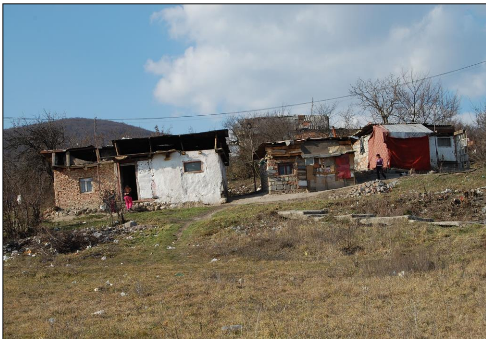
Romské obydlí na Slovensku