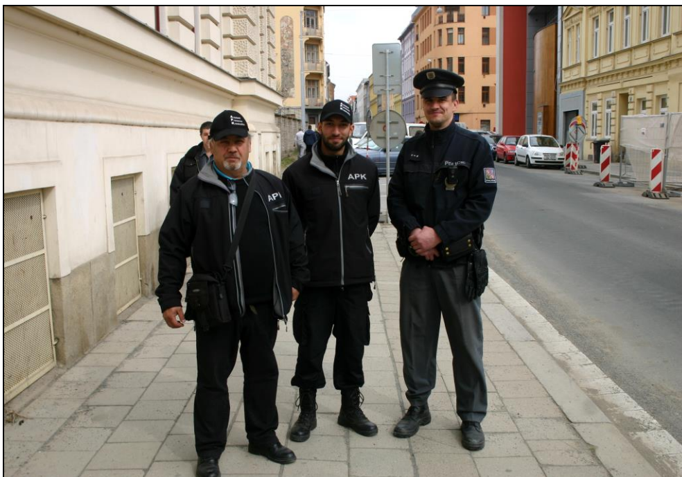
Asistenti prevence kriminality v Brně s PČR