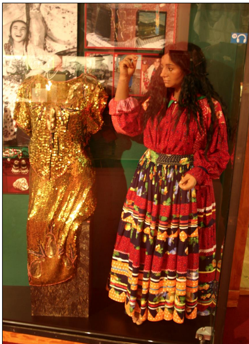
Typický oděv tradiční romské ženy