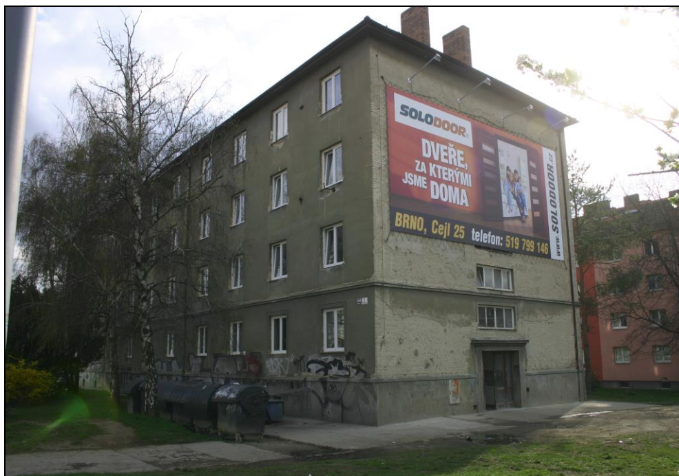
Nejznámější ubytovna na ul. Markéty Kuncové v Brně (převážně romská)