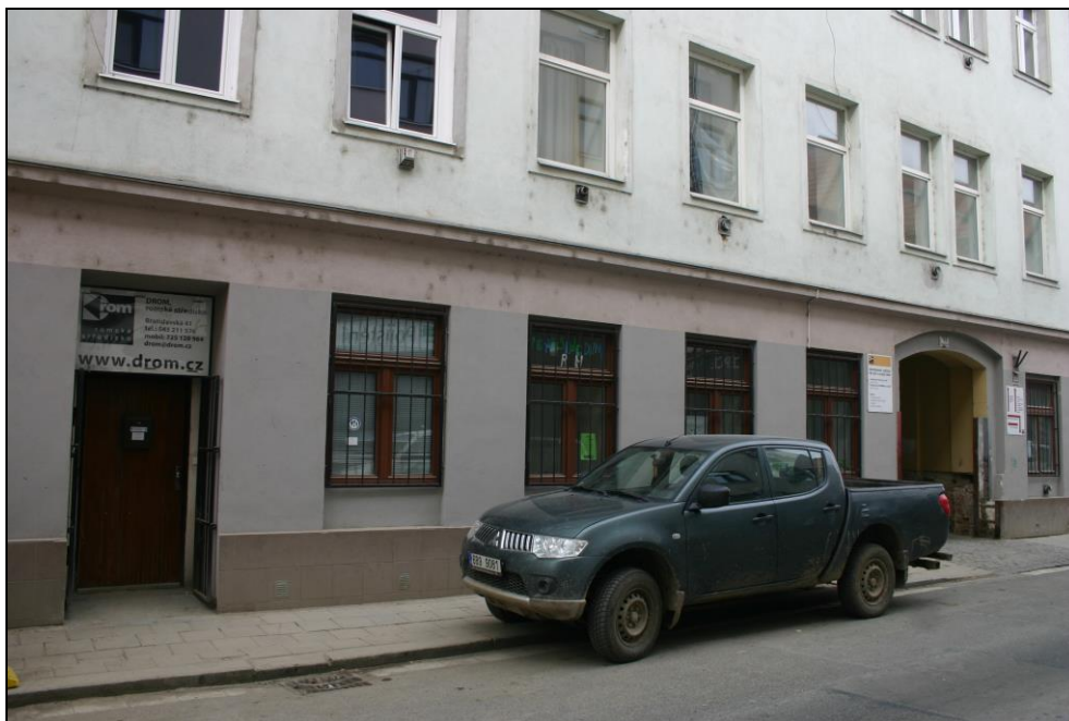
DROM, romské středisko, ul. Bratislavská 41, Brno