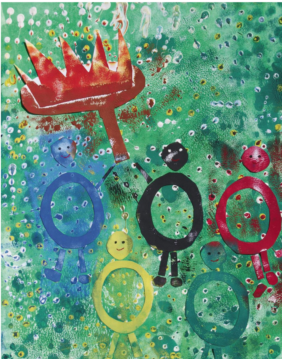
Obrázek č.1 Olympijské kruhy

vánočních a velikonočních trzích. Mezi činnosti, které jsou zaměřeny na sportovní vyžití, pořádané stacionářem během roku, patří mimo jiné i olympiády v letních měsících, konané pro klienty v prostorách zahrady stacionáře. Obrázek č.1 je vytvořen klienty stacionáře a znázorňuje olympijské kruhy. Jedná se o pozvánku na Olympijskou zahradní slavnost, která se konala na zahradě stacionáře.