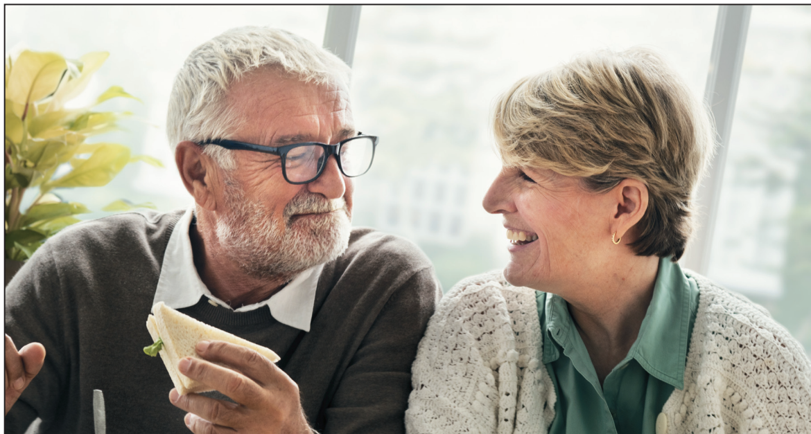
Obr. 3: Pozdní dospělost

Ke konci tohoto období se už většina lidí připravuje na odchod do důchodu. A záleží opět na každém jednotlivci jak tuto událost zvládne. Část populace, řekla bych že spíše ženy, se do důchodu těší, protože očekávají, že budou mít více času na své koníčky nebo roli babičky.