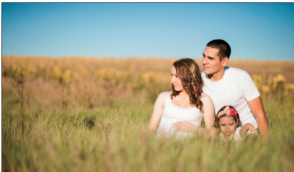
Obr. 5: Rodina

M2 Vyhrát ve sportce, mít dílnu na výrobu kytar, dům. práci pro zabezpečení rodiny.