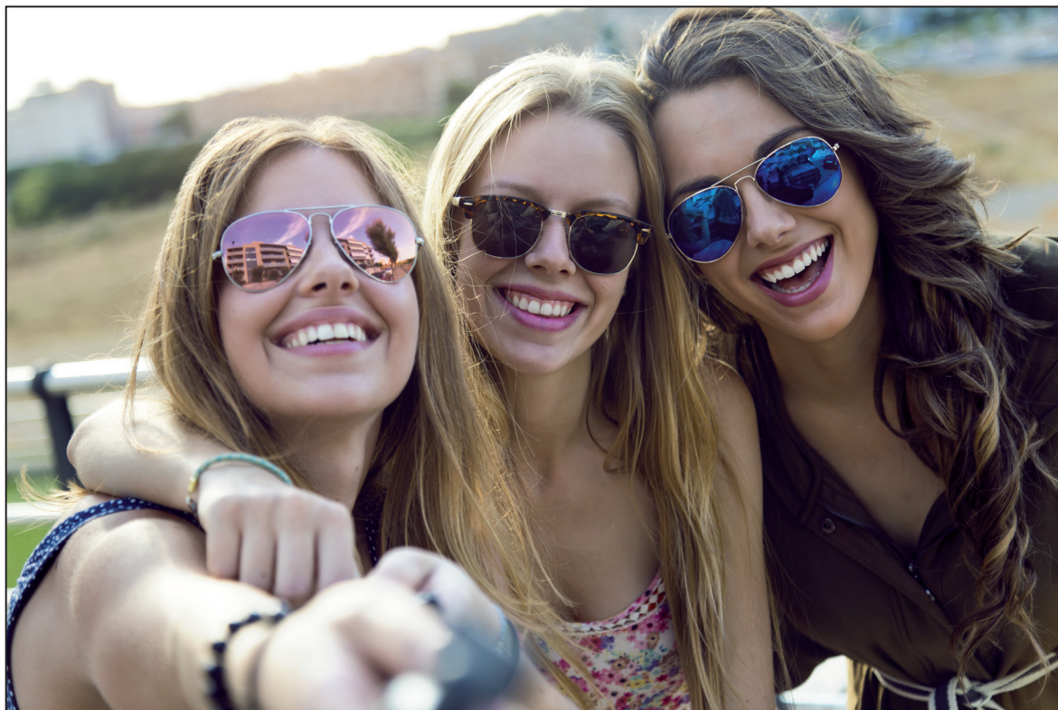
Obr. 1: Adolescence

O potřebách svých rodičů mnozí adolescenti neuvažují, nepřipadá jim to důležité. Zabývají se pouze sami sebou 28 Proto vznikají neshody mezi rodiči a dětmi. Rodiče mají tendenci posuzovat mladé z pohledu svých zkušeností, a proto bývají kritičtí. Vytváří se stereotyp generalizovaného hodnocení adolescentů , kdy se dospělím jeví mladí jako líní, neukáznění, nezodpovědní, bezstarostní, sobečtí, myslící jen na svoje uspokojení. 29