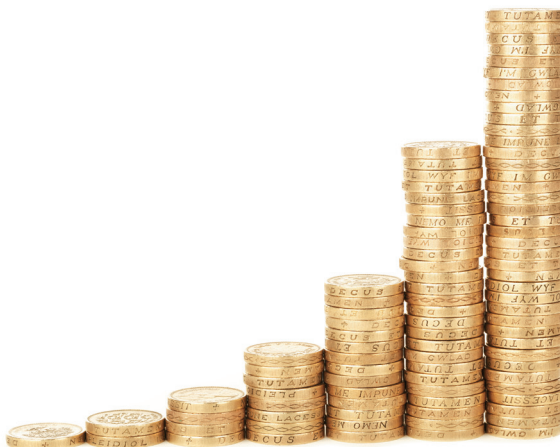
Obr. 6: Výhra