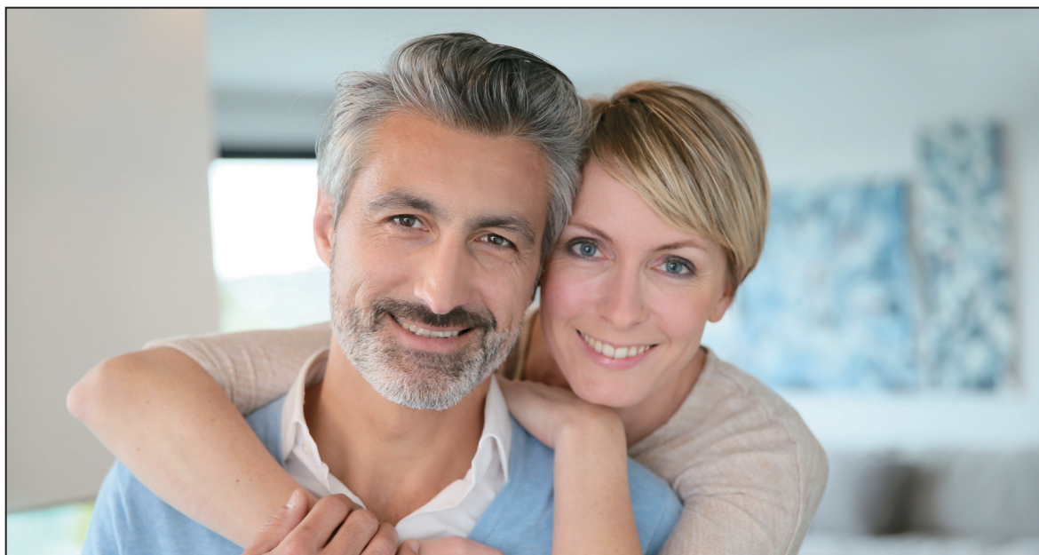
Obr. 2: Střední dospělost

Vzhledem k tématu mé bakalářské práce mě zaujal názor prof. Vágnerové, že plány dospívajících jsou zaměřeny na cíle, kterých chtějí dosáhnout v budoucnosti, kdežto jejich rodiče už nemohou své plány odkládat. „ Už nemohou používat obrany odkladem uspokojení do budoucnosti. “ 34