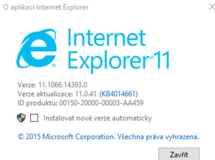
Obrázek 2: Vypnutí aktualizací v prohlížeči IE

V prohlížeči Internet Explorer je možné vypnout aktualizace přímo z prohlížeče. A to v nastavení po kliknutí na položku "O aplikaci Internet Explorer".