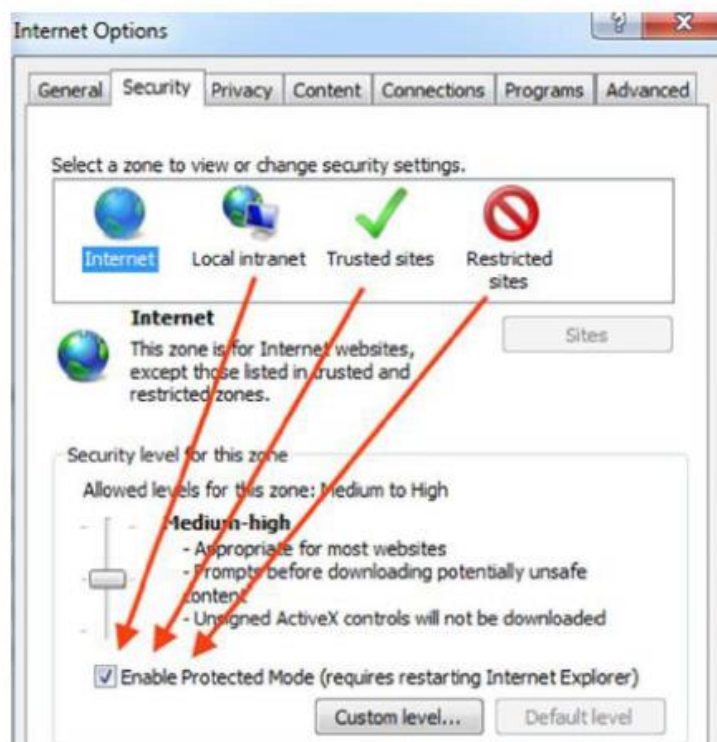
Obrázek 3: Nastavení Security v IE

V případě použití tohoto prohlížeče musí být nastaven parametr Protected Mode v nastavení prohlížeče na stejnou hodnotu pro všechny zóny.