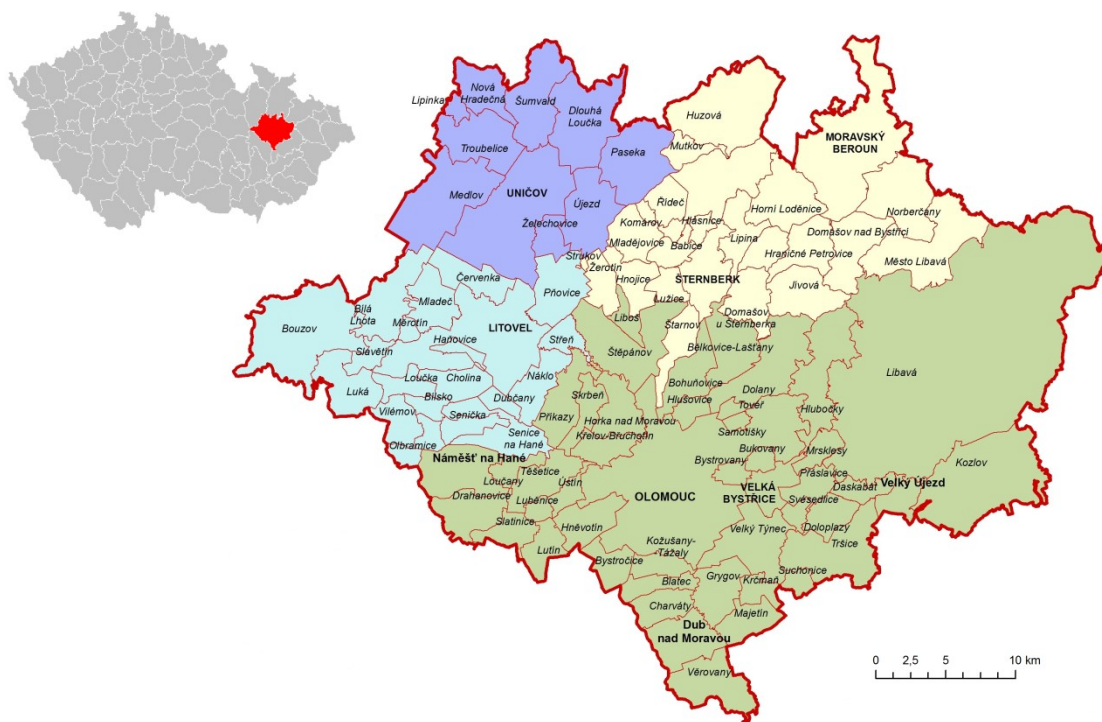
Obr. 1 Správní členění na území okresu Olomouc k 1. 1. 2018

Až do třicetileté války pak byla Olomouc hlavním správním centrem na Moravě, a z toho důvodu zde nalezneme i velké množství profánních (světských) památek, např. měšťanské domy, kašny či paláce. Historické jádro Olomouce je pak prohlášeno za městskou památkovou rezervaci, která zajišťuje vysoký stupeň ochrany. Nižší stupeň ochrany, tedy městská památková zóna, je pak vyhlášena i v městech Litovel, Šternberk a Uničov.