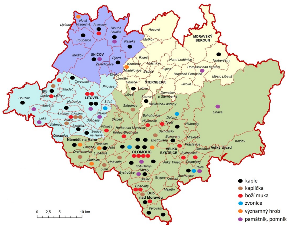
Obr. 4 Vybrané drobné sakrální památky na území okresu Olomouc k 1. 1. 2018

Na území okresu Olomouc se k 1. únoru 2018 nacházelo téměř 250 objektů či areálů, které spadají do kategorie drobná sakrální památka a jsou evidovány v památkovém katalogu NPÚ. Největší kategorii tvořily kříže, sochy a sousoší. Některý z těchto objektů bychom našli téměř v každé obci či městě tohoto okresu. Mezi další objekty, které jsou zastoupeny ve výraznějším počtu, patří kaple, kapličky, boží muky, památníky, zvonice či významné hroby. Na Obr. 4 jsou znázorněny drobné sakrální památky, které jsou turisticky nejvíce vyhledávané. Z Obr. 4 je také patrné, že největší koncentrace drobných sakrálních památek s nadregionálním či turistickým významem se nachází v ORP Olomouc, nejmenší pak v oblasti bývalých Sudet, tedy ORP Šternberk. Celkový přehled všech drobných sakrálních památek na území okresu Olomouc je dostupný v příloze č. 3.