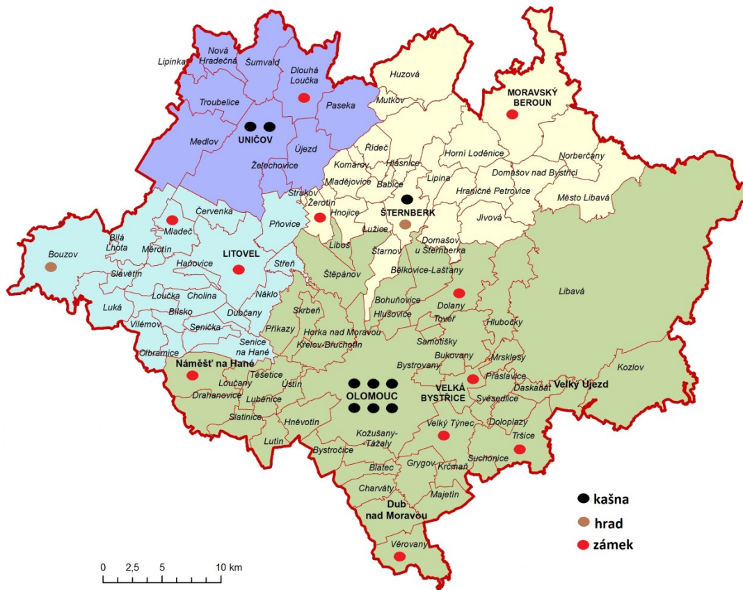
Obr. 2 Vybrané profánní památky na území okresu Olomouc k 1. 1. 2018