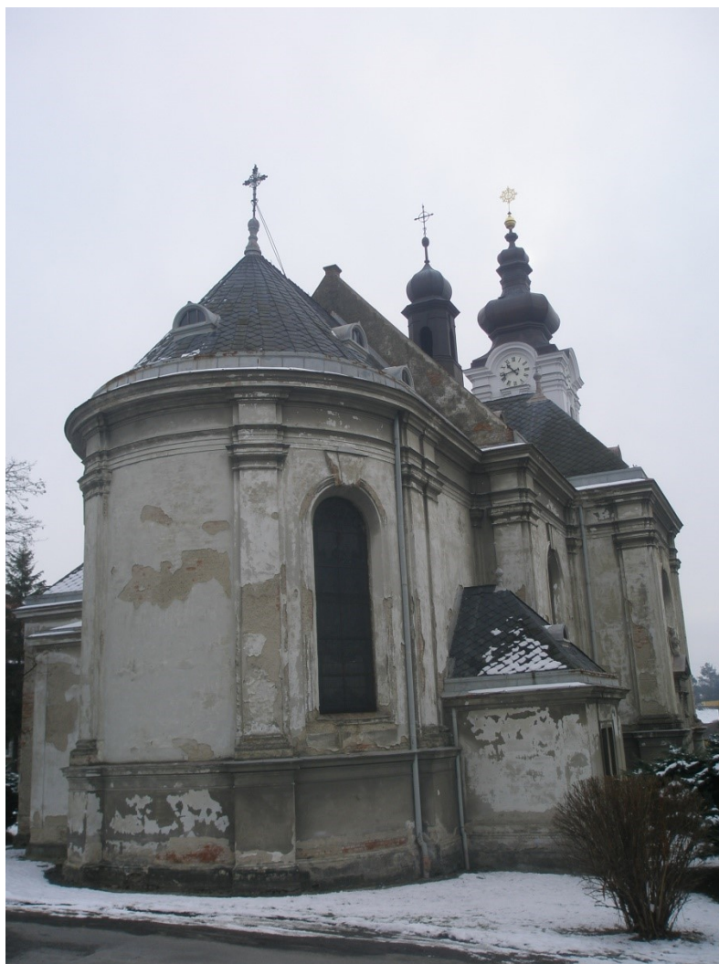
Obr. 5 Kostel Narození Panny Marie v Tršicích

Kostel Narození Panny Marie v Tršicích se nachází uprostřed obce, a díky své architektonické struktuře je dominantou obce Tršice. Kostel je 45 metrů dlouhý, obdélníkového půdorysu s půlkruhově ukončeným kněžištěm (O farnosti, © 2014). Fasády jsou prolomeny půlkruhově zaklenutými kruhovými okny s profilovanými šambránami. V průčelí kostela stojí hranolová věž ukončená cibulovou bání, ve vrcholu s makovicí a křížkem (Kostel Narození Panny Marie, © 2014). Ke kostelu také přilehá sakristie. Při dostavbě kostela byl roku 1906 na 45 metrů vysoké věži umístěn pozlacený kříž. V roce 1923 bylo zavedeno do chrámu elektrické vedení a roku 1934 elektrifikovány i varhany. Do současné chvíle proběhlo na kostele mnoho rekonstrukcí, např. v letech 1971-1973, 1979-1985, 2009-2012. Právě poslední rekonstrukce v letech 2009-2012 se týkala celkové opravy hlavní věže kostela, při které byla provedena i částečná obnova fasády kostela.