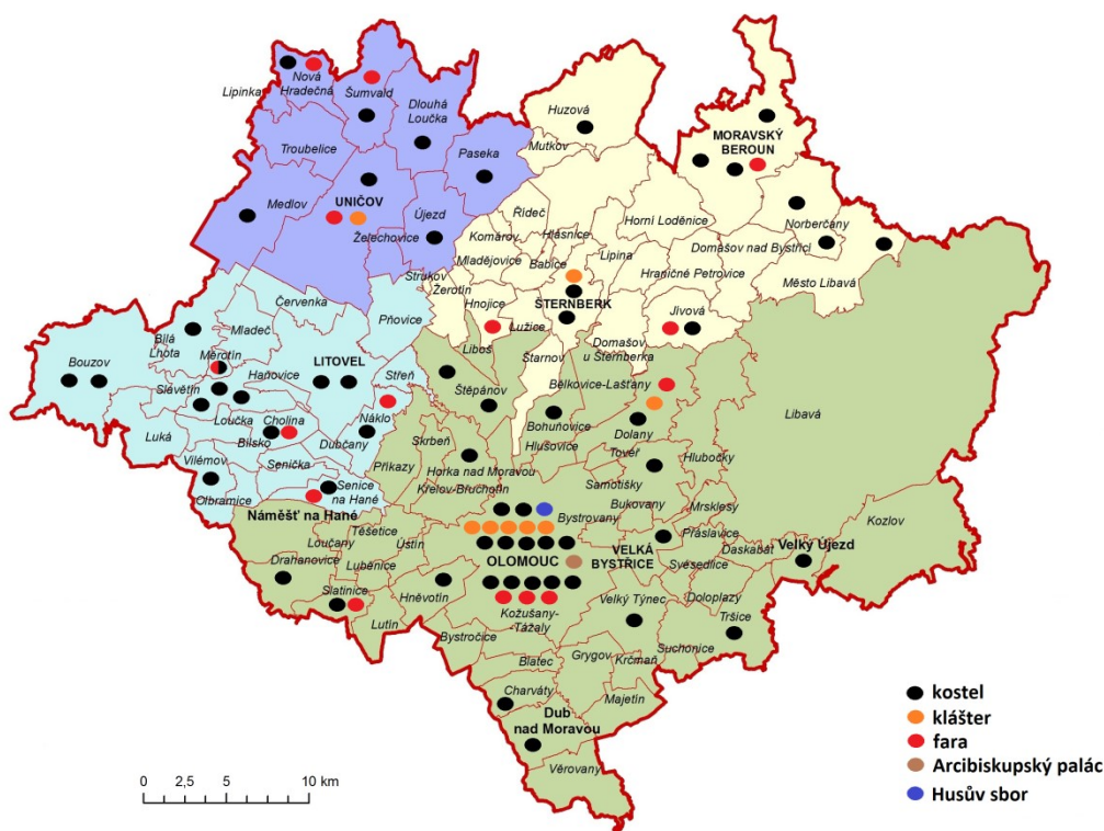
Obr. 3 Sakrální památky na území okresu Olomouc k 1. 1. 2018

Další výraznou kategorií tvoří fary, církevní budovy či kanovnické domy. Památkově chráněných far je celkem 15, a jsou poměrně rovnoměrně rozmístěny do všech správních obvodů. Naproti tomu kanovnické domy nalezneme pouze v Olomouci, a to celkem 13. Kromě toho nalezneme v Olomouci i Arcibiskupský palác nebo Husův sbor. Tyto budovy využívají hlavně představitelé církve a jejich administrativa. Poslední výraznou položkou v tomto seznamu jsou kláštery. Je jich celkem 8, přičemž 5 z nich se nachází v Olomouci, po jednom ve Šternberku a Uničově. V obci Dolany se pak nachází archeologické pozůstatky kartouzského kláštera Vallis Josaphat. Rozložení sakrálních staveb nám pak znázorňuje Obr. 3. Zde jsou znázorněny všechny sakrální památky kromě kanovnických domů.