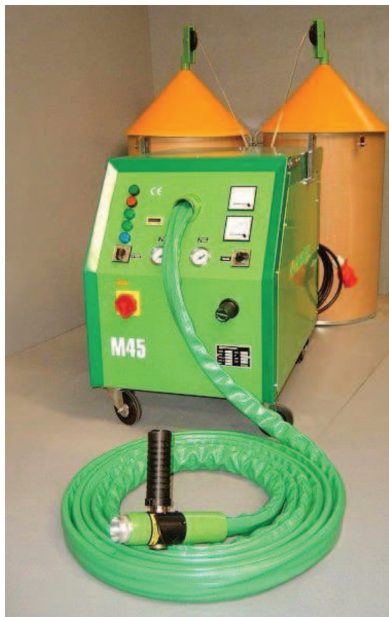
Obrázek 2. Stroj MARGARIDO M45

Účetními záležitostmi bude pověřena externí společnost, která bude zpracovávat jednotlivé účetní operace. Pro jednotlivé operace bude i nadále společnost využívat běžný účet u MONETA Money Bank, a.s. Společnost bude plátcem DPH.