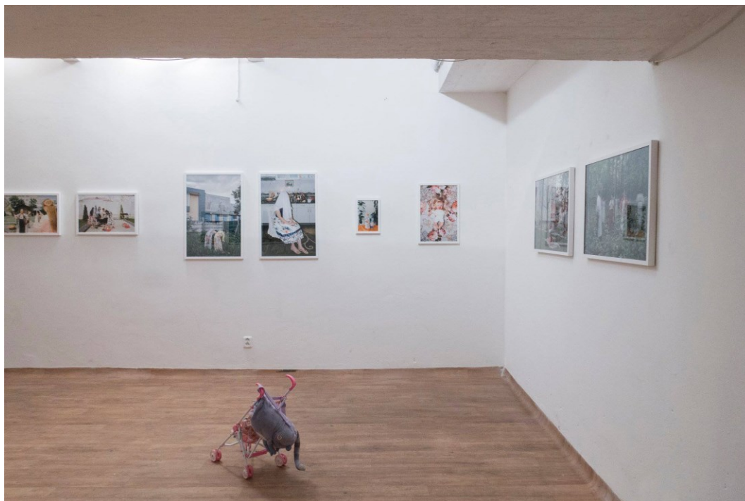
15. Photogether, Výstava Lucie Sekerkové, 2018