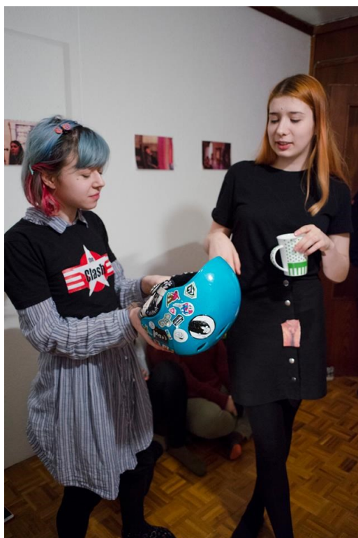
18. Díky moc XI., Losování, 2018