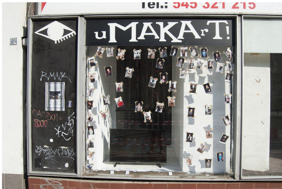
10. Umakart, Výstava Andrease Gajdošíka – Závěry policejního vyšetřování, 2018

Kurátoři nezávislých studentských galerií zpravidla nijak neovlivňují výslednou podobu instalace a nechávají vybraným umělcům volné ruce. Z části je to dáno prostorovými dispozicemi, které neumožňují realizovat větší kurátorské vize a skupinové výstavy, z části jde o cílenou eliminaci kurátorského aspektu. 81 Kurátoři se zaměřují především na sestavení programu, komunikaci s umělci a veřejností, propagaci, instalaci a technickou podporu. Případně zajišťují umělcům zpětnou vazbu a konzultaci. Jde hlavně o iniciační hybnou sílu vystavující autory a diváky novým situacím, podněcující k vzájemné reflexi. Primárně vyžadovanými schopnostmi osoby kurátora jsou ty produkční a komunikační. Samozřejmě nelze opomenout, že působí jako reprezentanti vkusu a trendů, kteří spíše než nadhledem oplývají vhladem a angažovaností na lokální a regionální umělecké scéně.