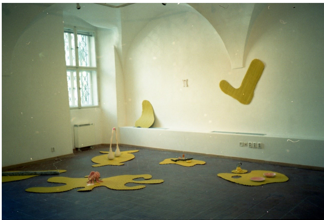
13. Galrie AMU, Výstava Ekonomie sluchu , 2019