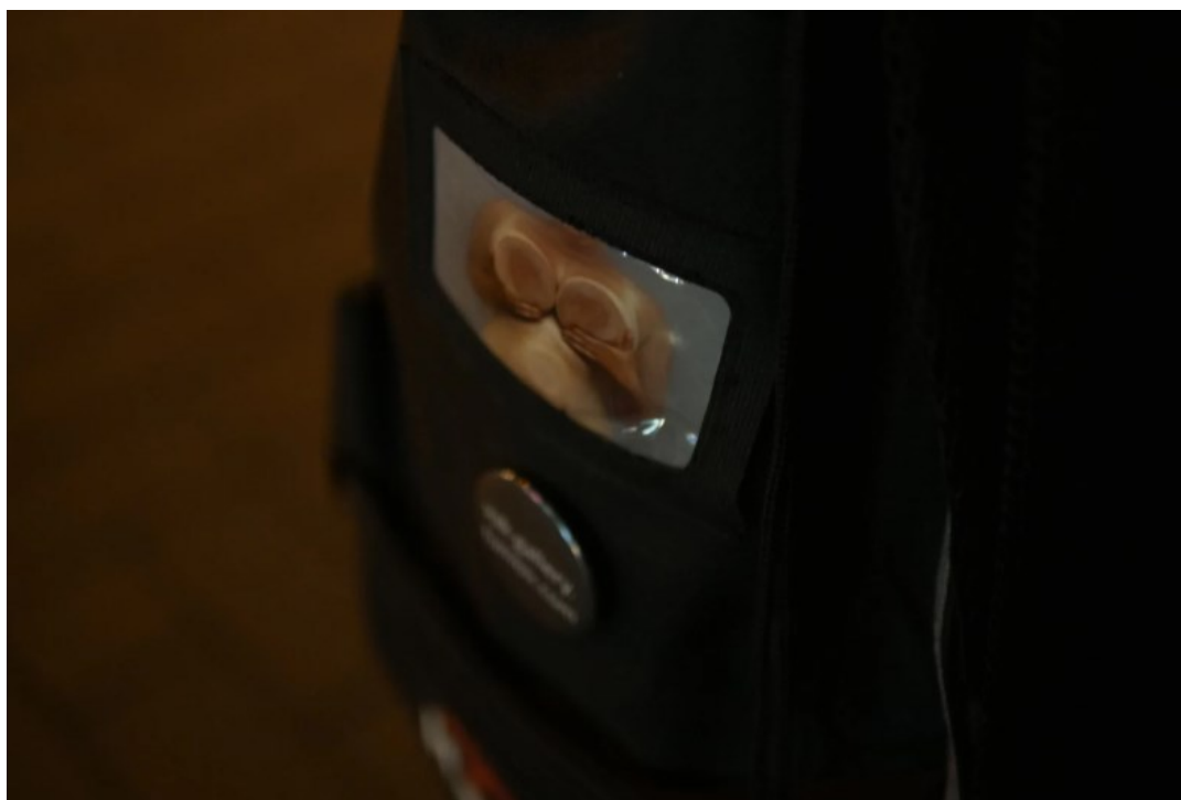
4. VAK: Kača Olivová, ANETKA JE SEXY , 2018