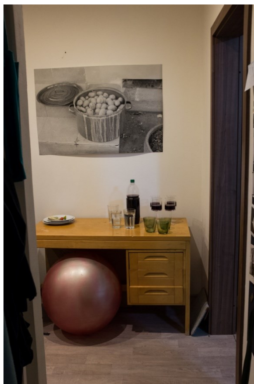
19. Díky moc I, Matěj Skalický, 2016