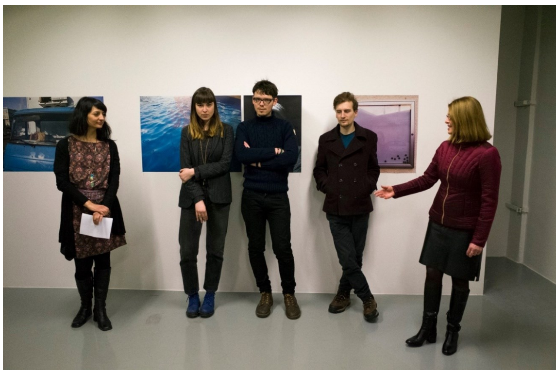
22. Kabinet T, Ylín, 2017