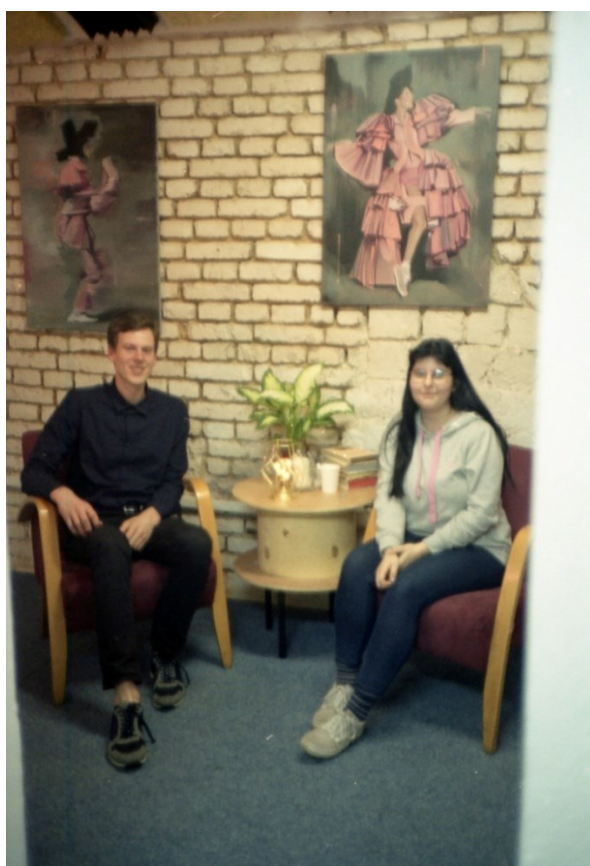
6. Artrafika, Iniciátoři galerie, 2019