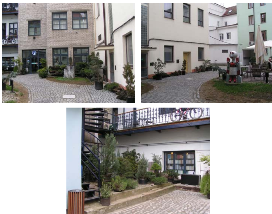
Obr: 31, 32, 33. Plochy s porostem