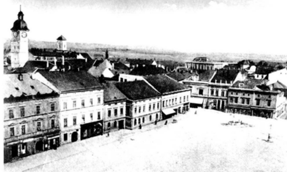
Obr: 7, 8. Masarykovo náměstí (8)