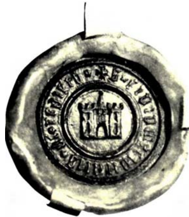
Obr: 2. Městská pečeť z roku 1312 (2)