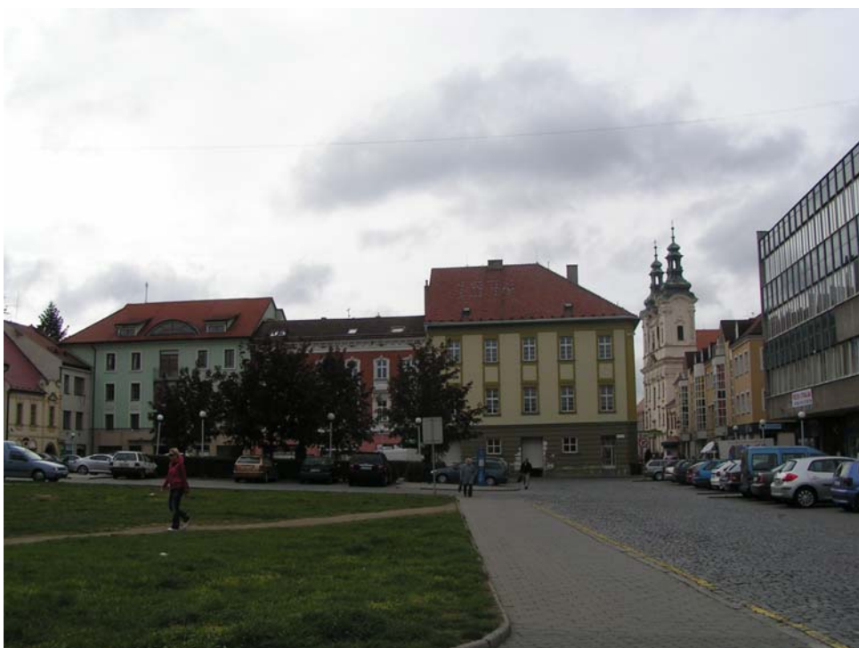
Obr: 14. Zelný trh, spojnice mezi dvěma náměstími