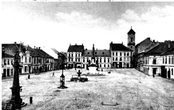
Obr: 9, 10. Mariánské náměstí (8)