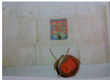
Obr:3. Tzv. znaková listina z 28. 6 1481 (x)