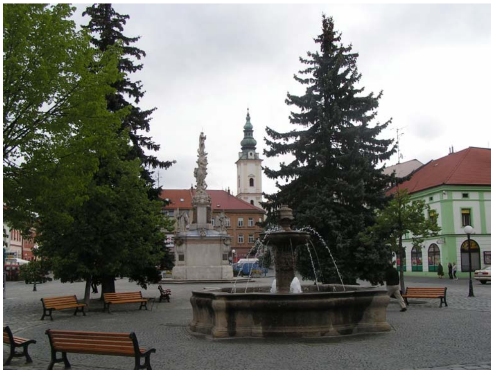
Obr: 15. Mariánské náměstí s morovým sloupem a barokní kašnou