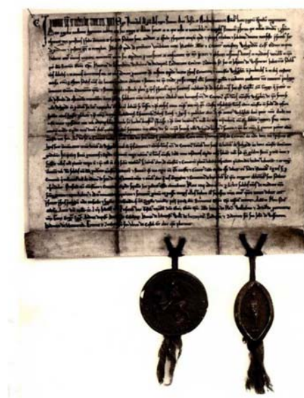
Obr: 1. Tzv. základní listina vydaná 15. 10. 1257 (x)

Druhá z 23. května 1258 v Hradišti nazývaném tehdy Nový Velehrad navazuje na první a dává nově založenému městu určitější právní podklad. Na základě těchto listin víme, že město vzniklo z vůle krále, ale pouze se souhlasem velehradského kláštera jakožto vlastníka pozemku. Toto založení si vyžádalo bezpečnostní opatření Moravy, jež trpěla nájezdy Uhrů. Kromě obranného důvodu vedly k založení i důvody hospodářské ovlivněné dobrou geografickou polohou.