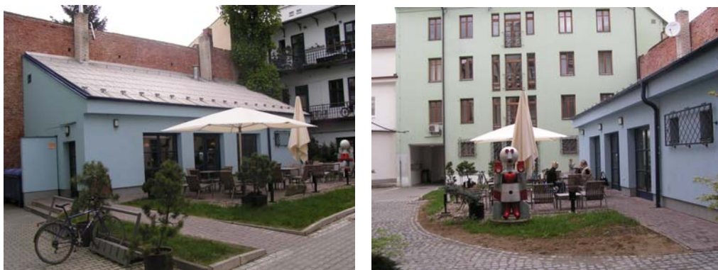
Obr: 34, 35. Kavárenský prostor