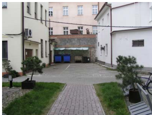
Obr: 36. Popelnice a parkovací místa