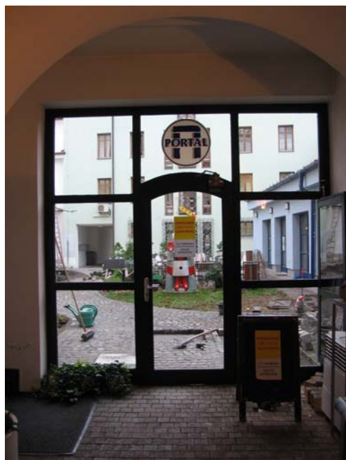
Obr: 20. Pohled z pasáže do atria