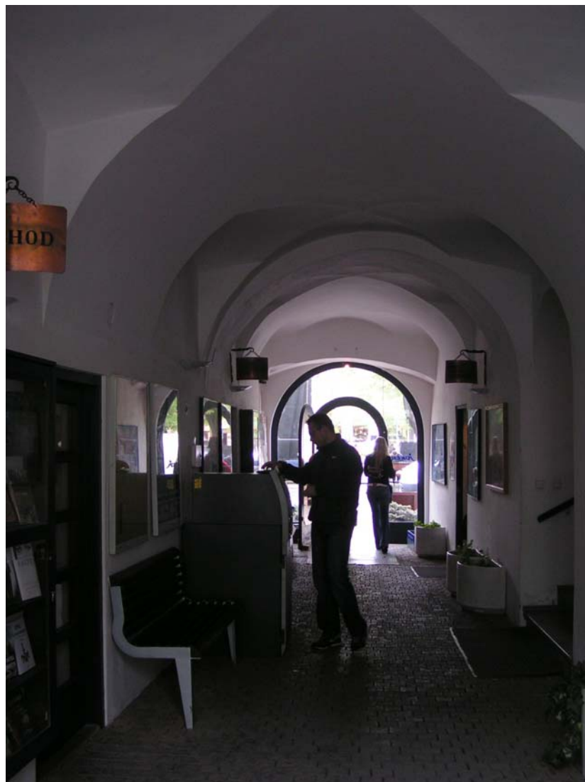
Obr:26. Celkový vzhled pasáže