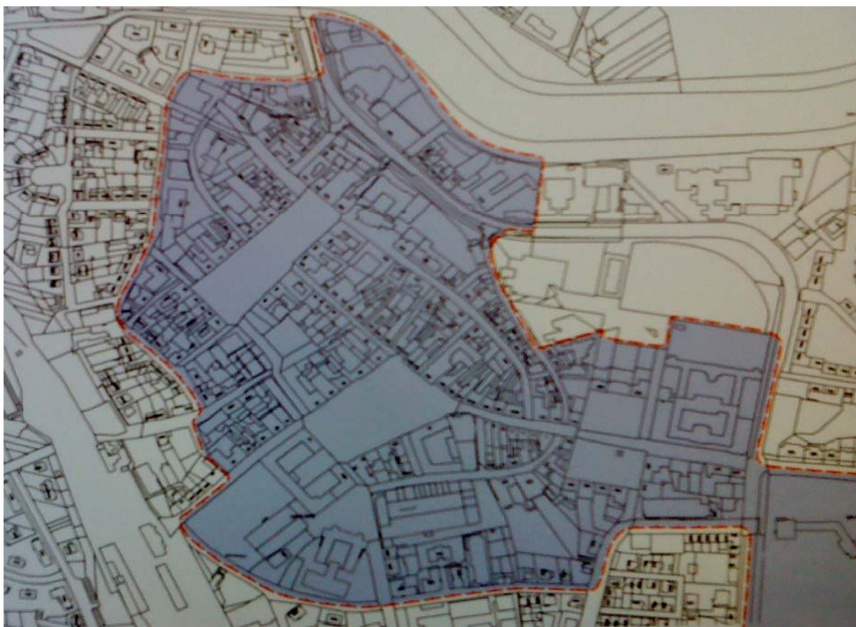
Obr: 11, 12. Historické jádro města (3)