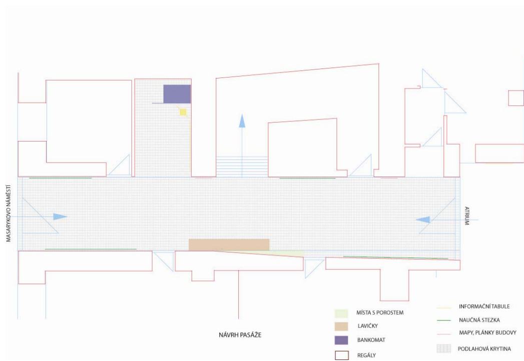
Obr: 38. Návrh změn půdorysu