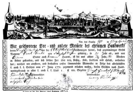
Obr: 6. Veduta na výučním listě, neznámý, autor sedmdesátá léta 18. století (7)

Zrcadlo slavného markrabství moravského...(7)