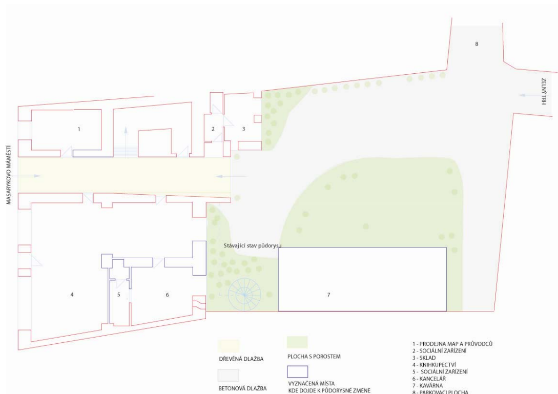
Obr: 39. Stávající stav půdorysu