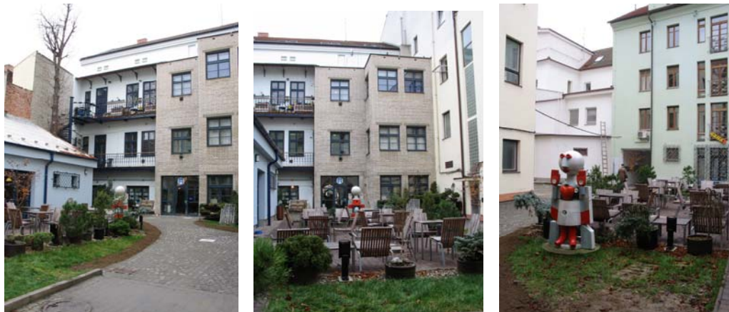
Obr:28, 29, 30. Materiálová, barevnostní, výšková různorodost atria