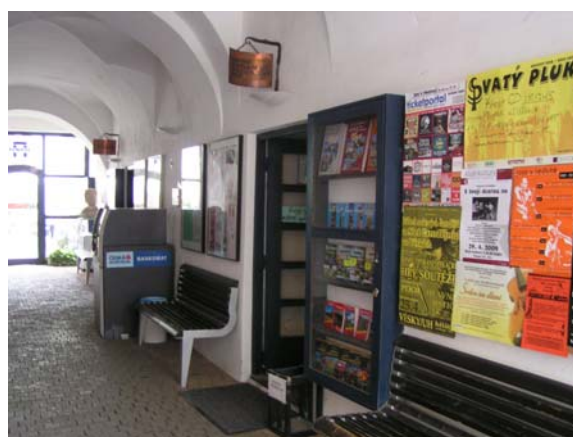
Obr: 22, 23, 24, 25. Pohledy do pasáže