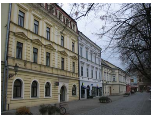
Obr: 16, 17. Pohled z Masarykova náměstí