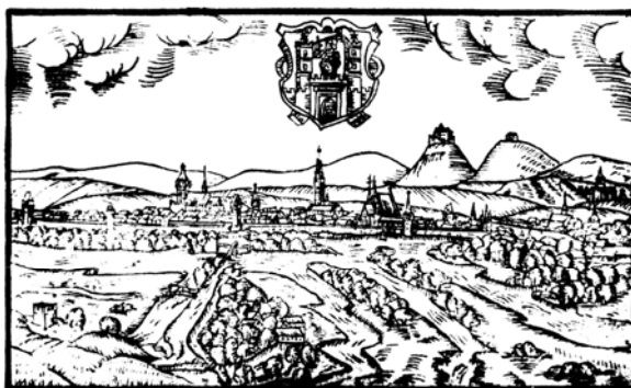
Obr:5. Veduta Jana Willenberga z roku 1593, otištěná v knize Bartoloměje Paprockého:

Zrcadlo slavného markrabství moravského...(7)