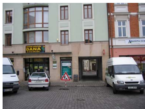
Obr: 18, 19. Pohled ze Zelného trhu