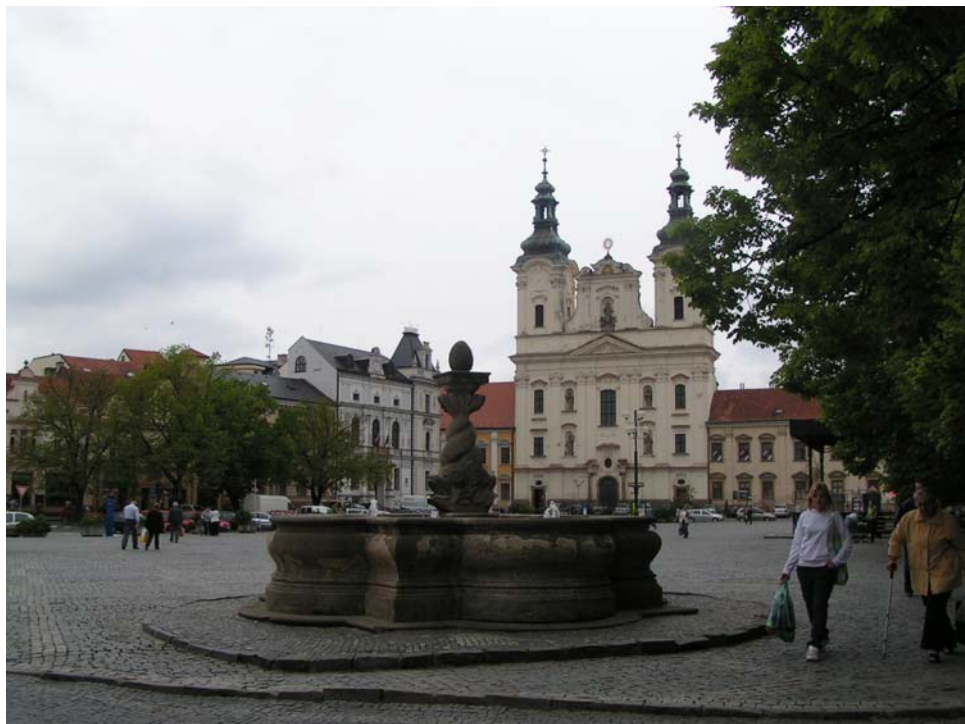
Obr: 13. Masarykovo náměstí s dominantou kostela Františka Xavera