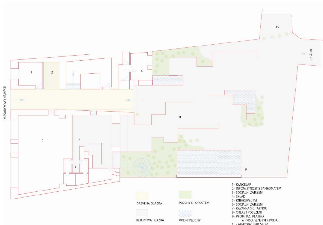
Obr: 40. Návrh změn půdorysu