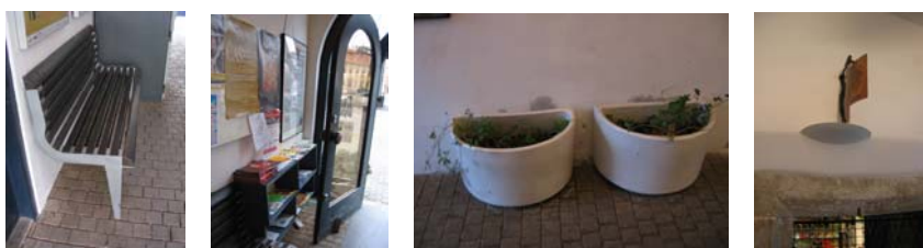
Obr: 27. Mobiliář pasáže