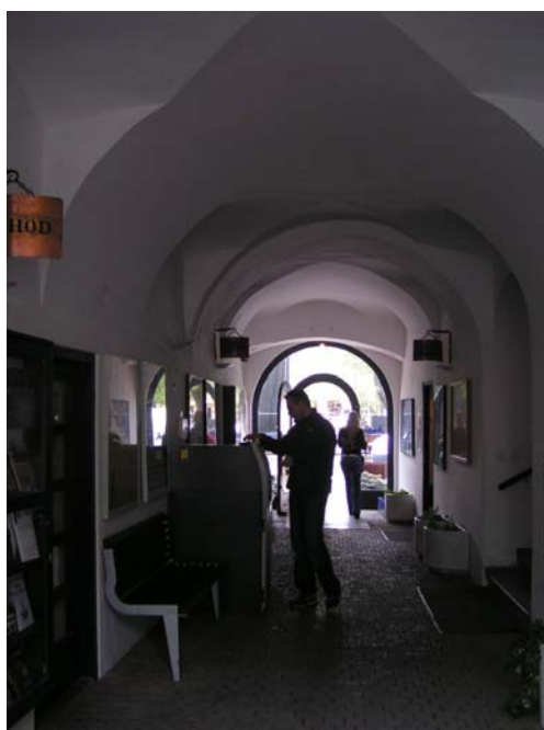
Obr: 21. Průhled pasáží