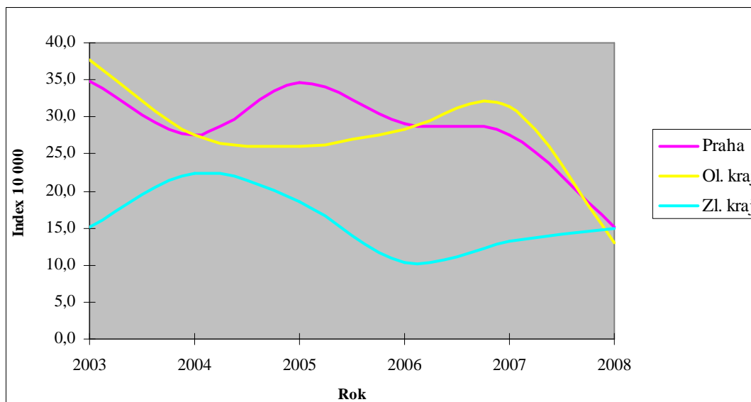
Graf 2: Grafické znázornění násil. kriminality u porovnávaných krajů.

Graf 2 znázorňuje průběh násilné kriminality mladistvých v Praze, Olomouckém a Zlínském kraji v období let 2003 – 2008. Grafické vyjádření vypovídá o tom, že násilná kriminalita sice v porovnávaných letech má střídavě klesající a stoupající průběh, nicméně v celé šíři u všech porovnávaných krajů křivky postupně klesají. Porovnáním indexů násilné kriminality spáchané mladistvými v Praze, Olomouckém a Zlínském kraji v období let 2003-2007, zjistíme, že Praha a Olomoucký kraj ve všech letech dosahují významně vyšších hodnot než indexy Zlínského kraje. V roce 2008 se vypočítané indexy u všech subjektů dostávají na téměř shodnou hranici.