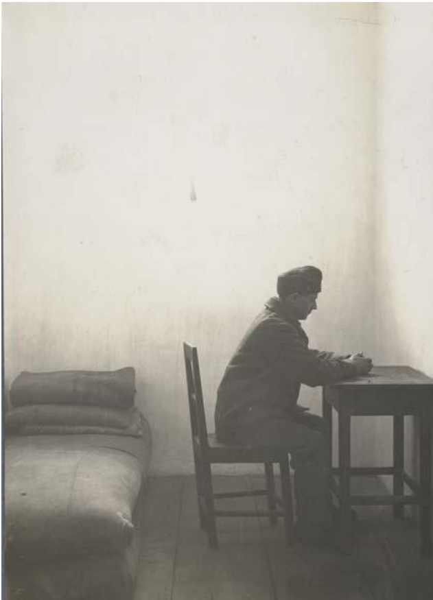
Obrázek 1 - Výkon samovazby

Za uvedené zločiny se ukládal buď nejvyšší trest – hrdelní, nebo doživotí. V závislosti na režimu konkrétní věznice se dále rozlišoval žalář a těžký žalář. V prvním uvedeném případě se pohyboval trestanec bez okovů na nohou a byly mu povoleny návštěvy za přítomnosti dozorce. Naproti tomu v nejpřísnějším režimu rakousko-uherské trestnice - v těžkém žaláři – byl trestanec spoután na nohou a nemohl přijímat návštěvy. Výkon trestu odnětí svobody podle režimu přísnosti povinoval vězně účastí na vzdělávacích aktivitách a práci. Na základě zákonné úpravy č. 131/1867 říšských zákonů se od roku platnosti zákona upustilo od tělesných trestů a používání okovů se nahradilo jiným tresty, které uvádím níže.