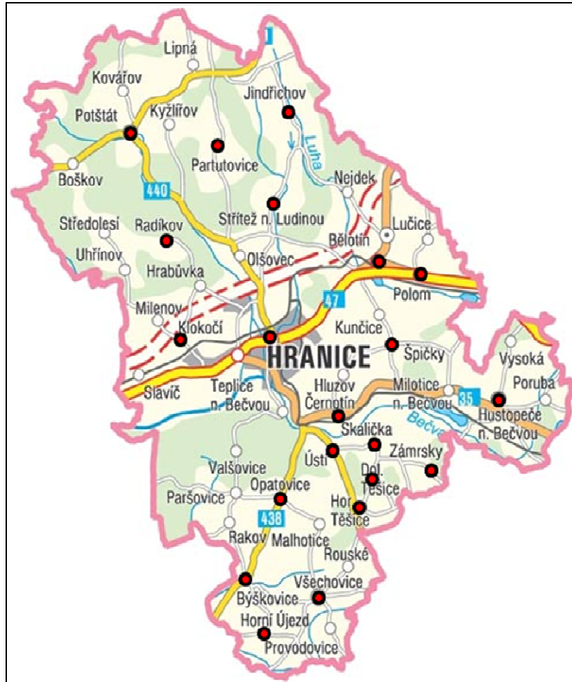
Obr. 2: Mapa členských obcí Mikroregionu Hranicko.

K 1. 1. 2010 má Mikroregion celkem 21 členských obcí: Běloutín, Býskovice, Černotín, Dolní Těšice, Horní Těšice, Horní Újezd, Hranice, Hustopeče nad Bečvou, Jindřichov, Klokočí, Opatovice, Partutovice, Polom, Potštát, Radíkov, Skalička, Střítež nad Ludinou, Špičky, Ústí, Všechnovice a Zámrský (Obr. 2).