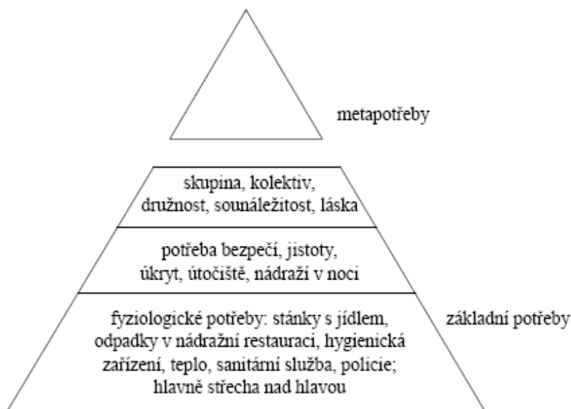
Obr. 1. Pyramida potřeb bezdomovců 9

Existuje Maslowova pyramida potřeb, zobrazující potřeby seberealizační, sebeúcty, lásky a potřeby někam patřit, jistoty a bezpečí a fyziologické potřeby. Tato pyramida byla upravena dle Pascala Pichona, zobrazuje pyramidu potřeb lidí žijících na nádraží. 8