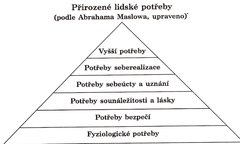
Obr. 3. Přirozené lidské potřeby

Za vyšší potřeby jsou považovány „...potřeby estetické (potřeba krásy, souměrnosti, harmonie), etické (potřeba pravdy, spravedlnosti, mravnosti), potřeba duchovní (věřit v něco, co nás přesahuje, ...)“ (Kopřiva et al., 2006, s. 205)