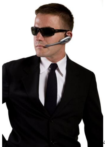
Obrázek 2 - Bodyguard