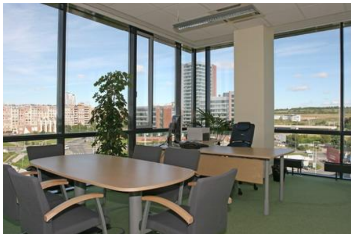
Obrázek 6 - Kancelář 9

Po splnění těchto aspektů může detektiv přejít k rozhovoru s budoucím klientem. Od klienta si nechá sdělit důvod, proč chce využít služby soukromého detektiva a co od jeho práce očekává. Také se může stát, že klient sdělí jen to, co požaduje (získání dokumentů, sledování osoby ...) bez udání důvodu. Detektiv si vyžádá doplňující informace, které bude potřebovat k řešení zakázky. Nyní přichází chvíle, kdy si soukromý detektiv danou situaci promyslí a nabídne klientovi postup, kterým by danou zakázku řešil. U menších zakázek lze tento postup sdělit již na první schůzce. Pokud je zakázka rozsáhlejší, je vhodné si nejdříve zjistit podrobnější informace, popřípadě se poradit s ostatními zaměstnanci detektivní kanceláře. Tento postup je, dle mého názoru, stejný, ať je již zakázka řešena jakýmkoliv způsobem. Dále se zaměřím na případ, kdy soukromý detektiv využije pro řešení sledování, a vypíše jednotlivé fáze, kterými by měl projít.