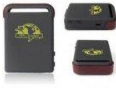
Obrázek 9 – GPS lokátor 12

Jak jsem již uvedl, tak využití těchto zařízení je pro činnost soukromého detektiva velmi přínosné a v praxi hojně používané, ale narážíme zde na otázku zákonnosti. Dle platných zákonů smí provádět SOV, při kterém se technickými nebo jinými prostředky získávají poznatky o osobách či věcech, pouze Policie České republiky a jiné státní složky, které jsou k tomu určeny a to na základě povolení státního zástupce, nebo soudce.