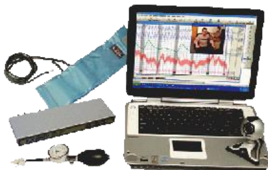
Obrázek 4 – Polygraf 6

Metod a přístrojů je více a vznikají stále nové. Žádná z nich není stoprocentní, ale šance na jejich oklamání je velmi malá a bez speciální přípravy téměř žádná.