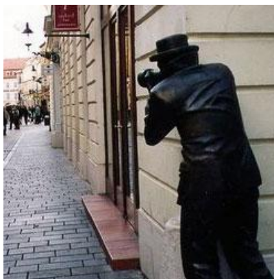
Obrázek 5 - Dokumentování 7

Legalita, zejména audio a video záznamů a jejich použití před soudem, je velmi sporná. Soukromý detektiv musí být velmi vynalézavý, aby mohla být tato dokumentace použita před soudem jako důkaz.