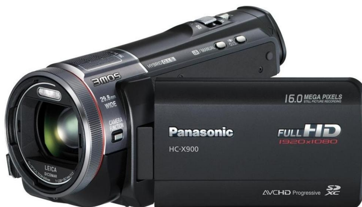
Obrázek 8 - Kamera 11