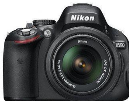
Obrázek 7 - Fotoaparát 10