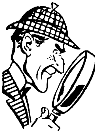
Obrázek 1 - Detektiv 2

„Služby spojené s hledáním majetku a osob, se zjišťováním skutečností, které mohou sloužit jako důkazní prostředky, získáváním informací týkajících se fyzických nebo právnických osob nebo jejich majetkových poměrů, získáváním informací v souvislosti s vymáháním pohledávek, vyhledáváním protiprávních jednání ohrožujících obchodní tajemství, a s tím související sběr dat a jejich vyhodnocování.“ 1