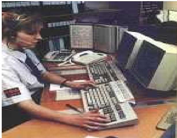
Obr. 2. Operačné stredisko

Operačné stredisko (Control Room), je miesto, odkiaľ sú všetky príslušné aktivity, informácie, postavenie a správy od bezpečnostných pracovníkov a stanovišť zaznamenávané, vyhodnocované a organizačne podporované.