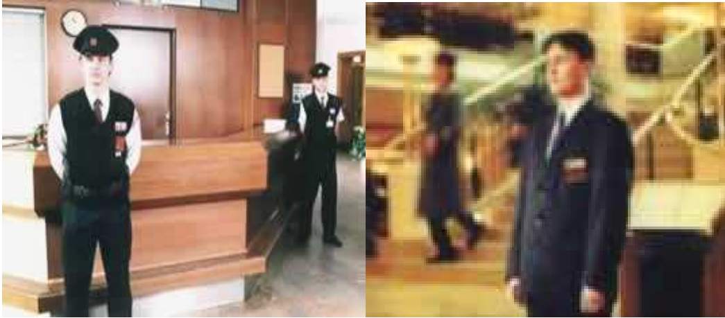
Obr. 1. Pracovníci fyzickej ochrany