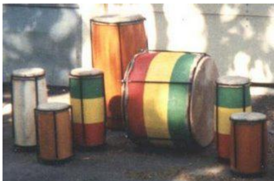
Obr. 1 Nyabinghi bubny