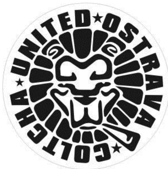
Obr. 26 Původní logo Coltcha United

Jako třetí jsme objevila také logo, nebo možná i banner (viz. Obr. 28). Ten vychází částečně z druhého motivu, kde je jak hvězda, tak i etiopská trikolora, doplněná o motiv palem.