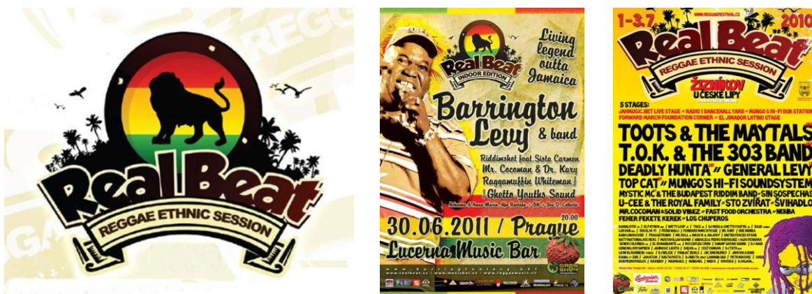
Obr. 13 Logo a plakáty Reggae Ethnic Session

V České republice patřil mezi nejznámější festival Real Beat Reggae Ethnic Session (viz. Obr. 13), který však loni ukončil svou činnost. Dnes funguje spíše jako pořadatel koncertů reggae hudebníků. Vizuální styl vychází z klasických reggae symbolů. Motiv lva umístěn v kruhu, pod ním je umístěná stuha s názvem Real Beat a doplněna o siluetu tropického lesa. Písmo je kombinací fontů hrubších syrových rysů a ručně psaného charakteru. Na plakátech hojně využívají klasickou barevnost, doplněnou i kresby dívek či fotografie. Jako podklady nejraději volí texturu starého papíru či látky.