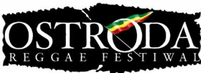
Obr. 16 Logo Ostroda Reggae Festivalu

mé pruhy a jednoduchý znak nebo ornament připomínající prvky lidové kultury, stylizovaný basový klíč a také srdce. Plakát je pojatý úplně jednoduše ve dvou barvách. Text vytváří motiv afrického kontinentu. Nezvykle a jednoduše jsou pojaté i webové stránky, na nichž si většina ať už interpretů nebo festivalů nezakládá. Je skvělé, že se někdo nebojí experimentovat a oprostít se od lvů a dalších opakujících se motivů.