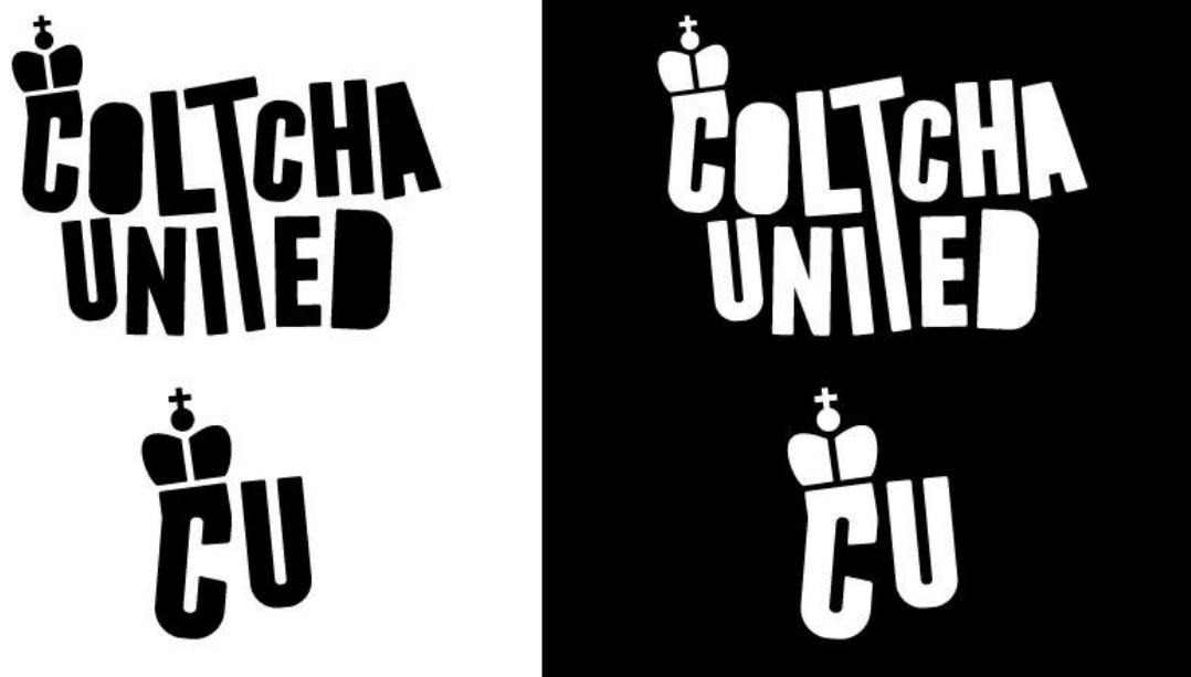
Obr. 31 Nový logotyp a jeho zkrácená verze