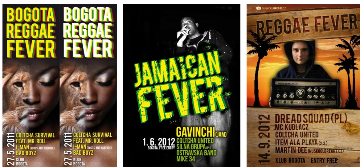
Obr. 30 Náhledy plakátů Bogota Reggae Fever 2011/2012