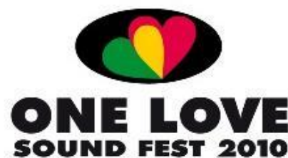
Obr. 17 Logo One Love Sound Fest