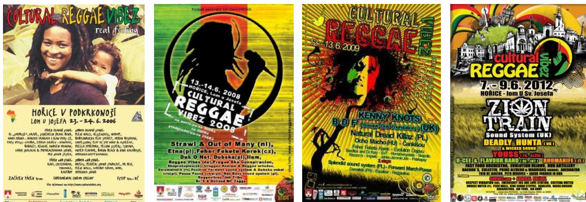
Obr. 14 Cultural Reggae VibeZ plakáty

Další český reggae festival působící 11 let je Cultural Reggae VibeZ, kterého se Coltcha United poslední tři roky účastnila. Vizuální styl tohoto festivalu je od počátku nejednotný (viz. Obr. 14) a každý rok jako by hledal svou vlastní novou identitu, kterou se vyjádřit. V posledních třech letech vyhrává motiv stylizace a černobílé koláže doplněné o barevné akcenty a struktury. Logotyp má podobu textu ve stylu hippie fontu v minuskách doplněný o kruhový motiv, kde v něm je umístěn stylizovaným profil dreadatého zpěváka