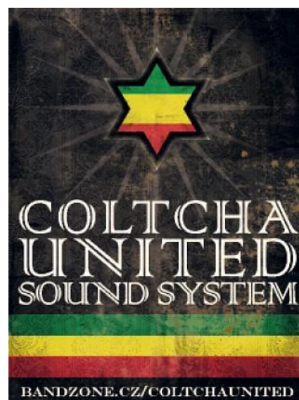
Obr. 27 Logo/banner 1