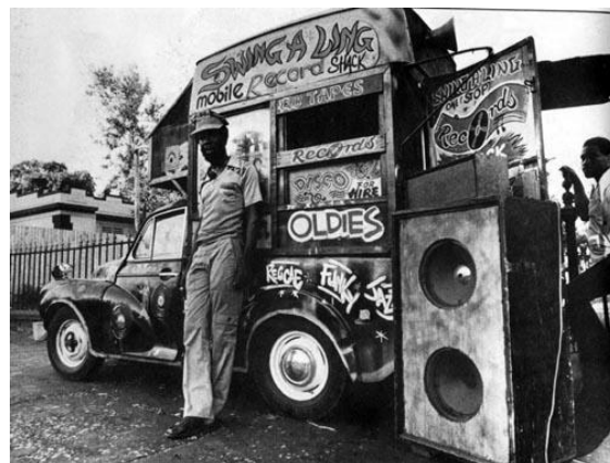
Obr. 5 Sound systém