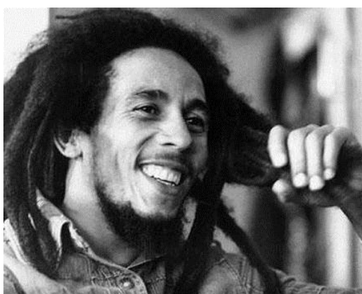
Obr. 6 Robert Nesta Marley