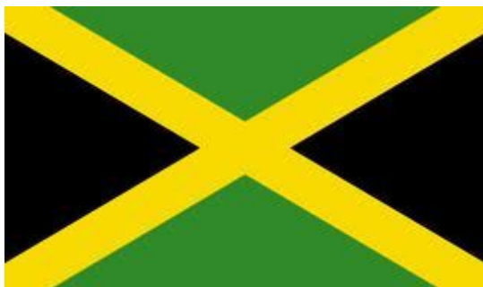
Obr. 8 Jamajská vlajka