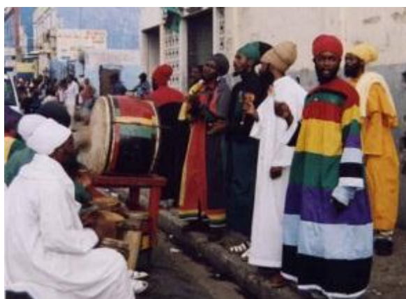
Obr. 7 Bobo shanti