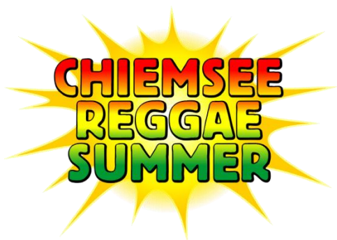
Obr. 19 Logo Chiemsee Reggae Summer

Světově nejproslulejší reggae festivaly se odehrávají jak jinak než na Jamajce. Mezi největší vůbec patří Reggae SumFest (viz. Obr. 20). V logu opět kombinuje kruhový motiv symbolizující slunce s postavou dreadatého muže, který skáče. Tato značka je doplněna o psaný text v rasta barvách. Na plakátech používá koláže fotografií umělců, ale i vektorových objektů. I když tyto plakáty mohou působit přelácaně, je zřejmé, že každoročně sledují módní trendy v designu a snaží se je následovat.