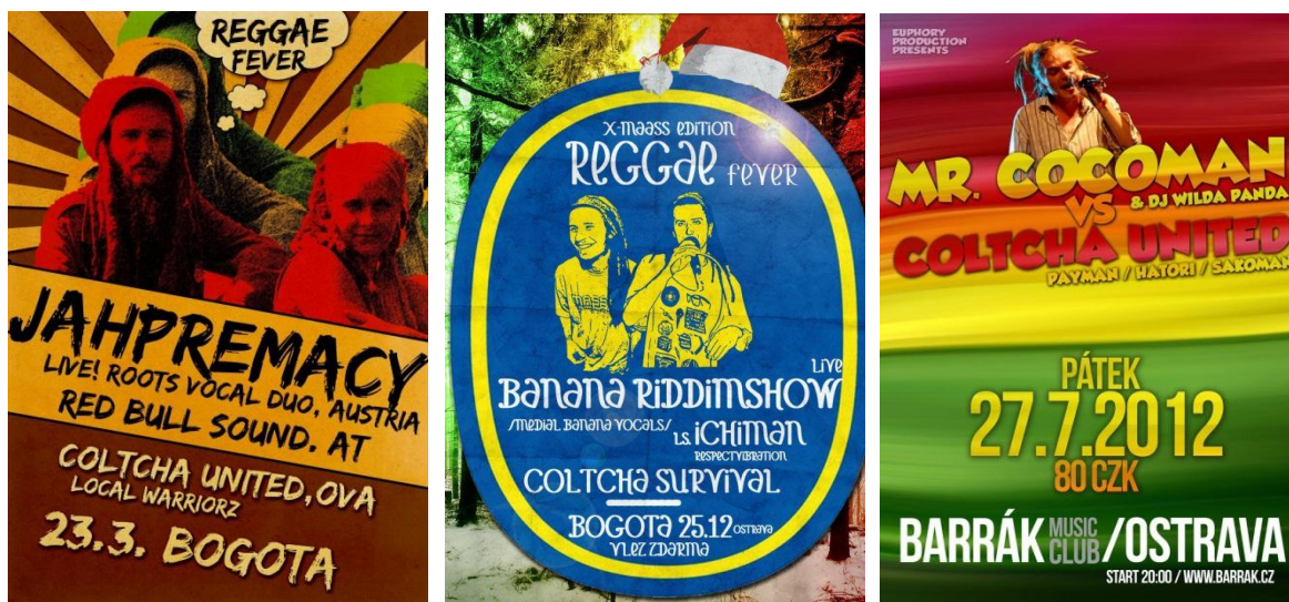
Obr. 29 Náhledy plakátů 2011/2012

Plakáty na jednotlivé akce mají většinou na starosti různí grafici, a proto vypadá každý plakát úplně jinak (viz. Obr. 29). Je ale fajn vidět různé vlivy a pohledy na danou věc od různých grafiků. Některé jsou více povedené a inspirativní a ty další méně. Každopádně i práce od jednoho grafika se liší s každým plakátem. Nepoužívá se na nich ani logo.