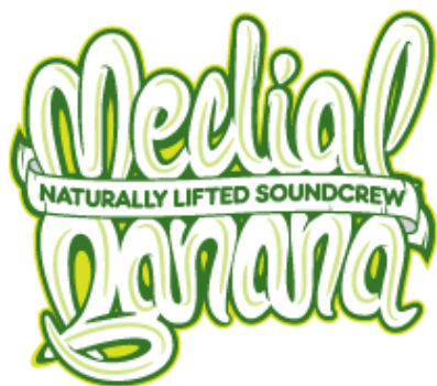
Obr. 24 Logo Medial Banana