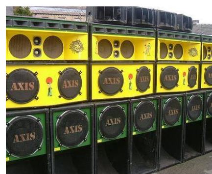
Obr. 12 Sound systém výzdoba