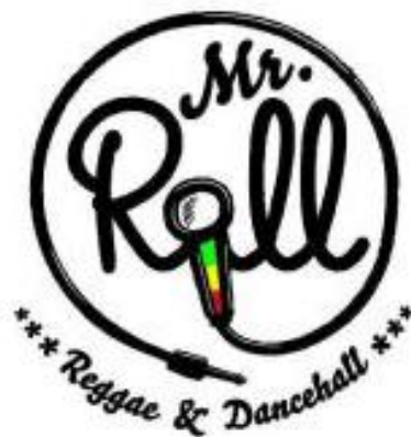
Obr. 25 Logo Mr. Roll