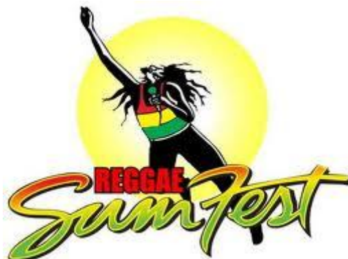
Obr. 20 Logo Reggae Sum Fest