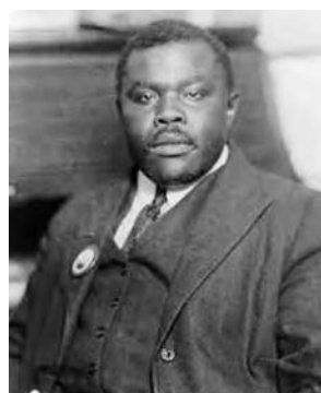
Obr. 2 Marcus Garvey