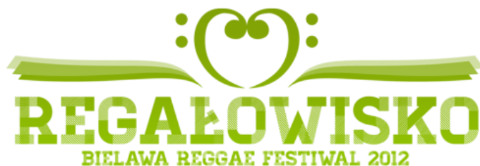
Obr. 18 Logo a plakát Regalowisko Reggae Festivalu