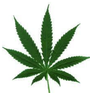
Obr. 11 Marihuana