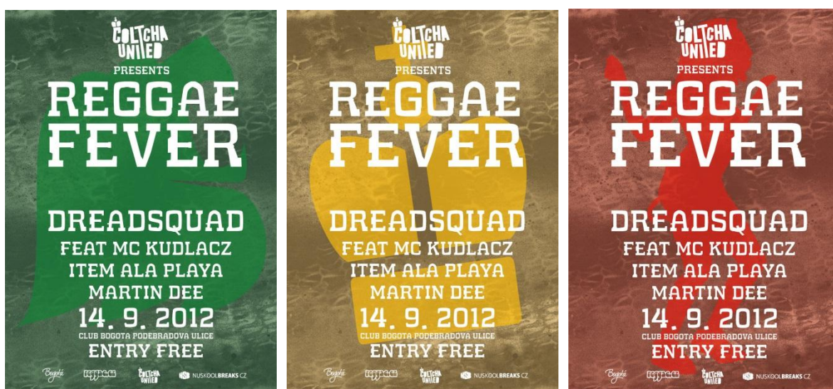
Obr. 32 Nové plakáty Bogota Reggae Fever

Tímto vzniká možnost udělat na jednu akci tři plakáty, které budou mezi sebou komunikovat nejen motivem, ale i barevností odkazující k reggae. Díky této jednoduché finančně nenáročné výrobě se mohou plakáty vyrobit ve více kopiích a budou odolnější i proti vnějším vlivům díky použití sprejů. Daly by se mezi sebou variovat, kde by se mohla použít trikolora, tak i kombinace dvou kolor či nechat každou barvu vyznít samostatně. Tím by se tyto také plakáty sjednotily a nesly by se celý rok i déle v jednom duchu.