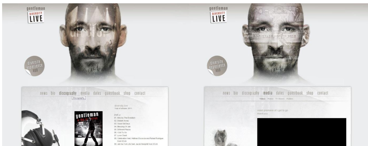
Obr. 23 Webové stránky Gentleman