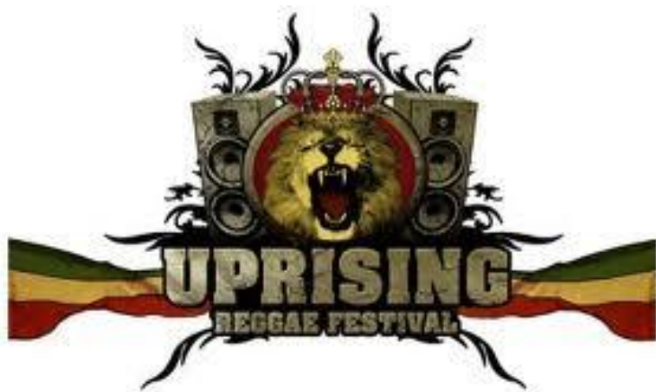
Obr. 15 Logo a plakát Uprising Reggae festival

Uprising Reggae Festival (viz. Obr. 15) se koná v Bratislavě na Slovensku a letos proběhl už pátý ročník. Je to jeden z největších festivalů ve střední Evropě a každým rokem se rozšiřuje. Je to jeden z mála festivalů, který se drží stále stejného vizuálního sdělení. Uplatňuje jej na plakátech, bannerech, vstupenkách, ale i při výzdobě areálu a na doprovodných propagačních materiálech jako jsou trička, mikiny, placky nebo šňůrky na klíče. Jeho hlavní motiv spočívá v dřevěných motivech na pozadí. Na tomto motivu jsou jakoby přilepeny papíry nebo dřevěné a kovové destičky, na nichž je umístěn daný text tj. informace, interpreti a doprovodný program festivalu. Informační písmo je stylizováno do stencil písma. V pozadí také hojně užívají motiv džungle a zvířat. Důležitým prvkem jsou koláže fotografií jednotlivých vystupujících. V logotypu je použita řvoucí hlava lva s korunou v kruhovém motivu, umístěna mezi dvěma soundovými bednami. Font názvu festivalu je pojatý ve stylu University písem v Americe a budí dojem, že je vytesán z kamene. Celý tento motiv je podtrhnut drobnou stužkou v rasta barvách.