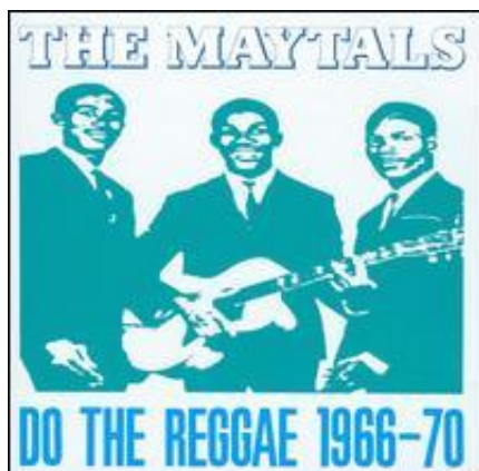
Obr. 4 Toots and the Maytals Do they Reggay