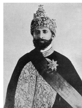
Obr. 3 Haile Selasie I.