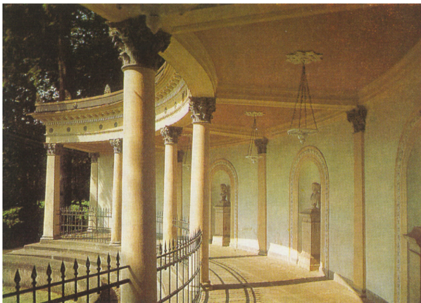
Pompejská kolonáda na snímku z roku 1997