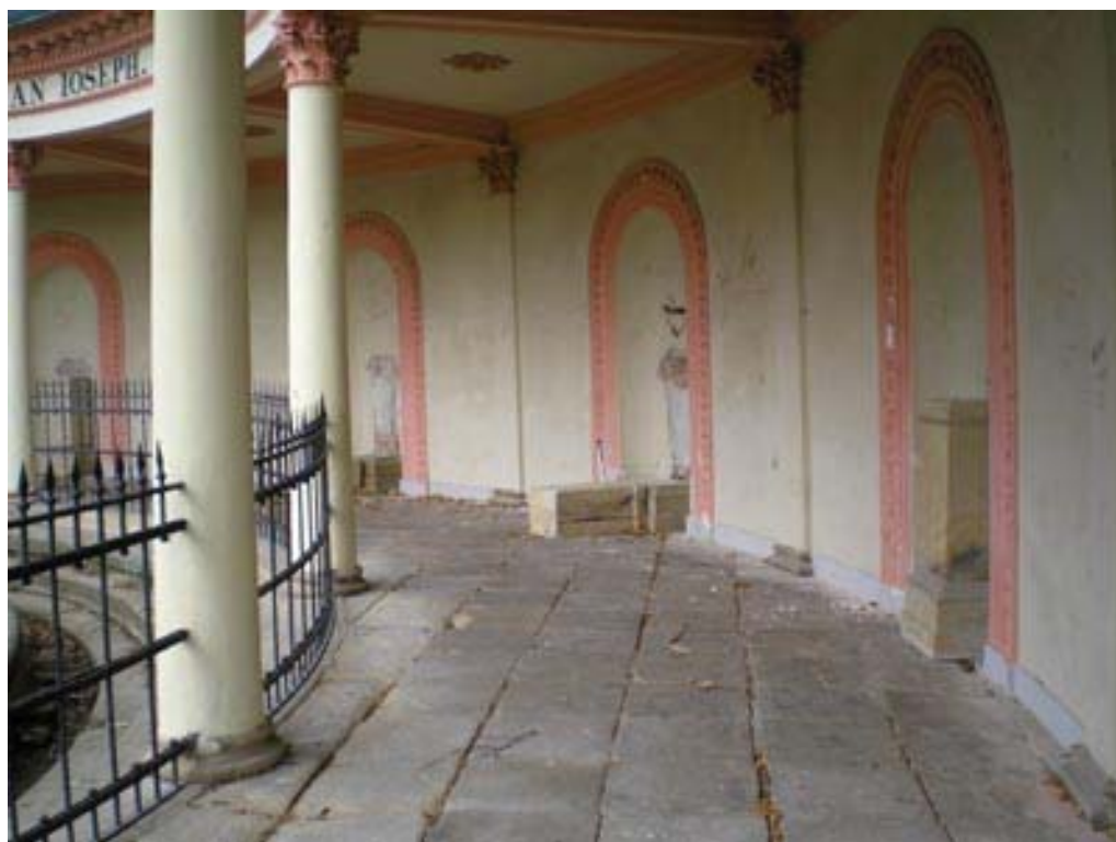
Pompejská kolonáda v roce 2007