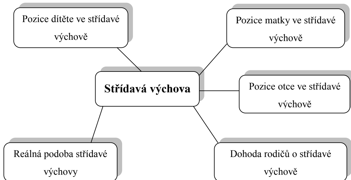
Obrázek 1 – Střídavá výchova a její kategorie

Otevřeným kódováním jsme získaly 5 hlavních kategorií a 18 subkategorií, které budeme blíže popisovat i pomocí výpovědí respondentů. Ukázkou příkladů kódování uvádíme v příloze III.