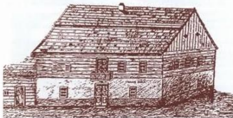
Stará škola v Rožmitále, ve které působil J.J.Ryba v letech 1788- 1815, vyhořela 9.8.1874 . J.J.Ryba zde začal učit jako dvacetiletý 18.2.1788