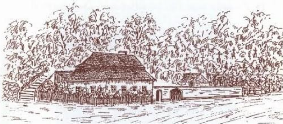
Pravděpodobná podoba staré dřevěné školy, která stála pod hřbitovem a starým kostelem v Přešticích.