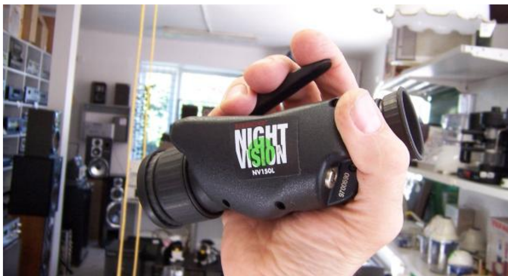
Obr. 1 Noktovizor

Plně jim dnes konkurují CCD kamery s vysokou citlivostí.