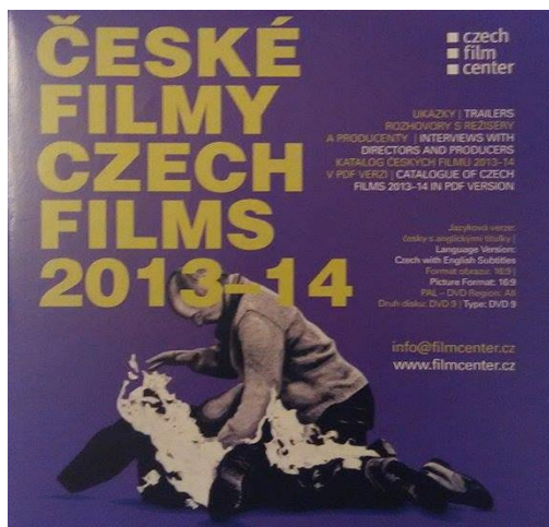
DVD České filmy 2013-14