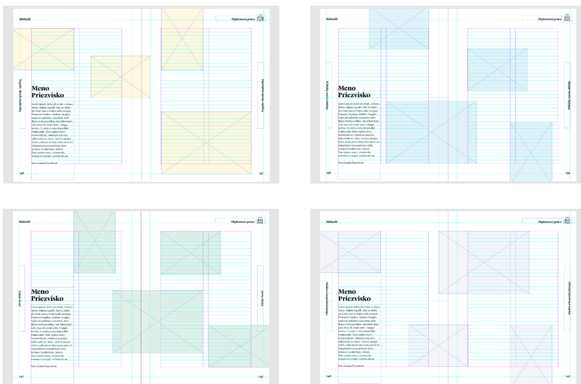
Obr. 14. až 17. – náhľad layoutu a kompozície

na prvý pohľad zložitému zovňajšku, nechcel pridávať zbytočné prvky, ktoré by autorovu prácu podľa môjho názoru len zbytočne potláčali do úzadia. Preto som si dal za cieľ, aby vynikli hlavne samotné knihy. Každú knihu reprezentujú štyri fotografie, ktoré by mali vyjadrovať celkový charakter diela. Na daný formát by určite vošlo väčšie množstvo kníh, ale tento počet mi prišiel ako vhodný kompromis medzi tým, aby divák nezačal po chvíli nudiť svojim rozsiahlym počtom a aby zároveň dostatočne popisoval ako samotná kniha vyzerá. Umiestnenie fotografií, popisného textu ako aj navigácie v knihe vychádza z dopredu navrhnutého layoutu, v ktorom sú fotografie umiestnené presne na mriežku, zarovnané s okrajom, alebo umiestnené na spadávku. Snažil som sa o zaujímavé a harmonické umiestnenie fotografií v kontraste s bielou plochou, ktorú vnímam ako grafický prvok sám o sebe. Popis autora ako aj navigácia sa na strane nemení.