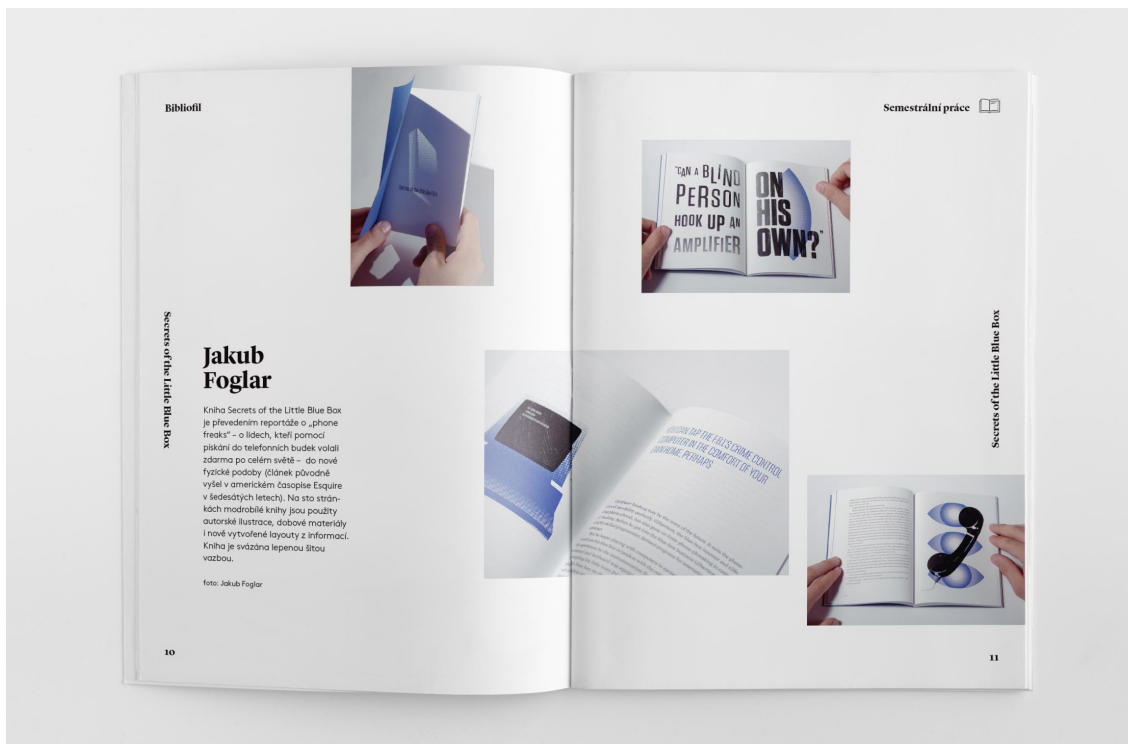
Obr. 20. – náhľad finálneho layoutu s fotkami

Zvolil som dva druhy fontu, a to Lyon Bold a Brown Light. Lyon pôsobí klasickejšie, je to serifový font, použil som ho ako titulkový a tiež v navigácií. Do kontrastu k dominantne pôsobiacemu fontu Lyon som zvolil moderný font Brown, rezal Light pre jeho pokojné pôsobenie a dobrú čitateľnosť v malej veľkosti. Vnútorne strany sú vytlačené na matný, nie úplne biely 70g papier Holmen Book. Obálka knihy je vytlačená na pevnejší prírodný hnedý papier Kraftpack 280g., ktorý je potlačený bielou farbou. Všetkých 144 strán zborníku spolu s obálkou je spojených mäkkou šitou väzbou V4. Väzba je pre jej kvalitné spracovanie vhodná pre často namáhané knihy a neuberá veľa miesta na spoji strán, čo je vhodné pri použití fotiek ktoré na seba nadväzujú z jednej strany na druhú. Zborník má príjemný rozmer do ruky 170x230 mm.