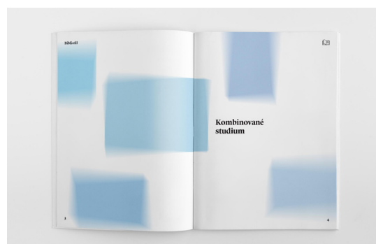
Obr. 21. – finálny náhľad obálky