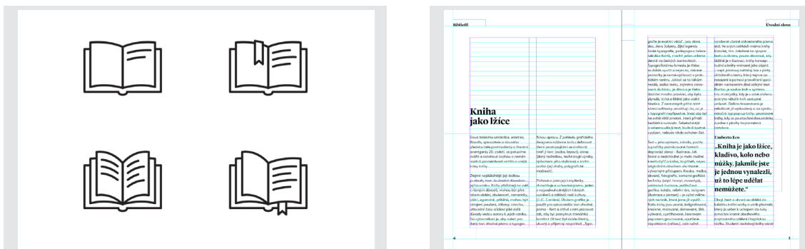
Obr. 18. a 19. – piktogramy a layout textu

Zvolil som dva druhy fontu, a to Lyon Bold a Brown Light. Lyon pôsobí klasickejšie, je to serifový font, použil som ho ako titulkový a tiež v navigácií. Do kontrastu k dominantne pôsobiacemu fontu Lyon som zvolil moderný font Brown, rezal Light pre jeho pokojné pôsobenie a dobrú čitateľnosť v malej veľkosti. Vnútorne strany sú vytlačené na matný, nie úplne biely 70g papier Holmen Book. Obálka knihy je vytlačená na pevnejší prírodný hnedý papier Kraftpack 280g., ktorý je potlačený bielou farbou. Všetkých 144 strán zborníku spolu s obálkou je spojených mäkkou šitou väzbou V4. Väzba je pre jej kvalitné spracovanie vhodná pre často namáhané knihy a neuberá veľa miesta na spoji strán, čo je vhodné pri použití fotiek ktoré na seba nadväzujú z jednej strany na druhú. Zborník má príjemný rozmer do ruky 170x230 mm.