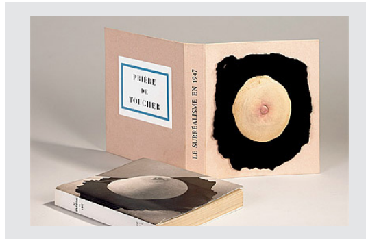
Obr. 7. – Marcel Duchamp, Prière de toucher , 1947.

Týchto hodnôt sa uchopili najmä umelci tvoriaci pod záštitou pop-art, ktorí často experimentovali s materiálom, následkom čoho vznikali knihy z kovu, umelej hmoty, dreva, hliníka, kameňa či gumy. Okolo roku 1980 sa tento trend naďalej prehľboval a začali sa naplno tvoriť knihy ako socha a rôzne inštalácie v ambiciózných rozmeroch a formách o veľkostiach skrine až po veľkosť miestnosti v spojení s videom, počítačom a rôznou technikou. Za posledných tridsať rokov môžeme vidieť vysoký nárast umelcov tvoriacich autorskú knihu. Umelci stále tvoria nové materiály a mnohé z nich nakoniec skončia v knižnej podobe. Konajú sa výstavy, kniha sa stáva uznávaným umeleckým aspektom popri tradičným formách umenia sa stala vhodným prostriedkom k vyjadreniu širokého spektra námetov. 19