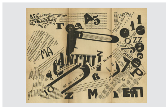
Obr. 3. a 4. – Filippo Tommaso Marinetti, Les Mots en Liberté Futuristes , 1919.

Pre prvé popudy stojace za vznikom autorských kníh by sme mohli vďačiť obdobiu surrealizmu, kde mnohí umelci experimentovali s formou zdieľania autorovej myšlienky. Vývoj fotografie zapríčinil spájanie rôznych aspektov umenia v jeden celok, k čomu bola autorská kniha vhodným prostriedkom. Vznikali koláže či už v maliarstve ako aj vo fotografii. Bolo by ťažké nájsť umelecké hnutie v 20. storočí ktoré by nemalo nič spoločné s tvorbou autorských kníh alebo časopisov. Napriek tomu neboli autorské knihy nijak zvlášť kodifikované či kriticky začleňované do dejín umenia 20. storočia. Ďalším krokom v tvorbe autorskej knihy bolo hnutie Dada v rokoch 1910 až 1920. V Európe už v tomto období bola kniha ako umelecký objekt rozšírená. Používala sa ako vyjadrovací prostriedok sociálneho, politického, alebo osobného názoru autora. Na rozdiel od Ameriky, ktorá bola s ideou knihy ako umeleckého diela pozadu až do roku okolo 1960. 13