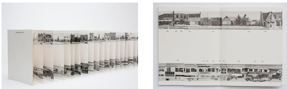
Obr. 5. a 6. – Edward Rusch, Every Building on the Sunset Strip , 1966.

Dôležitými postavami v povojnovom období v Európe bol bezpochyby Dieter Roth a Edward Ruscha. Dieter Roth zastupuje nemecko-švajčiarsku scénu a Edward Rusch Americkú, môžeme preto hovoriť o dvoch zdrojoch autorskej knihy v povojnovom období. Zatiaľ čo Edward Rusch sa vyznačoval strohosťou a minimalizmom a mal bližšie k neodadaizmu, na ktorý naviazalo v tej dobe aj hnutie Fluxus. Dieter Roth, ktorý začal pracovať s témou autorskej knihy, asi od roku 1950 vypracoval viacero sérii autorských kníh, ktoré systematicky zmenili formu knihy v rokoch 1950 až 1960. Je autorom viac než stovky titulov autorskej knihy. Roth bol taktiež prvým, kto začal na svoje knihy používať už vytláčené staré novinové papiere či komixové knižky.