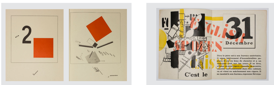
Obr. 1. – El Lissitzky, About Two Squares , 1922.

V približne rovnakom čase, keď sa Európa hnala bezhlavo do prvej svetovej vojny, rôzne skupiny avantgardných umelcov sa začali zameriavať na vydávanie brožúr, plagátov, magazínov a kníh. Je logické, že to ovplyvnilo a podporilo vývoj autorskej knihy. Ruský a európsky avantgardní umelci, ako napríklad Filippo Tommaso Marinetti, Alexander Rodchenko, El Lissitzky, Fernand Léger a André Breton sa chopili úlohy pretvoriť konvencie knihy pomocou typografie, materiálu a ilustrácii. Typografia sa stala hlavným bodom seba vyjadrovania. Tieto knihy skúmali jazyk a typografiu za pomoci búrania tradičnej sadzby a syntaxe knihy. Iný zas pretvárali formát knihy, jeho štruktúru a vnímali knihu ako objekt.