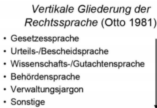
Abbildung 2: Vertikale Gliederung der Rechtssprache (Otto, 1981, S. 51)

Sie richtet sich insbesondere auf den Grad der Fachlichkeit, der an die Textempfänger stark gebunden ist. Somit entsteht eine Spannweite des Adressatenkreises von fachlich ausgebildeten Rechtsexperten bis zu juristischen Laien. Je niedriger platziert, desto mehr wächst die Allgemeinverständlichkeit und der fachsprachliche Charakter sinkt (vgl. Fuchs-Khakhar, 1987, S. 45), so wie es auf der Abbildung 2. demonstrativ mit einem Pfeil dargestellt wird. Die Behördensprache ist eine Fuge, an der die Fachsprachlichkeit und die Allgemeinverständlichkeit aufeinandertreffen. Dennoch befindet sie sich auf beiden Ebenen, denn obwohl sie einen rechtlichen Inhalt aufweist, ist die Behördensprache für die Laien bestimmt (vgl. Sandrini, 1999, S. 13).