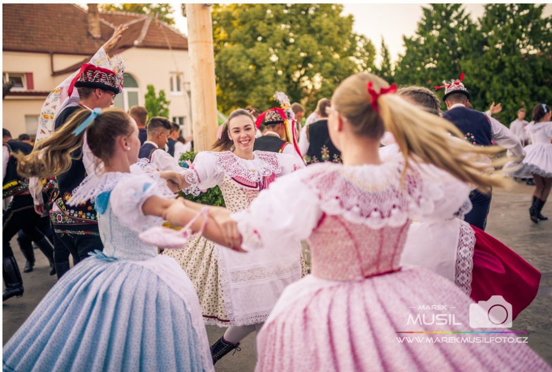
Přespolní krojovaná chasa (Krojované hody Kobylí 2017 – neděle, 2019)