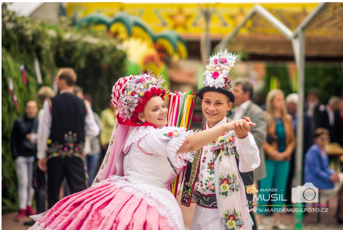
Tanec krojovaných (Krojované hody Kobylí 2017 – sobota, 2019)