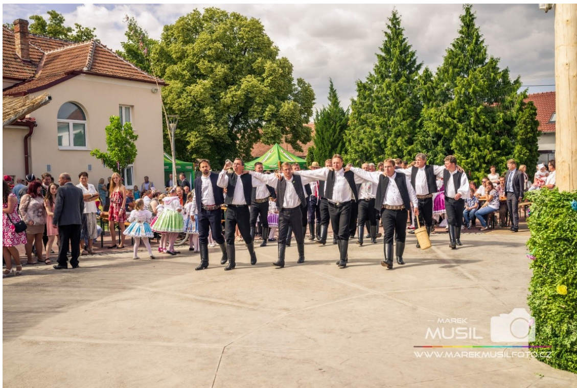
„Ženáci“ v kroji (Krojované hody Kobyly 2017 – neděle, 2019)