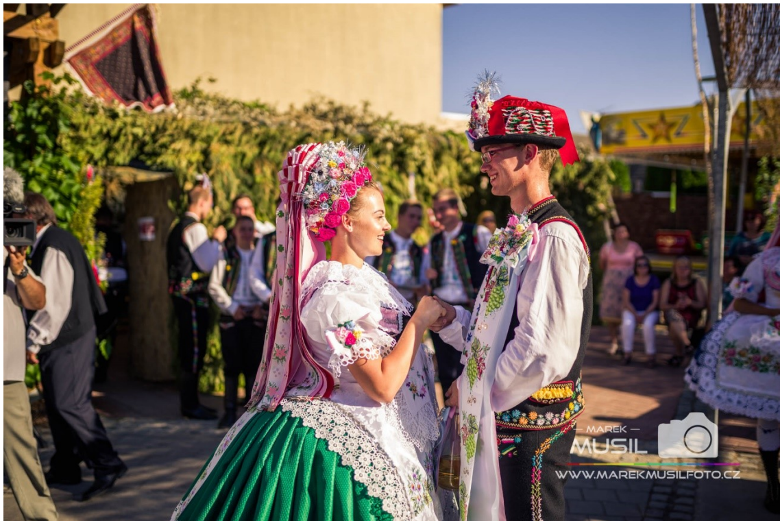
Tanec krojovaných (Krojované hody Kobyly 2017 – pondělí, 2019)