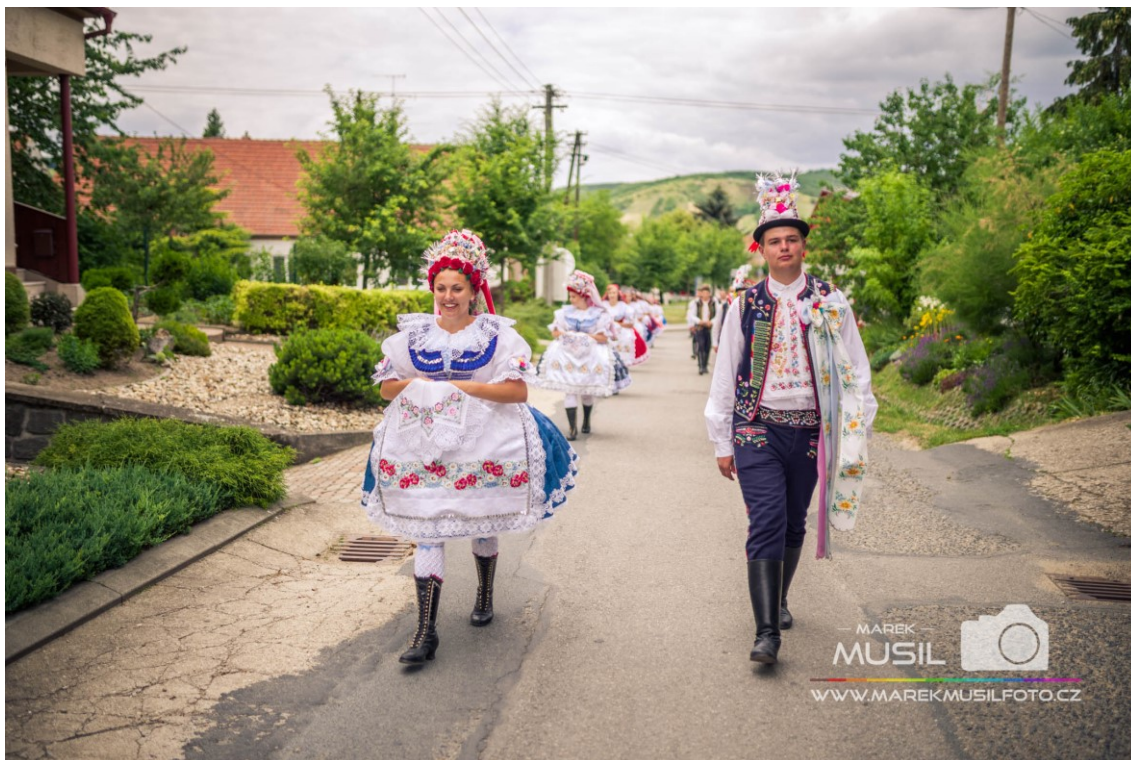
Průvod krojovaných (Krojované hody Kobylí 2017 – neděle, 2019)