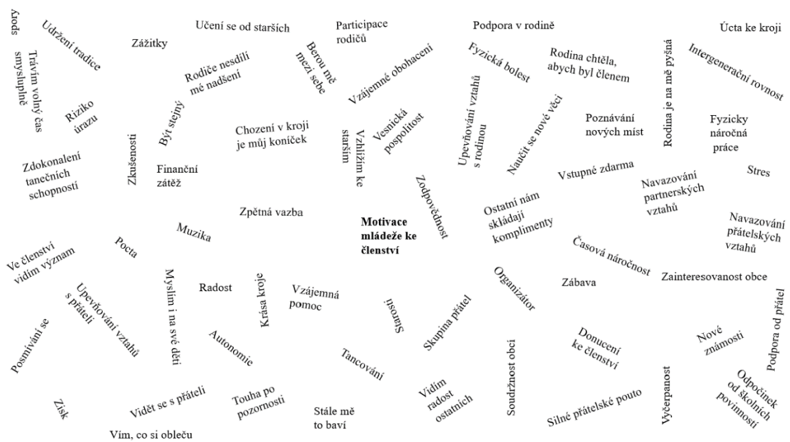
Obrázek 2: Neuspořádaná mapa – Zaměřena na motivaci mládeže ke členství

2. Vytvoření neuspořádané mapy, založené na identifikovaných prvcích.