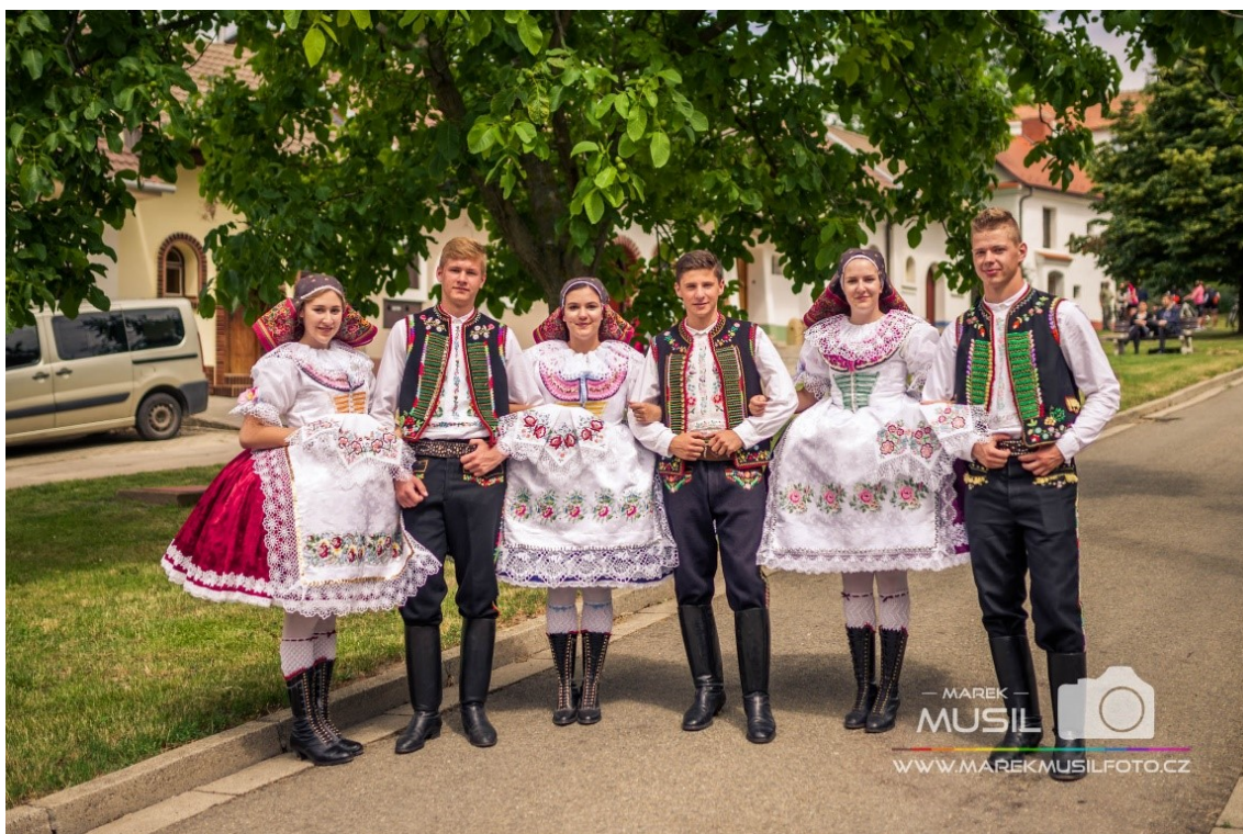
Krojovaná chasa (Krojované hody Kobylí 2017 – neděle, 2019)