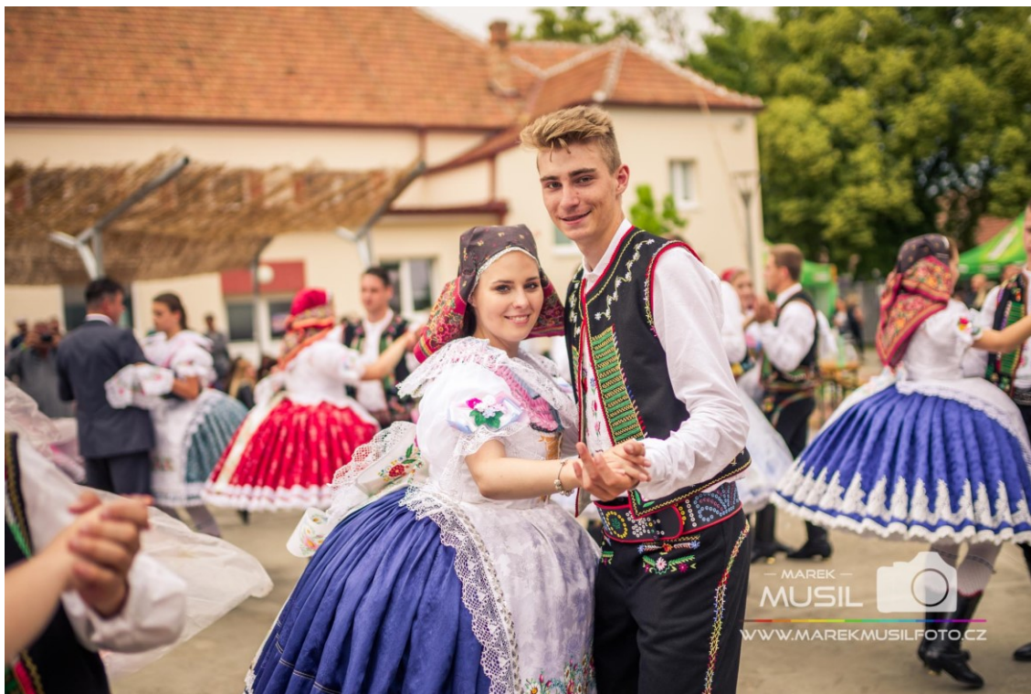
Tanec krojovaných (Krojované hody Kobylí 2017 – sobota, 2019)