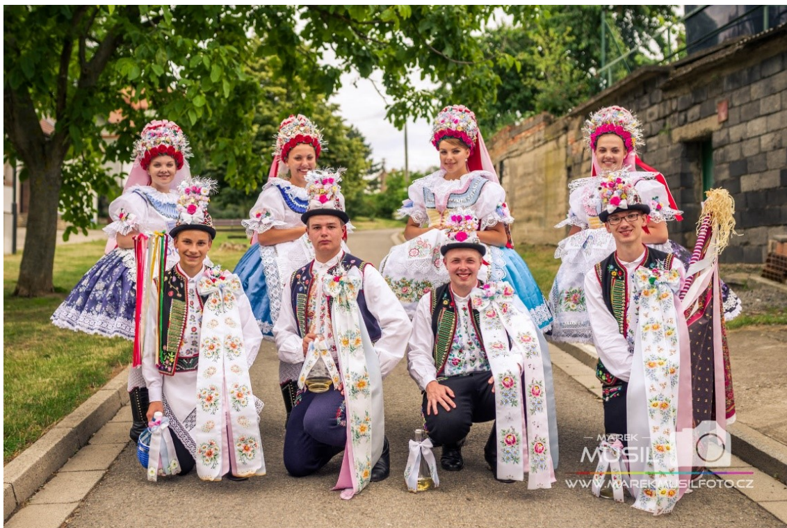
Stárci a stárky (Krojované hody Kobylí 2017 – neděle, 2019)