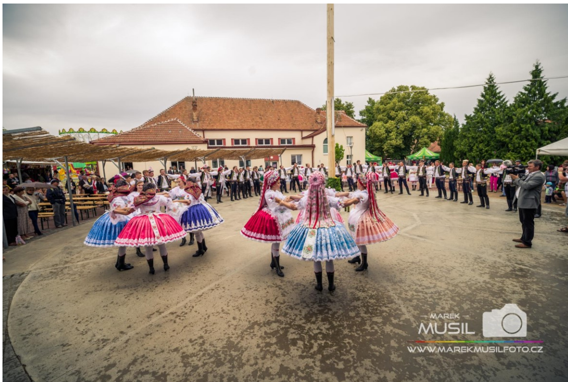
Tanec krojovaných (Krojované hody Kobylí 2017 – sobota, 2019)