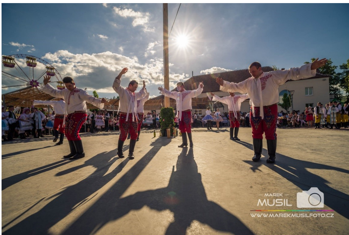
Přespolní krojovaná chasa (Krojované hody Kobyly 2017 – neděle, 2019)