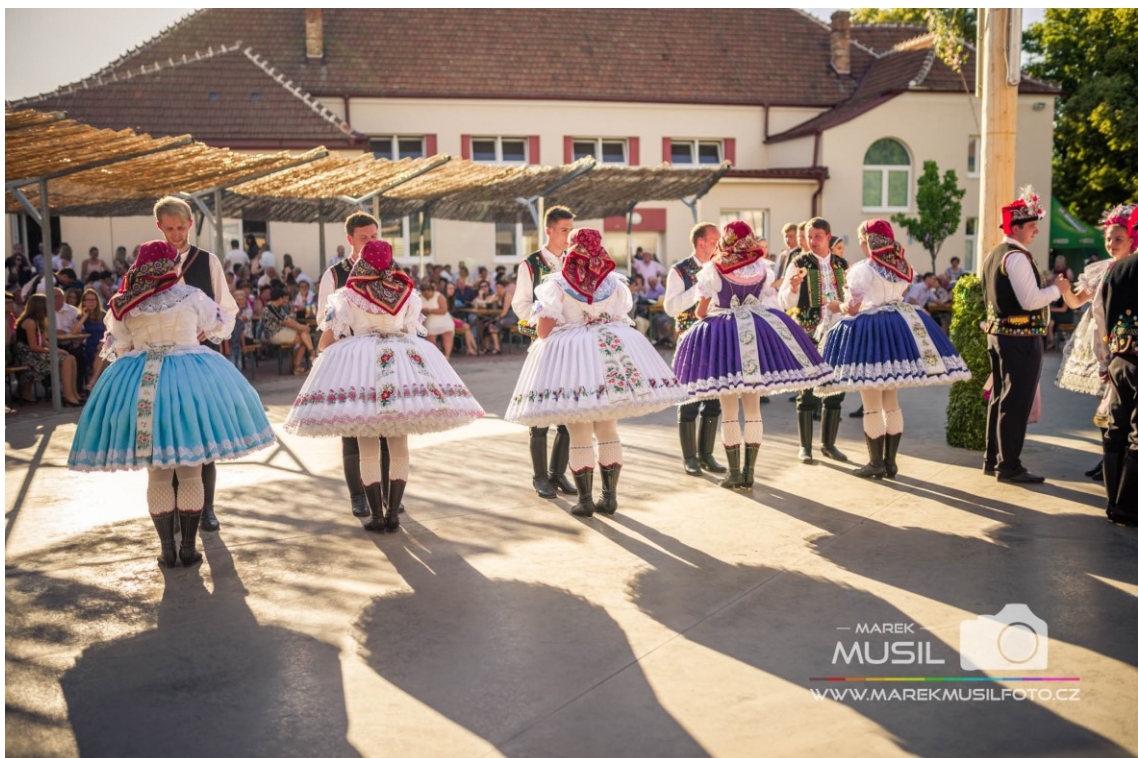
Tanec krojovaných (Krojované hody Kobyly 2017 – pondělí, 2019)