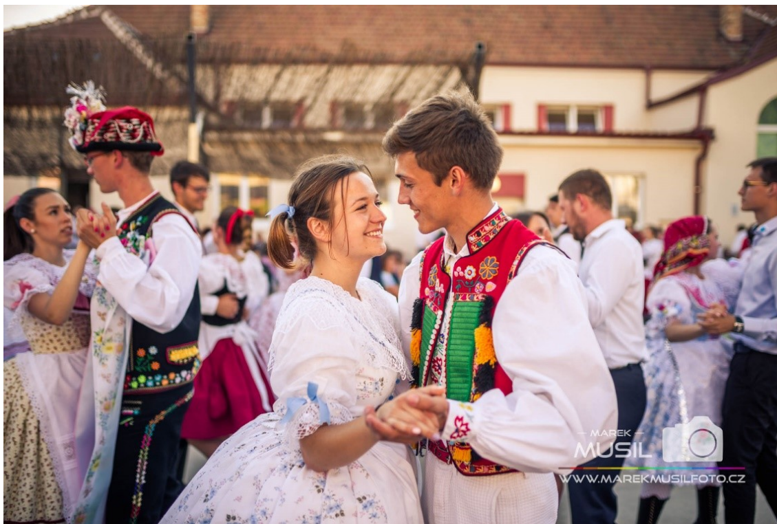
Přespolní krojovaná chasa (Krojované hody Kobylí 2017 – neděle, 2019)