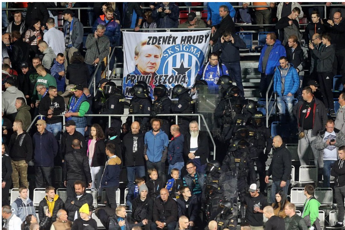
Obr. 19 Zásah PČR na stadionu [21]

Na běžné utkání je připraveno 36 pořadatelů. Na rizikové utkání 50 členů pořadatelské služby. V případě vysoce rizikového utkání je potřeba zajistit 80 pořadatelů, z toho 20 zkušených a vycvičených členů je připraveno u sektoru hostujících fanoušků. Vždy je na stadionu přítomna PČR, v případě že pořadatelé nezvládnou zajistit bezpečný chod utkání, bezpečnostní manažer požádá velitele zásahu policie, aby Speciální pořádková jednotka PČR zasáhla.