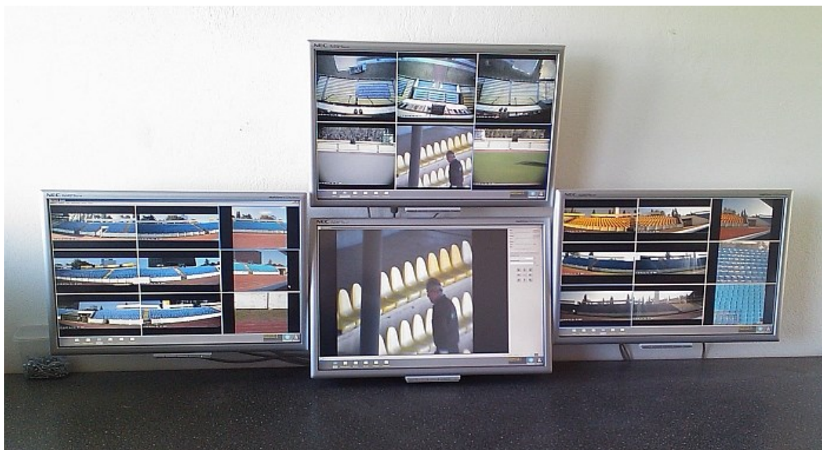
Obr. 18 Místnost operátora [15]

Modularita tohoto řešení dovoluje zachytit současně tolik incidentů, kolik má stadion instalovaných modulů.“ [15]