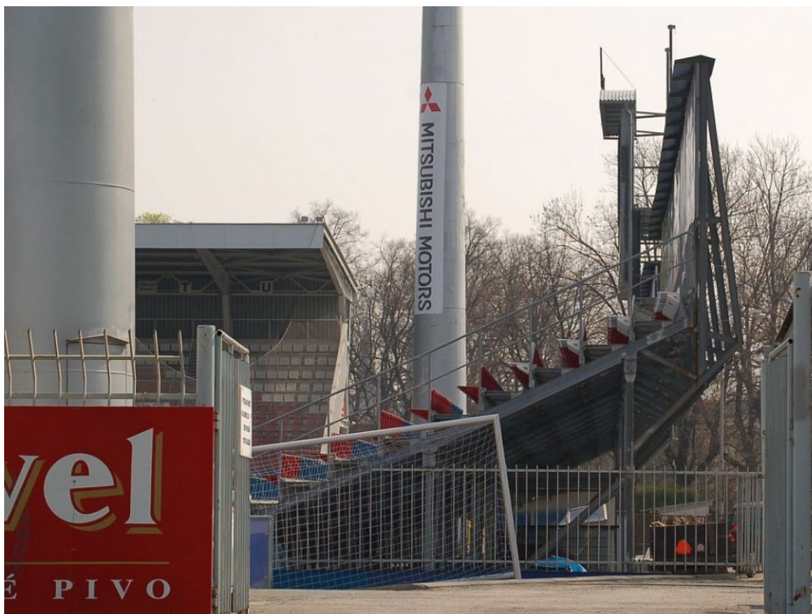
Obr. 13 Boční pohled na tribunu [11]