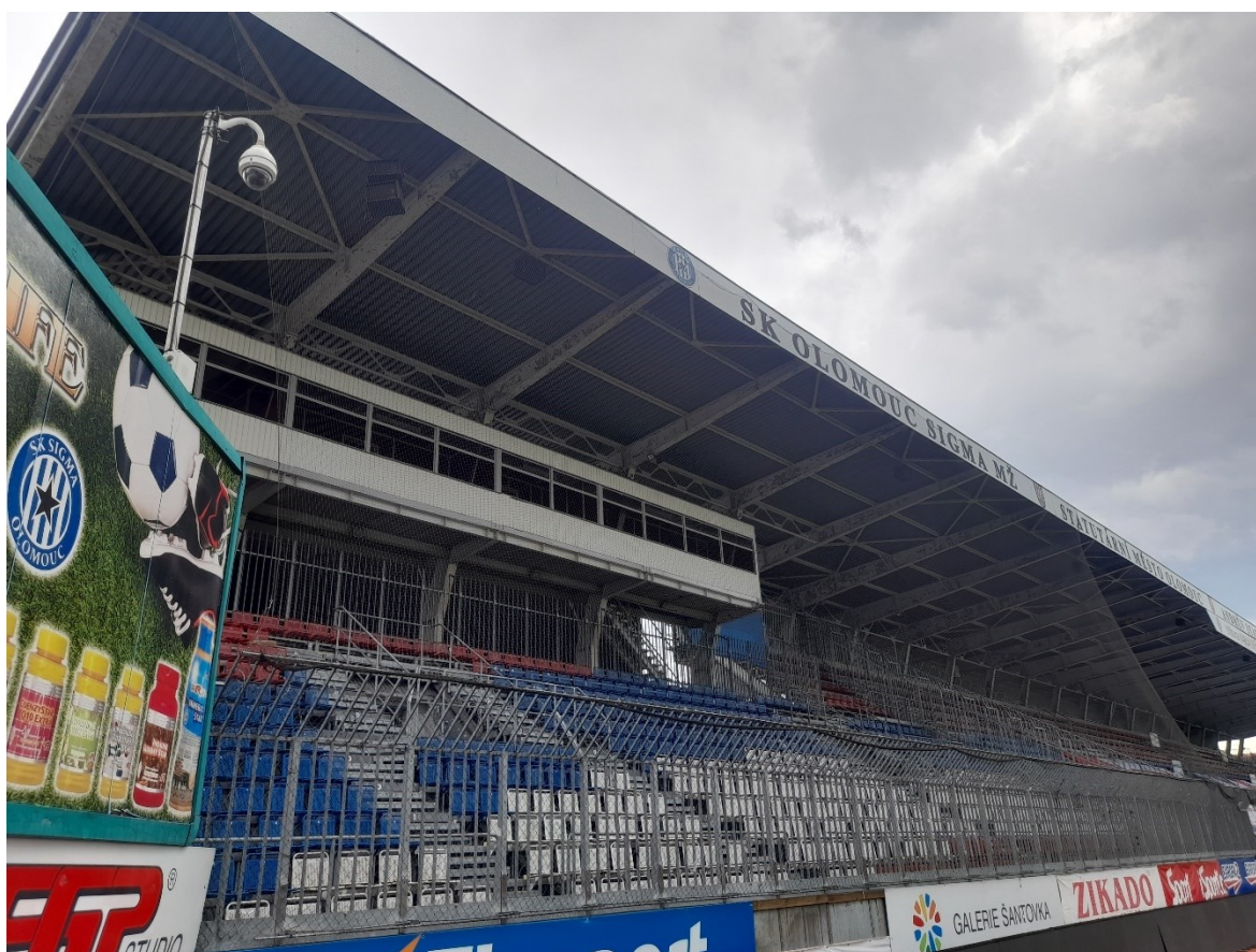
Obr. 9 Sektor hostů [22]