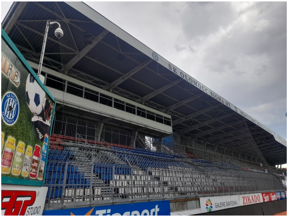
Obr. 20 Důkladně zabezpečený sektor hostů [22]