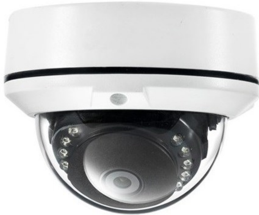
Obr. 17 Venkovní IP kamera [20]