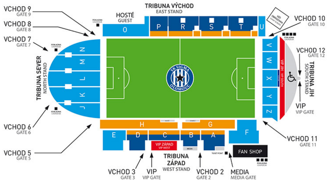
Obr. 2 Plánek Androva stadionu [5]

Každá tribuna má oddělené vstupy. Všechny vstupy jsou vybaveny turnikety. Tribuny nejsou navzájem průchozí. Při vysoce rizikových utkání jsou sektory P a N uzavřeny z důvodu snazšího zásahu bezpečnostních složek. Celý stadion je střežen kamerovým systémem.