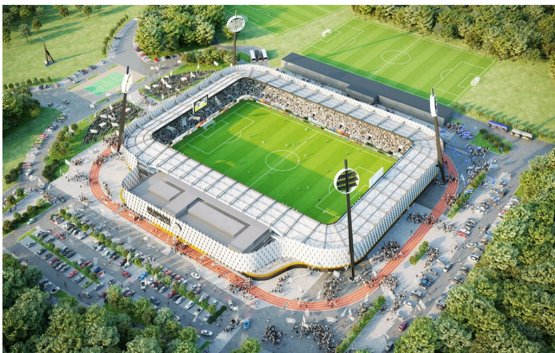
Obr. 16 Návrh nového sportovního areálu [19]

Na Andrově stadionu je největší problém s dopravou fanoušků ke stadionu. Žádná tramvaj ani autobus nejezdí v blízkosti areálu a automobily parkují na velké přilehlé louce. Tudíž v novém projektu stadionu bude vybudováno velké parkoviště. Parkoviště bude podél celého stadionu, aby fanoušci mohli zaparkovat přímo u vstupu svého sektoru a nemuseli stadion obcházet. Celé parkoviště bude střeženo kamerami a bude zdarma pro fanoušky. Také bude zřízena nová autobusová zastávka v blízkosti stadionu a dvě hodiny před fotbalovým utkáním budou posíleny autobusové spoje.