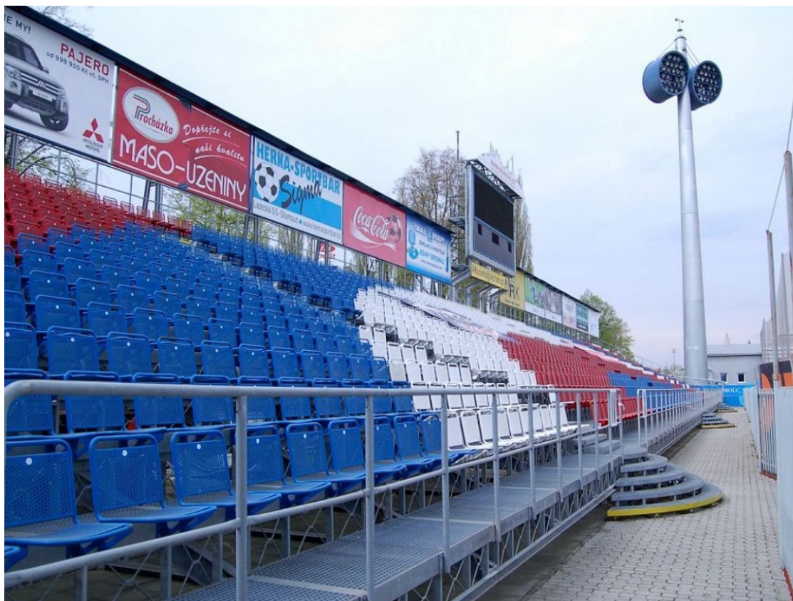
Obr. 12 Původní zmontovaná tribuna [11]

Původní Jižní tribuna byla na přelomu tisíciletí provizorně smontovaná železnou konstrukcí. Tato provizorní konstrukce nesplňovala bezpečnostní kritéria. Neměla dostatečnou kapacitu, minimální mechanické zabezpečení, ale především narušovala estetický vzhled již pěkného stadionu. V roce 2009 byl schválený projekt na rozsáhlou rekonstrukci této tribuny.