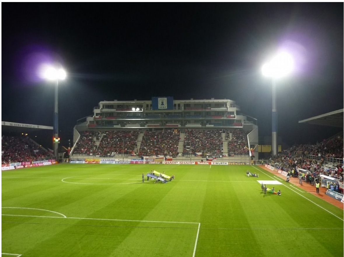
Obr. 15 Slavnostní otevření Jižní tribuny [13]