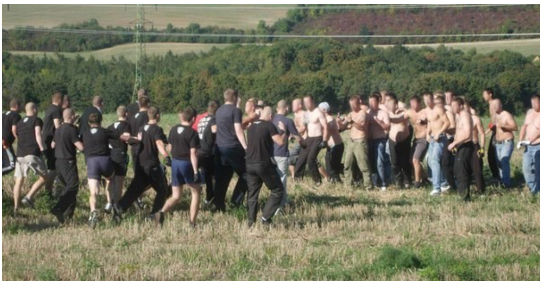
Obr. 11 Fotbaloví Hooligans [18]

Hooligans je tvrdé jádro, kde většina chuliganů ani nesleduje fotbalový zápas, ale především se jdou „porvat“ buď s chuligány druhého týmu nebo s bezpečnostními pracovníky. Tato skupina je vysoce riziková, jelikož je zde velmi pravděpodobné, že dojde k narušení průběhu fotbalového zápasu. A po zvážení situace budou muset zasáhnout bezpečnostní pracovníci. V nejhorších případech může dojít k předčasnému konci utkání, jelikož je ohrožena bezpečnost diváků. Poté následuje vyklizení všech sektorů bezpečnostními pracovníky.