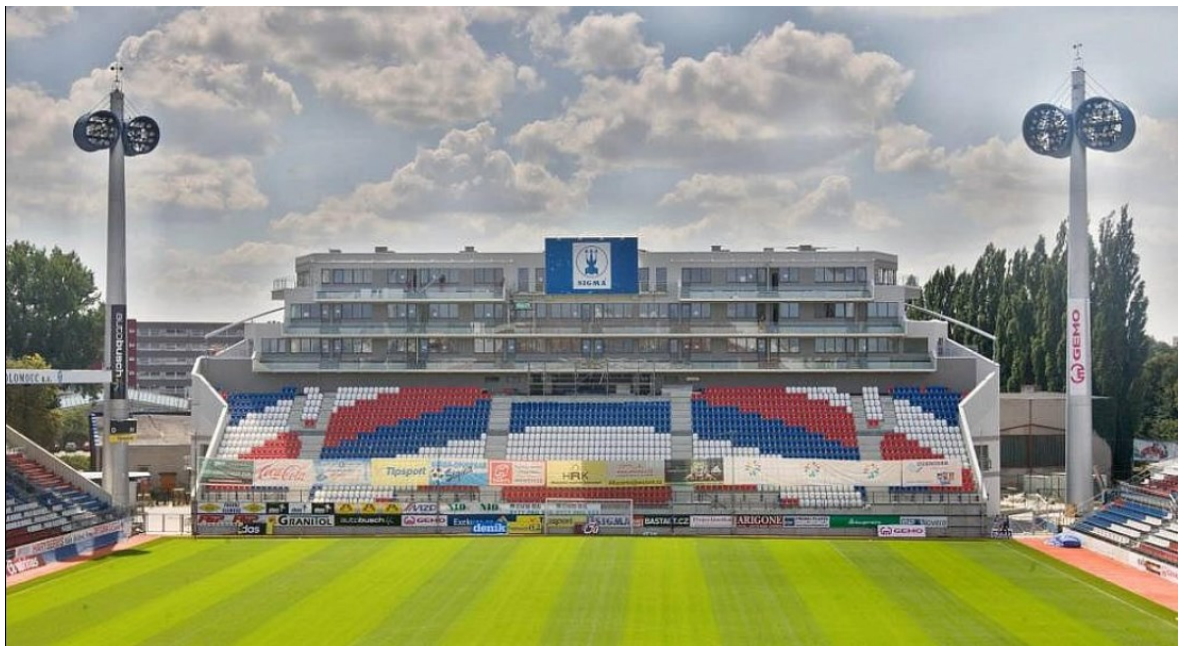
Obr. 14 Pohled na novou Jižní tribunu [12]