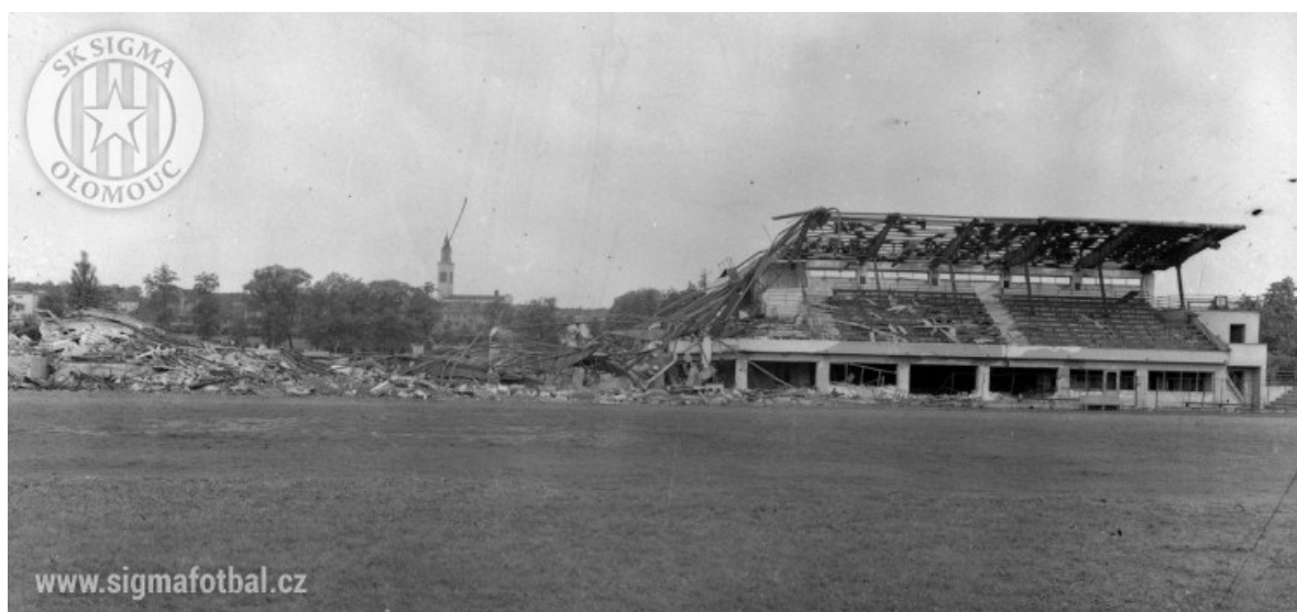
Obr. 2 Železo-betonová tribuna vyhozená do povětří [2]

„Mezitím se na tomto stadionu vystřídalo několik majitelů. V roce 1949 SK ASO Olomouc zanikl a o rok později byl stadion přejmenován na Stadion Míru. Do roku 1955 na jeho trávník hrávalo vojenské mužstvo Křídla Vlasti Olomouc. V dalších letech patřil stadion městu a pak i krátce Slavoji Zora Olomouc. Stadion chátral a v některých letech nebyl vůbec využíván. Mírný obrat k lepšímu nastal v roce 1969, kdy ho dostala k trvalému bezplatnému užívání TJ Sigma MŽ Olomouc. Na stadionu byla prováděna alespoň nejnutnější údržba, a protože sociální zařízení v „babičce“ dřevěné tribuně už naprosto nevyhovovalo, byla v roce 1974 postavena nová budova se šatnami, kanceláři a klubovnou (nynější Fan Shop).