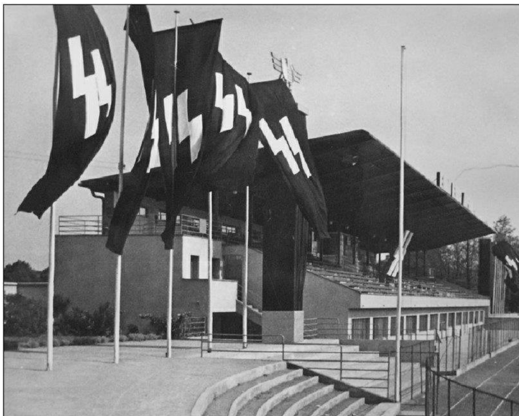
Květen 1943. Stadion Reinharda Heydricha v Olomouci.

projev i protektorátní ministr Emanuel Moravec. Temná léta podtrhoval fakt, že stadion byl poprvé v historii přejmenován. Do konce války nesl od roku 1942 název Reinhard Heydrich Kampfbahn, tedy stadion Reinharda Heydricha.