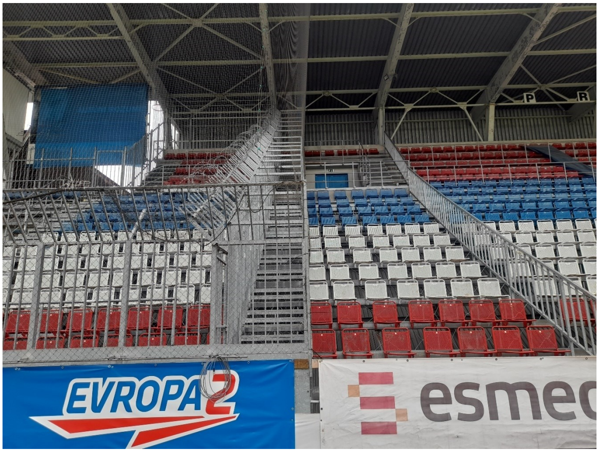
Obr. 7 Zabezpečený sektor hostů [22]