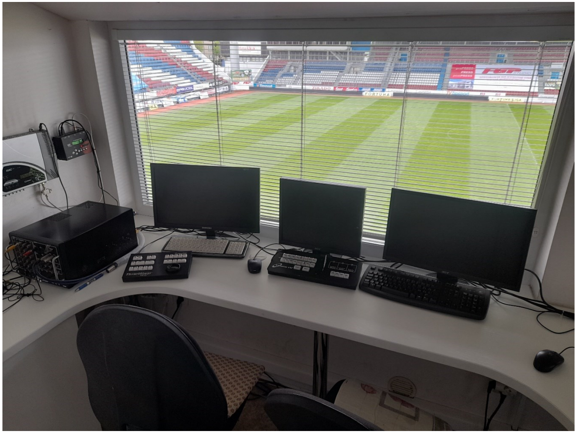
Obr. 8 Velín [22]

Na stadionu se nachází celkem 10 IP kamer, které dokážou přiblížit sledovaný obraz nebo identifikovat pachatele, který se dopustil porušení Návštěvního řádu nebo dokonce trestného čin.