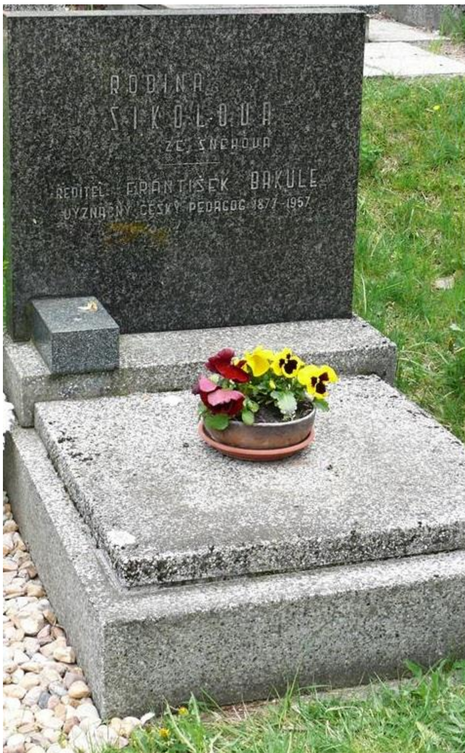
Obrázek 2 Hrob Františka Bakuly