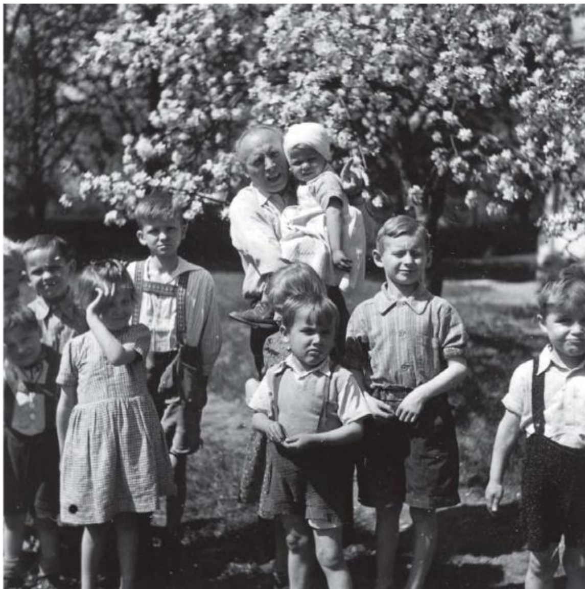
Obrázek 3 Přemysl Pitter s židovskými a německými dětmi po 2. světové válce (akce Zámky)