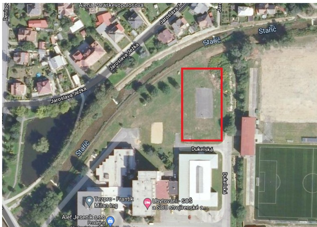
Obrázek 4 Lokace krytého bazénu ve městě Jeseník