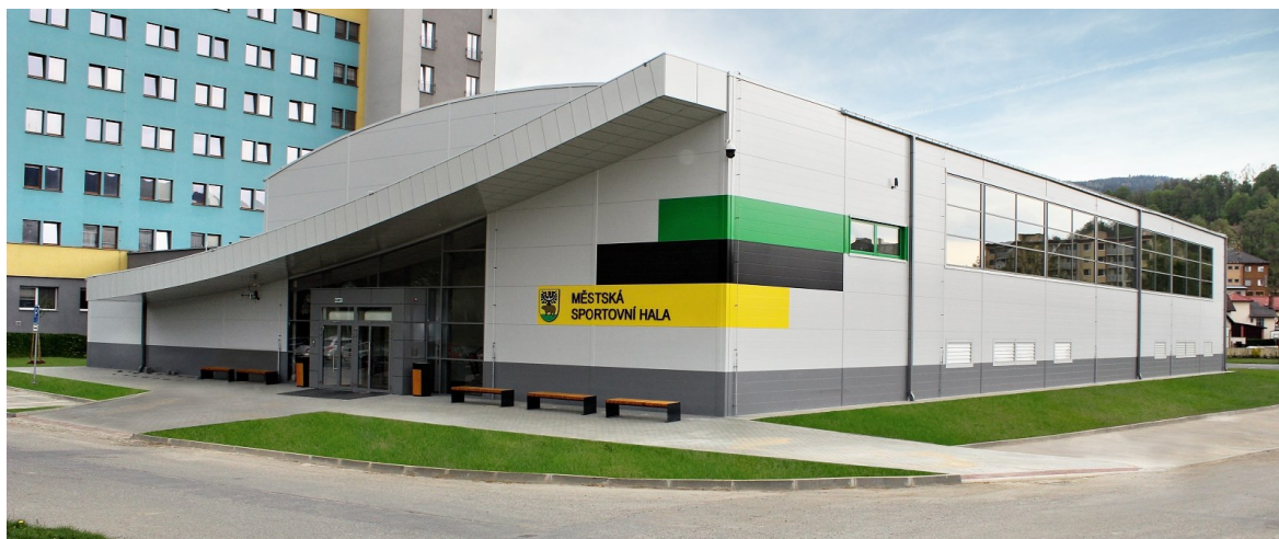
Obrázek 3 Městská sportovní hala Jeseník

Sportovní hala byla otevřena v roce 2018 a kapacita je přibližně 490 návštěvníků. Náklady na výstavbu činily 65 milionů včetně DPH. Olomoucký kraj poskytl na výstavbu nové haly 17 milionů korun, druhým sponzorem byla firma CAMPA-NET a. s., která na výstavbu věnovala 15 milionů korun. Mezi sporty, které se mohou v hale hrát patří tenis, házená, basketbal, florbal, futsal, volejbal. V hale je umístěna i horolezecká stěna. (Jeseník, © 2018)