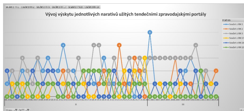
Obrázek 2 Vývoj výskytu jednotlivých narativů za sledované období 1. 2. - 14. 3. 2023 (zdroj vlastní)

Po grafickém znázornění prosté četnosti výskytu narativů užívaných tendenčními zpravodajskými portály, lze díky zvolené analytické metodě zobrazit i průmět nejčastěji se vyskytujících narativů v monitorovaném čase. Autor zobrazuje na Obrázku 2 ilustrativní pohled na zkoumanou situaci. Pro lepší zobrazení a čitelnost je uvedený obrázek obsahem Příloh.