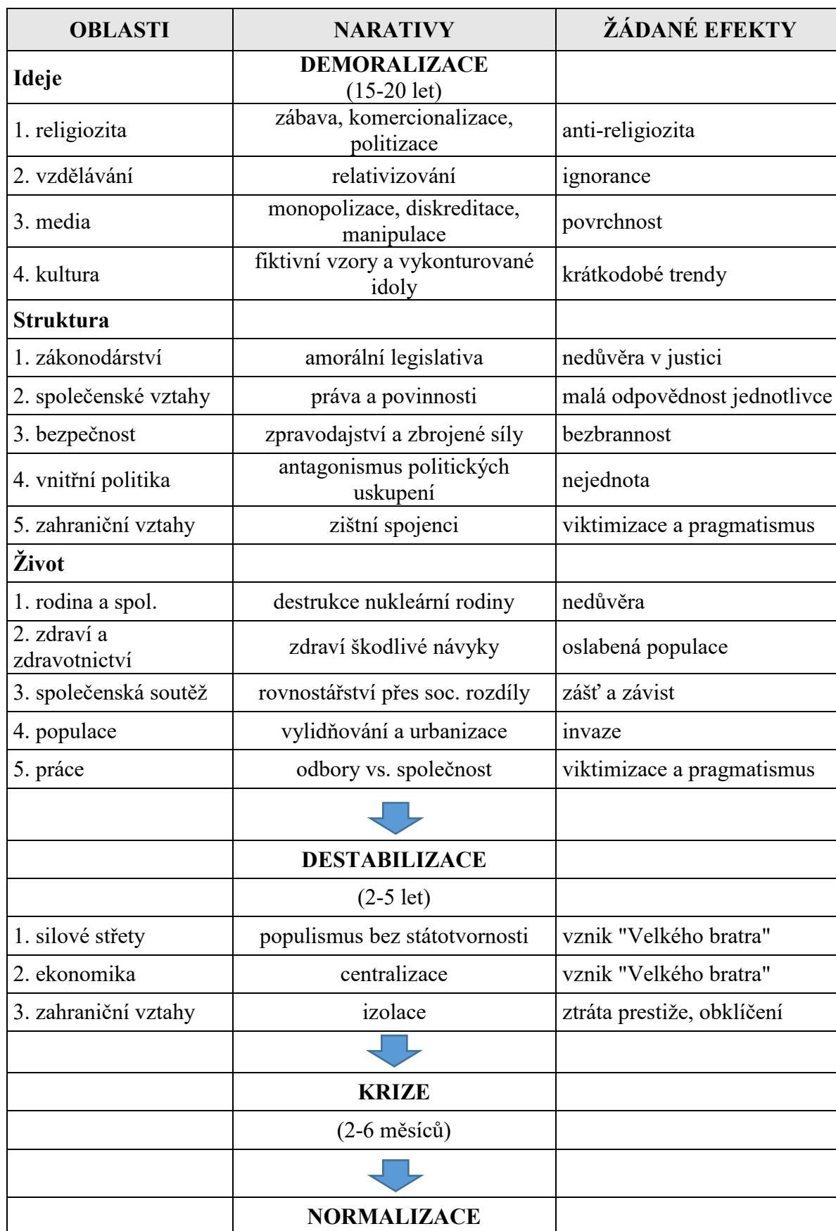
Tabulka 3 Stádia procesu rozvratu [vlastní zpracování (Shuman 1984)]