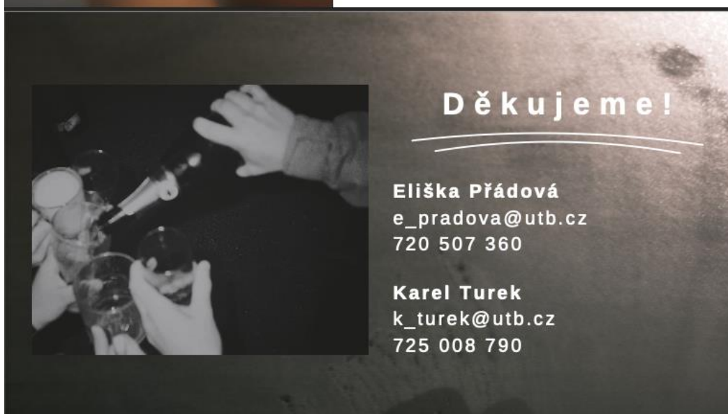
Obrázek 1 Ukázka snímků prezentace krátkého filmu Chata na Akcelerator ČT