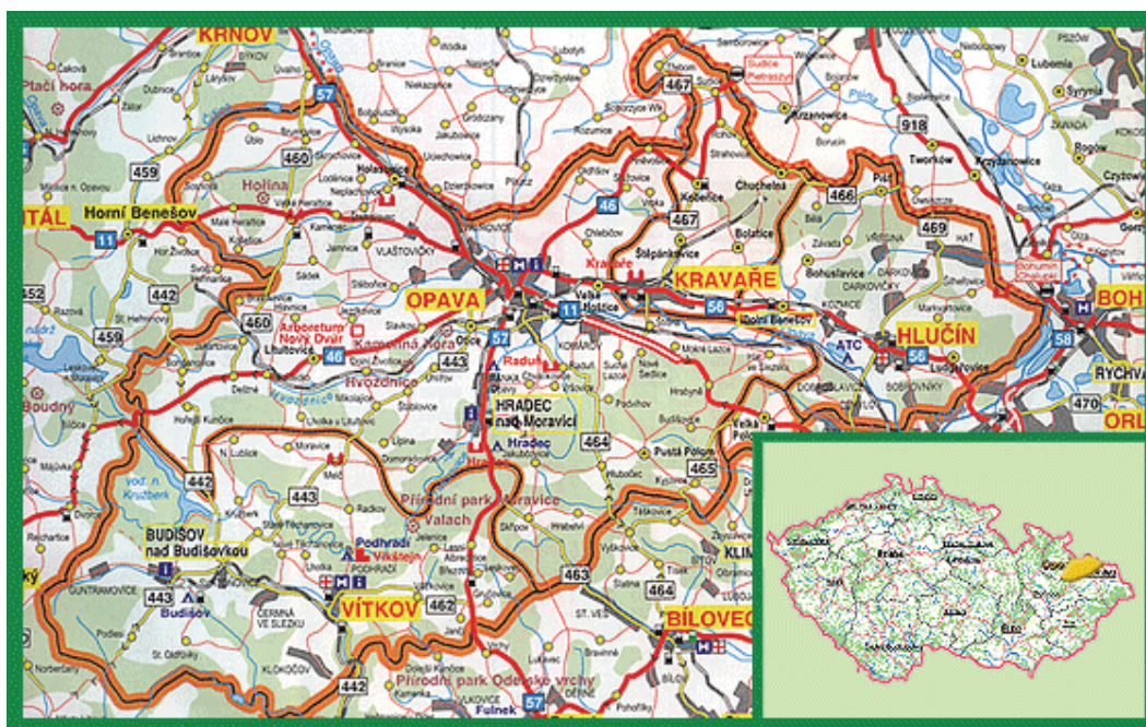
Obr. 1. Mapa okresu Opava

Opavský okres se skládá z 80 obcí, které se dále člení na 152 částí obcí. Sedm z nich má statut města (Budišov nad Budišovkou, Dolní Benešov, Hlučín, Hradec nad Moravicí, Kravaře, Vítkov a Opava). Přibližně 48 % obcí má méně než 1 000 obyvatel. Malé obce jsou především v západní a jihozápadní části Opavska. Pro statistické a analytické potřeby a pro potřeby EU je opavský okres vymezen jako územní jednotka NUTS 4.