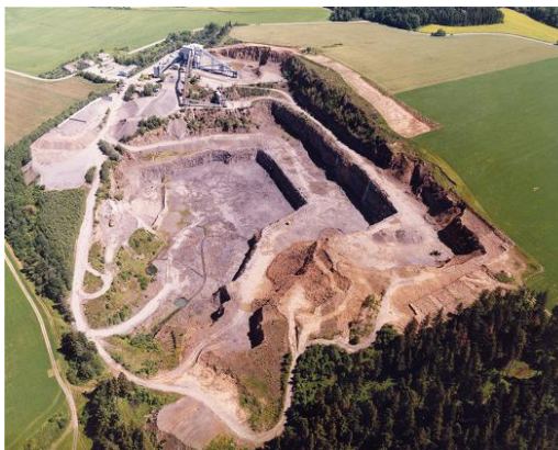
Obr. 3. Kamenolom Bohučovice

občanů), ostatní práce jako je nakládka materiálu, doprava atd. jsou zajišťovány prostřednictvím externích dodavatelských firem sídlících mimo region.