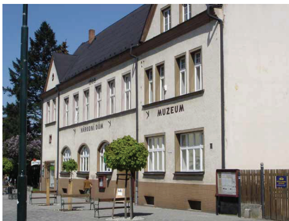
Obr. 4. Národní dům

V historicky cenné budově Národního domu v současné době sídlí městská knihovna, kino městské kulturní středisko, pobočka České pojišťovny a restaurace. Národní dům (Obr. 4) slouží také pro potřeby ochotnického divadla a hradeckých hudebních skupin, pořádají se zde kulturní vystoupení.