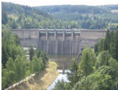
Obr. 2. Vodní nádrž Kružberk

Opavsko náleží k Baltskému úmoří, je odvodňováno řekou Odrou. Významný tok, který územím protéká, je řeka Opava s největším pravostranným přítokem řekou Moravicí. Důležité místo na Opavsku zaujímají ve vodním hospodářství zdroje pitné vody. Významná z tohoto pohledu je vodní nádrž Kružberk (Obr. 2), vybudovaná na řece Moravici. Vodní nádrž o ploše 306 hektarů slouží jako zásobárna pitné vody i pro Ostravský region a rovněž jako ochrana před povodněmi.