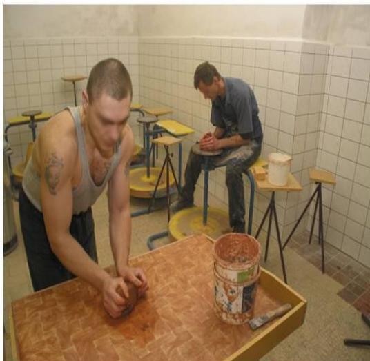
Odsouzení v keramické dílně