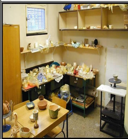
Dílna s hrnčářským kruhem