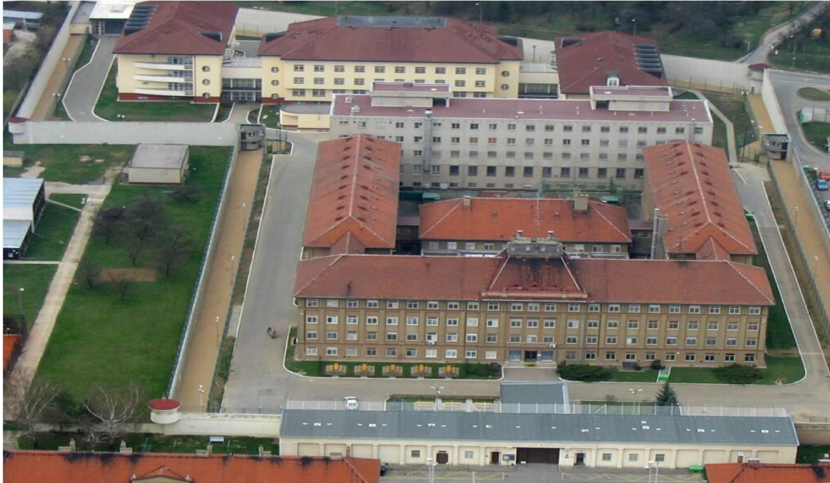
Letecký pohled na objekt věznice v Brně - Bohunicích