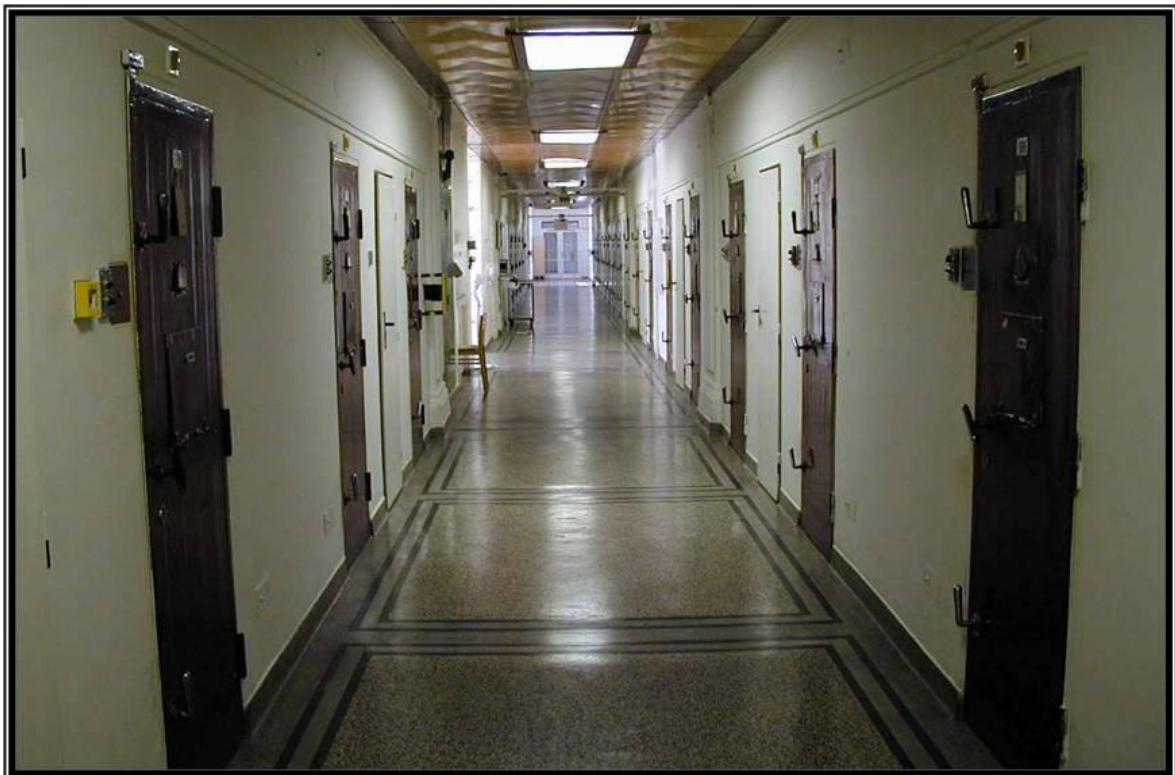
Oddělení pro výkon trestu odnětí svobody s ostrahou