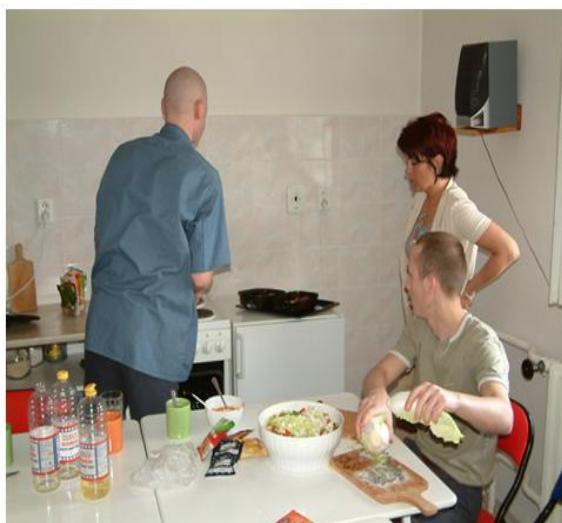
a při kurzu vaření